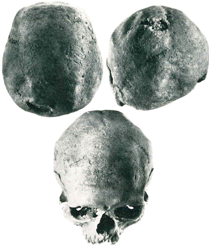
Fig. 1 - Il calvario n. 6 della necropoli eneolitica del Gaudio: norma superiore; norma posteriore; norma anteriore.

destra ha il lato maggiore di circa 63 mm e il minore di circa 55 mm; la depressione di sinistra ha i lati rispettivamente di 57 mm e di 51 mm. I bordi anteriori di ogni depressione distano dalla sutura coronale circa 25 mm; quelli posteriori circa 35 mm dalle branche della sutura lambdoidea. Un piccolo rilievo grosso modo in diagonale divide la depressione di sinistra in due aree ineguali (la posteriore è più grande e più profonda); a destra il rilievo è meno sentito; questi rilievi probabilmente corrispondono ad un residuo di diploe.