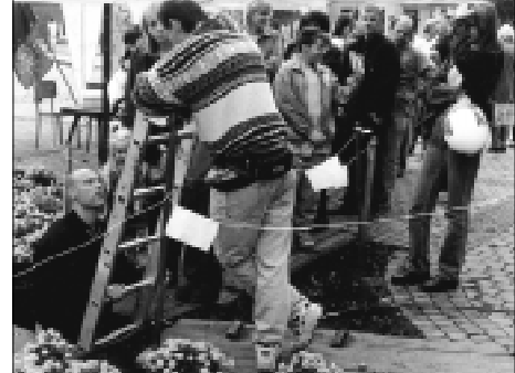
Do čtýmetrové hloubky se lidé postoupili po žebříku, aby si prohlédli pozůstatky Pražské brány a předsumtého opevnění.

nahrad své věrně a ti si přinášeli svůj majetek. Z románského kostela pochází vzácná dlaždice s vyobrazením císaře Nera a bájeho ptáka. Nálezce surovoho železa svědčí, že Žatec patřil v 11. a 12. století k jeho největším výrobcům. Během výzkumu bylo v Žatci vykopáno tisíc kosterních pozůstatků, jejichž zkoumáním se zabývá mezinárodní tým.