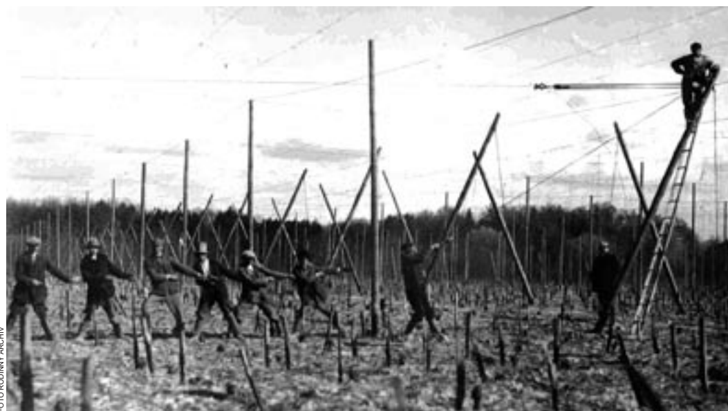
Unikátní snímek přibližuje stavbu drátěny na vinici v Berehovu.

Svatba byla v lounském československém kostele. V neděli