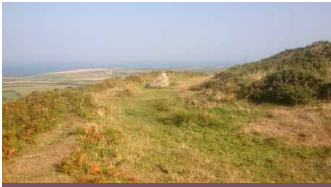
Olion rhagfur Castell Odo i'w weld ar y chwith a Charreg Samson yn y canol

Ar Fynydd yr Ystum, gyferbyn â Bodwrdda rhwng Rhoshirwaun ac Aberdaron (B4413) mae Castell Odo. Ychydig o olion sydd wedi goroesi ond mae ychydig o'r mur dwbl a oedd o'i gwmpas a'r tir anwastad yn y canol yn dangos ei leoliad. Mae'r olion llosgi a oedd i'w weld wrth gloddio yn profi mai coed oedd yr unig amddiffynfa fu yma.