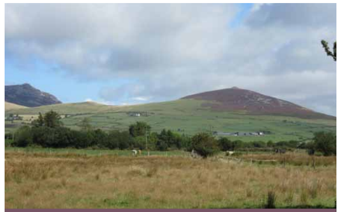
Moel Carnguwch a Tre'r Ceiri (chwith)

Erbyn diwedd yr Oes Neolithig daeth Pobl y Bireci (2800 – 1800CC) i fyw ym Mhrydain. Prin yw'r dystiolaeth o'r cyfnod hwn ond mae bedd cist, un ag ochrau carreg iddo wedi'i ddarganfod, yn Llithfaen. Roedd corff dyn tua 1.8 fetr o daldra yn gorwedd ar ei ochr dde ynddo yn ogystal â bicer.