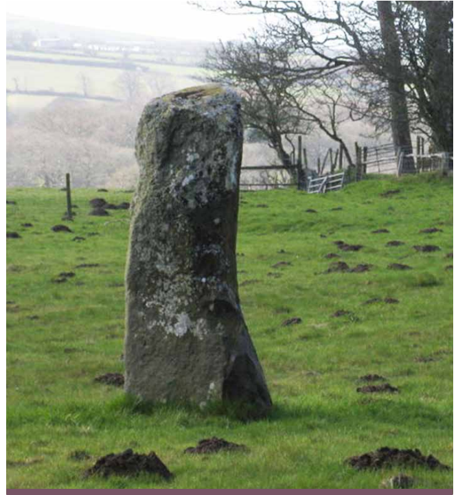
Maen Hir Meillionen, Boduan

Mae dyddio'r meini'n parhau'n ddirgelwch ond mae cytundeb iddynt gael eu codi yn gynnar yn Oes yr Efydd (2500-1500 CC).