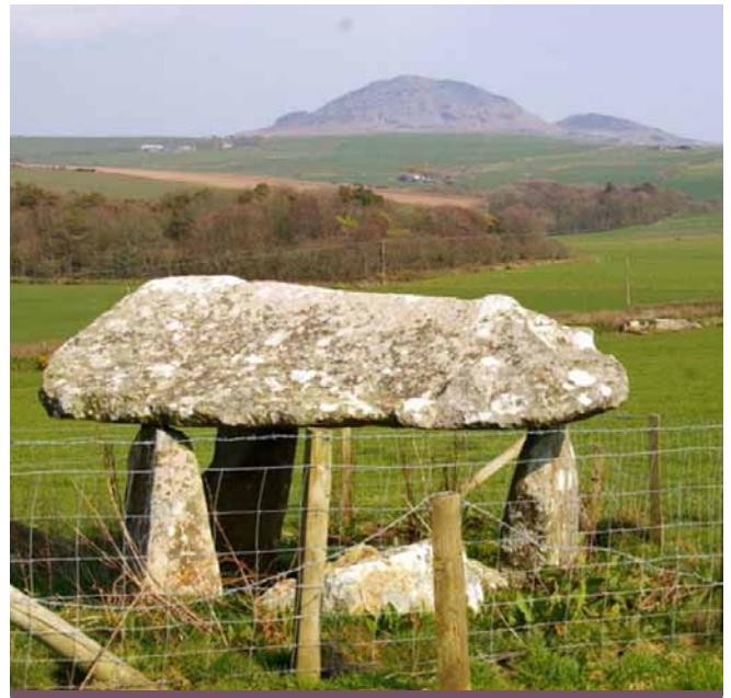
Coeten Arthur, Cefnamwlch

Cafodd cromlechi Llŷn eu codi yn yr Oes Neolithig Gyfnar (hyd at 4,000 CC). Roedd y beddrodau hyn mewn lleoedd amlwg, ar godiad tir, ar yr arfordir neu ble mae golygfa glir o fynydd.