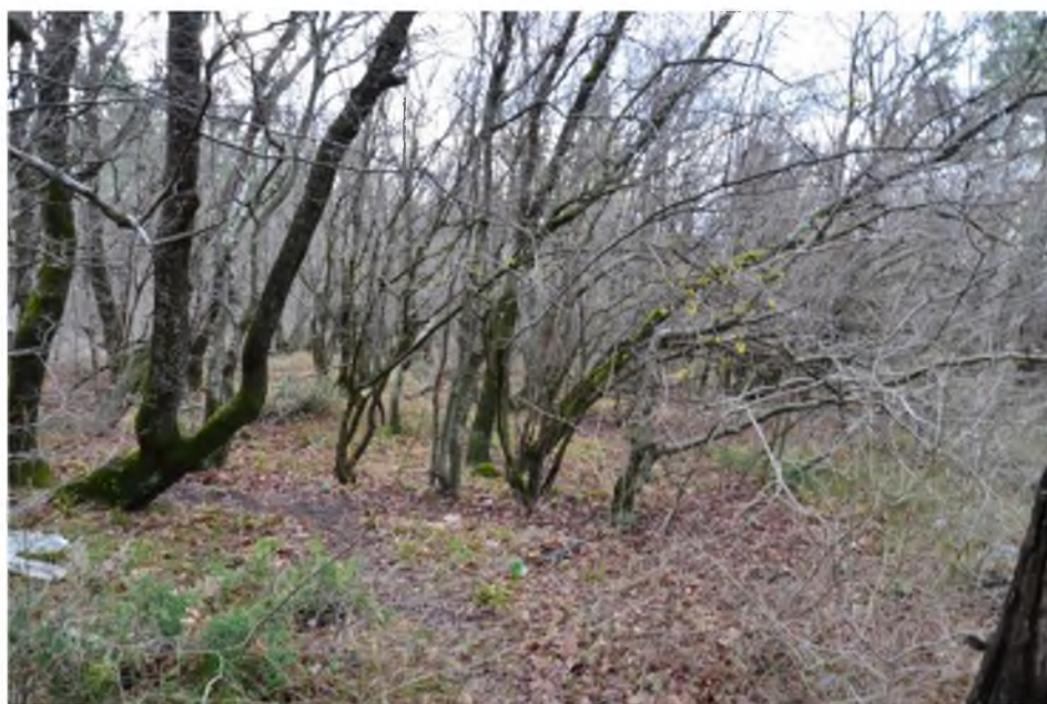
Рисунок 2. - Грабово-дубово-разнотравная ассоциация

Рисунок 1. а), б) – Селитебная территория памятника природы «Родник Яблонька»