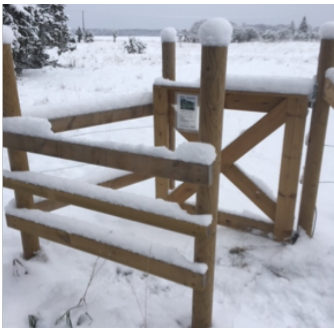
Vinkelgenomgång som leder till strandängen

Från första parkeringen vid Ledskär är det 500 meter till fågeltornet. Från parkeringen går en upptrampad stig genom ett skogsparti, delar av stigen har uppstickande rötter. Efter skogspartiet finns en vinkelgenomgång som leder in till strandängen. Ängen kan vara väldigt blöt, särskilt under våren. Rödmarkerade stolpar, som ibland kan vara svåra att se, leder dig sedan till fågeltornet.