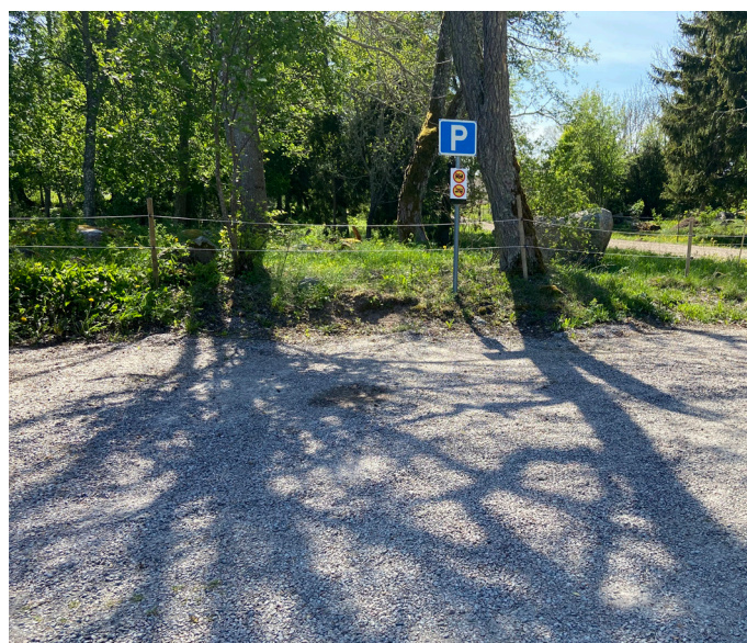
Parkeringen vid hamnen