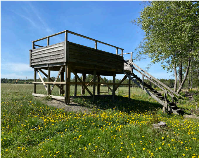
Fågelplattformen vid Fladen

Fågeltornet vid Fladen är en rymlig plattform. En trappa med räcken på båda sidor leder upp. Härifrån får du en fin utsikt över en våtmark med tidvis rikt fågelliv.