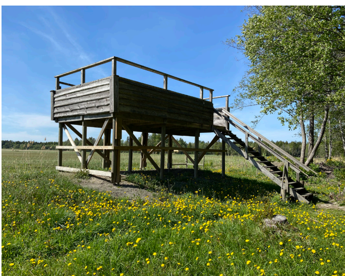
3. Fågelplattformen vid Fladen