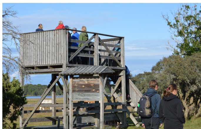
1. Fågeltornet på Ledskärsängen