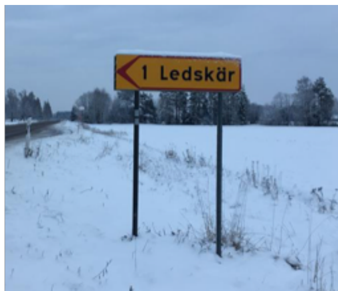
Skylden som pekar in mot Ledskärs-parkeringen från bilvägen.

Busshållplatsen vid Ledskär heter Ledskärsvägen. Härifrån är det en kilometer att gå till naturområdet.