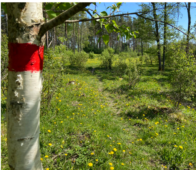
Röda markeringar längs med stigen från fågeltornet till hamnen.

Precis innan fågeltornet finns en till stätta, och bakom den en stig som leder till hamnen. Stigen är upptrampad och tydligt markerad med röda prickar och stolpar. Delar av stigen består av stenig och ojämn mark. Vill du gå kortaste vägen till hamnen följer du istället bilvägen från första parkeringen.