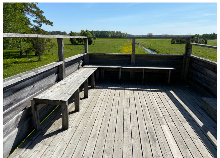
Uppe i fågeltornet