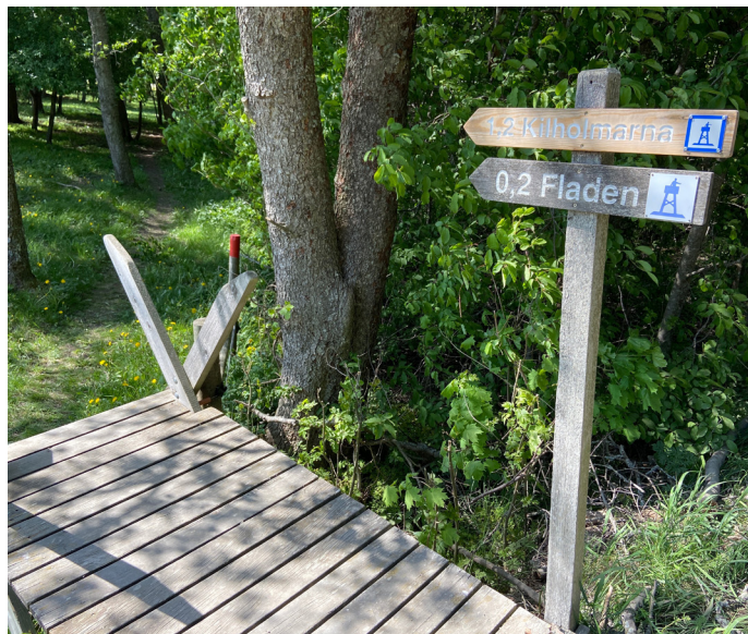
Stättan och vägvisaren mot Fladentornet

Från första parkeringen vid Ledskär går du 100 meter längs med bilvägen mot hamnen, tills du kommer till en stätta och en skylt med en pil åt vänster som säger "0.2 Fladen". Använd stättan för att komma in i hagen och följ sedan staketet på höger sida. Efter 200 meter är du framme vid fågeltornet. Stigen kan vara mycket blöt vissa tider på året.