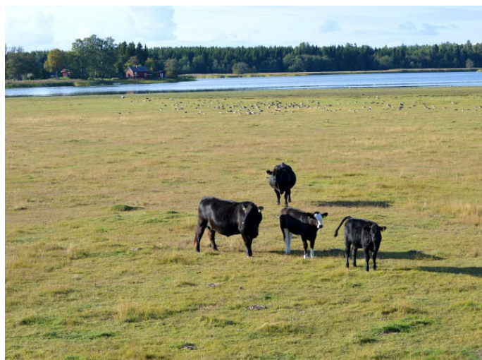
Kor på Ledskärsängen, nära fågeltornet.

Flera av stigarna i naturområdet passerar strandängar där det under sommartid går kor.