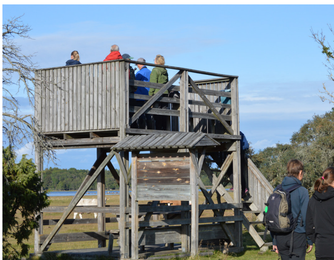
1. Fågeltornet på Ledskärsängen