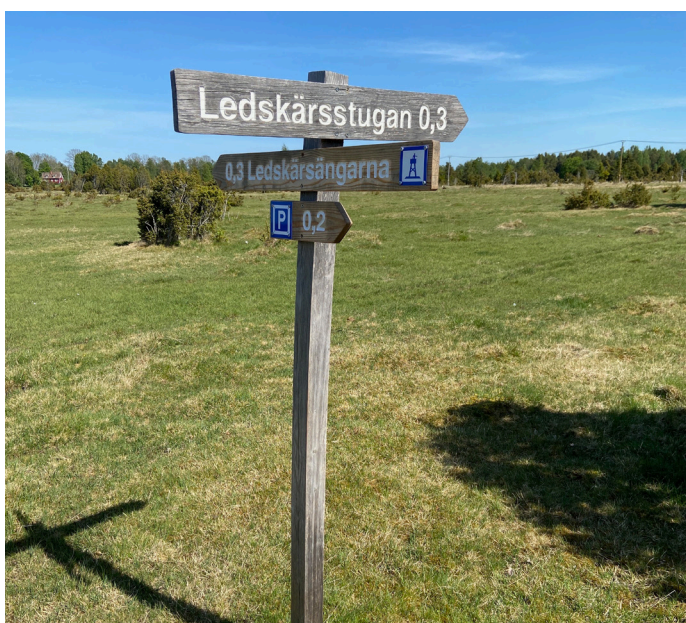
Vägvisare på väg till fågeltornet på strandängen, som visar vägen till Ledskärsstugan.