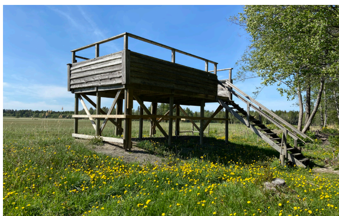
3. Fågelplattformen vid Fladen