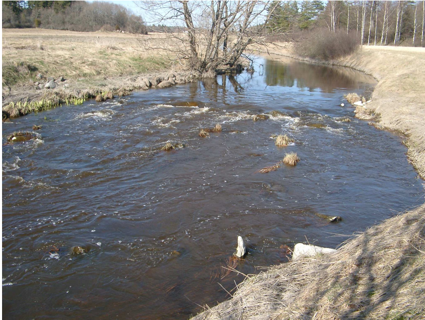
Figur 3. Sävjaån. Övre delen av lokalen Spångtorp övre. Lokalen är en av de större i Sävjaån. Rom hittades över hela den 50 m långa leklokalen.