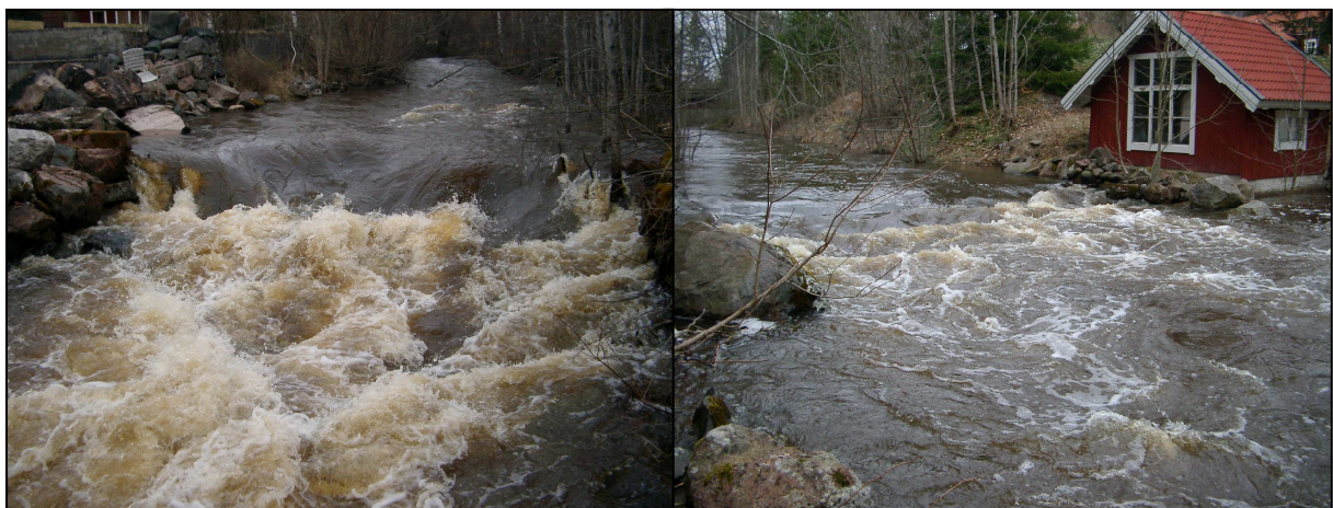
Figur 6. Nedersta vandringshindret i Vistebyån strax uppströms Visteby. Det är ytterst tveksamt om asp kan passera här. Datum 12/4-05.

Det finns tre dämmen i Vistebyån. Två ligger i Visteby och ett strax nedströms Nedre Långsjön. Dämmet nederst i Visteby utgörs av en helt raserad kvarn vars rester stoppar fiskvandring (Figur 6). Dämmet isolerar fisk i Långsjöarna och skär av leklokaler för fisk från Ekoln/Funbosjön. Detta dämme bör ha högsta prioritet vad gäller åtgärder. Det övre av de två dämmena i Visteby är relativt nybyggt, möjligen utan tillstånd, och utgörs av en dammvall av sten och en liten "hobbykvarn" (Figur 7). Fisk kan troligen ta sig förbi vid höga flöden men