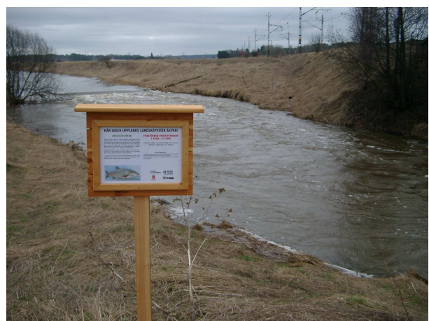
Figur 9. Informationstavla vid Åby, Sävjaån.

Inom projektet fanns uppgiften att informera om aspen och det rådande fiskeförbudet efter asp under våren. En folder (bilaga 1) om aspens situation sammanställdes och distribuerades via sportfiskebutikerna i Uppsala. Vid flera av lokalerna sattes informationstavlor upp som informerade om aspen och det rådande fiskeförbudet efter asp (figur 9). Informationstavlorna sitter i Sävjaån vid lokalerna, Åby, Falebro, Funbo kyrka och Enbyle. En tavla sitter även vid Ölsta, Sävaån.