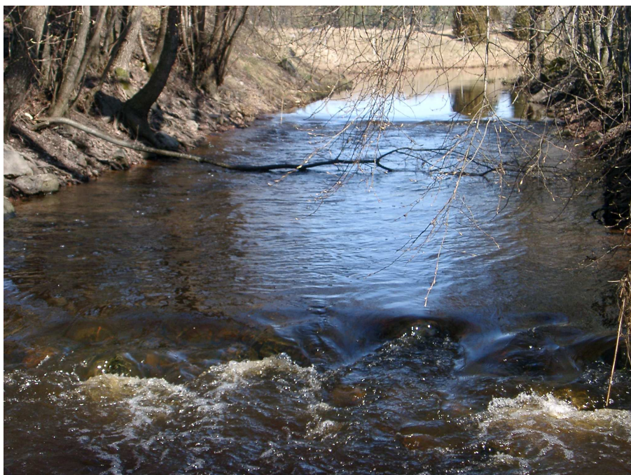
Figur 4. Almunge mellersta. I förgrunden syns en av de klackar som håller en tillräcklig hög nivå för att aspen ska kunna leka.