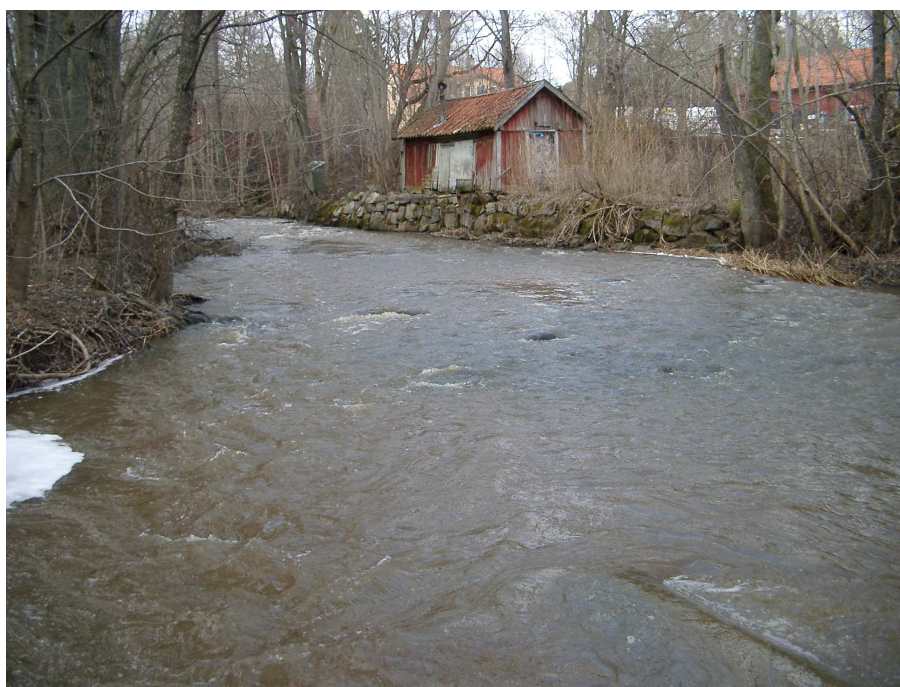
Figur 5. Hågaån. Den potentiella leklokalen vid Lurbo.

Avrinningsområdet är 123 km 2 och domineras av skogsmark. Området närmast ån utgörs nästan helt av jordbruksmark, vilket gör att ån är kraftigt näringsbelastad (Brunberg & Blomqvist 1997). Det första vandringshindret från Mälaren sett är beläget vid Kvarnbo. Två lokaler inventerades, varken rom eller asp hittades.