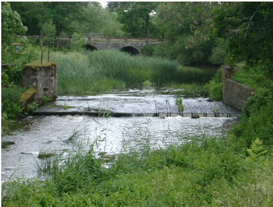
Figur 8. Örsundaån vid Vånsjöbro. Det delvis raserade dämnet överst på leklokalen vid Vånsjöbro kräver endast små åtgärder för att tillåta fiskpassage. Åtgärdas hindret kommer fisk att nå strömsträckorna nedströms Härnevi kvarn. Fotot är taget efter leken.

I Örsundaån måste aspen vandra ända upp till den hittills enda kända leklokalen vid Vånsjöbro för att leka. Leklokalen börjar strax nedströms dämnet och sträcker sig 250 m nedströms. Flera lekfiskar siktades och rom fanns längs hela sträckan. Vissa delar av botten var till stor del täckt med rom! Leklokalen är av hög kvalitet och bör på något sätt skyddas mot framtida ingrepp. Dämnet utgör ett vandringshinder även om fisk möjligen kan ta sig förbi vid mycket höga flöden. Asp tar sig enligt sportfiskare förbi hindret under vissa år med mycket höga flöden. Om små åtgärder sätts in vid det redan raserade dämnet (Figur 8) kommer fisk att ha helt fri vandringsväg upp till en lång strömsträcka nedströms Härnevi kvarn.