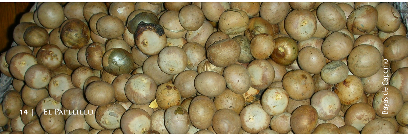
Bayas de Capomo

El ganado también consume estas frutas y por ello a los ganaderos les gusta mantener 'capomeras' en sus terrenos, generando múltiples servicios ambientales para todos. Las semillas ricas en nutrientes son cosechadas, procesadas y comercializadas por familias locales, quienes valoran estos bosques por su belleza y el medio de vida que proveen.