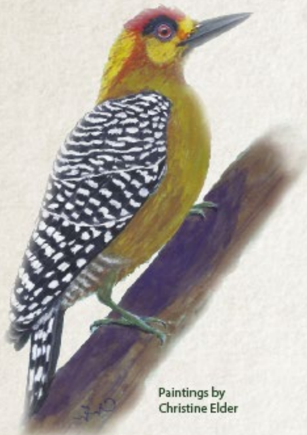
Paintings by Christine Elder

Punto de reunión en el Salón de las Flores en el Centro de Visitantes Hacienda de Oro.