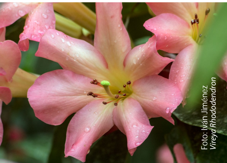
Vireya Rhododendron

Mientras el trabajo continúa, esperamos que el techo de este edificio se termine a tiempo para esta dedicatoria.