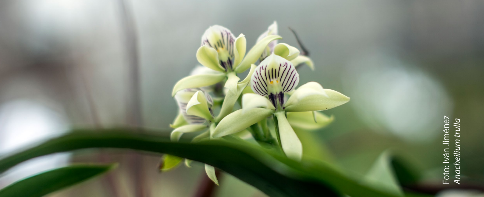
Anacheilium trulla