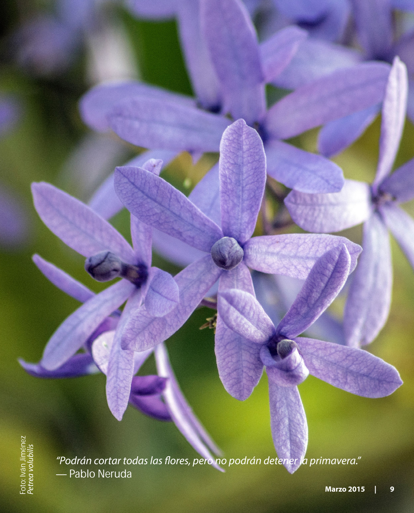
Petrea volubilis

"Podrán cortar todas las flores, pero no podrán detener la primavera." — Pablo Neruda