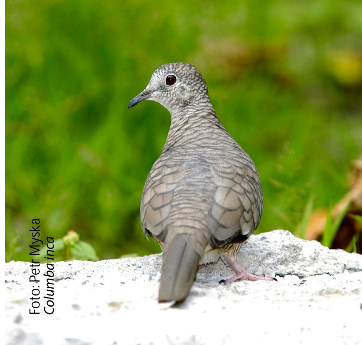
Columbiga inca

Quienes no puedan visitarnos durante el Festival de Aves de Vallarta, no hay de qué preocuparse, a lo largo de todo el año ofrecemos el "jueves de madrugadores", todos los jueves a las 8:00 am, incluido en el costo normal de entrada. Tenemos binoculares disponibles a la renta y usualmente contamos con voluntarios que apoyan en la identificación de las aves y guían hacia los lugares más frecuentados por algunas especies en particular. Disfruta del Jardín en las tranquilas horas de la mañana para obtener las mejores oportunidades de avistamiento.