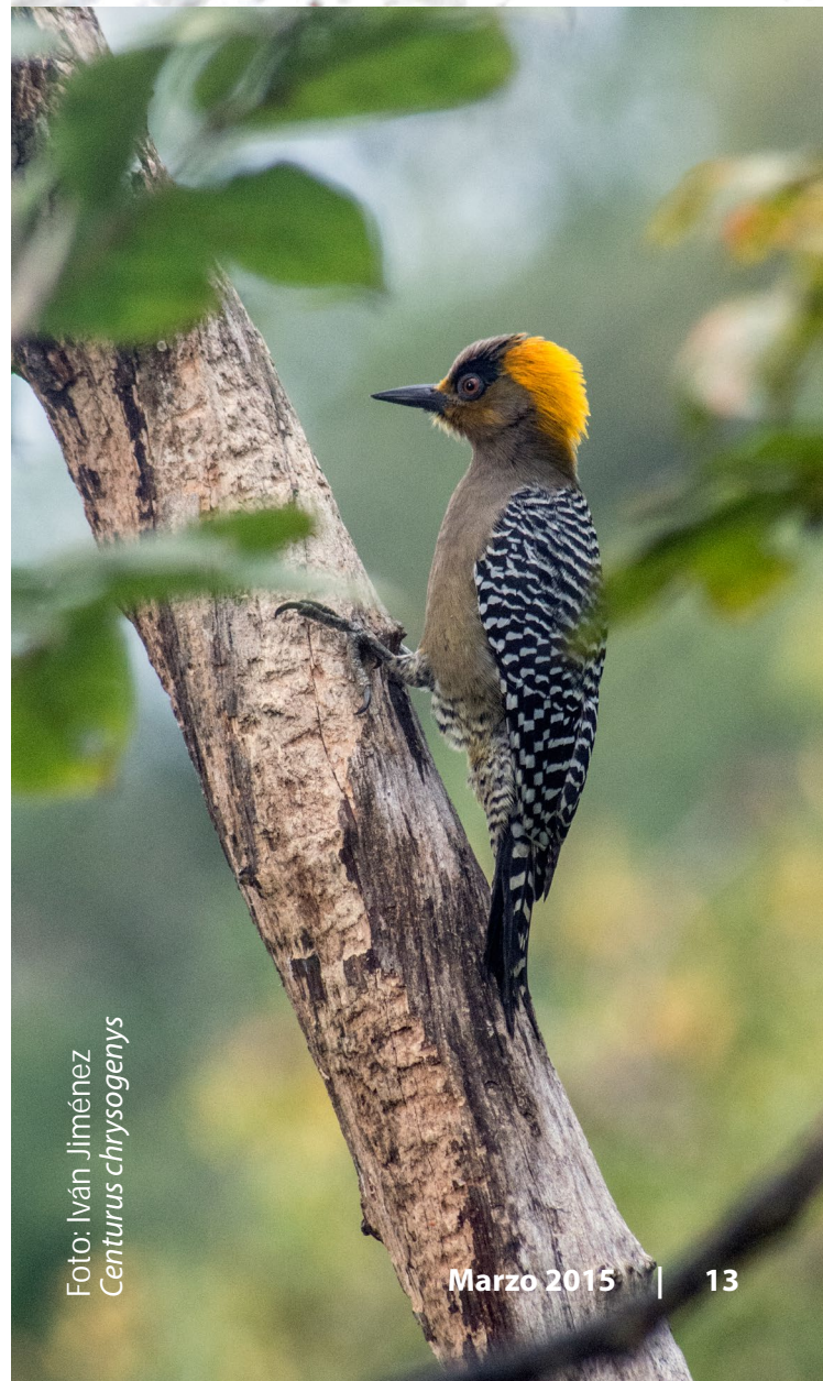
Centurus chrysogenys