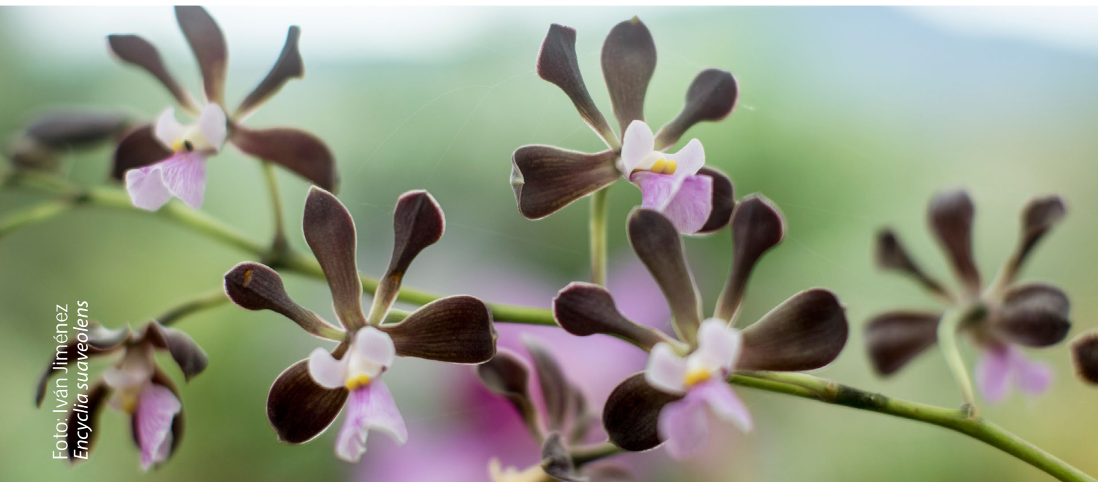
Encyclia suaveolens

Si no has dejado un comentario en TripAdvisor acerca del Jardín Botánico de Vallarta, por favor hazlo hoy.