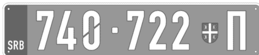
Цртеж бр. 18