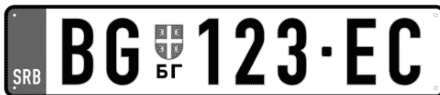
Цртеж бр. 2