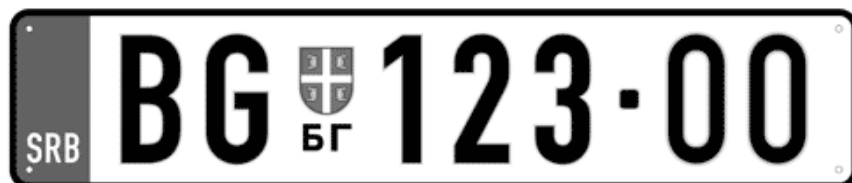
Цртеж бр. 9