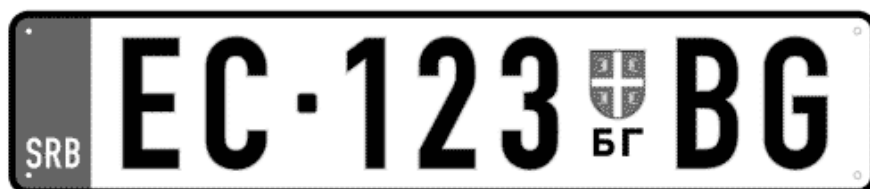
Цртеж бр. 4