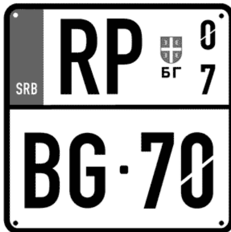
Цртеж бр. 20