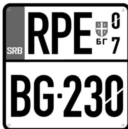
Цртеж бр. 22