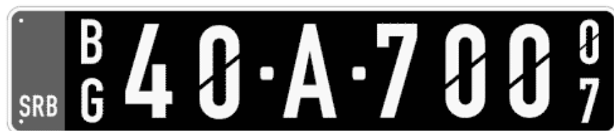
Цртеж бр. 5