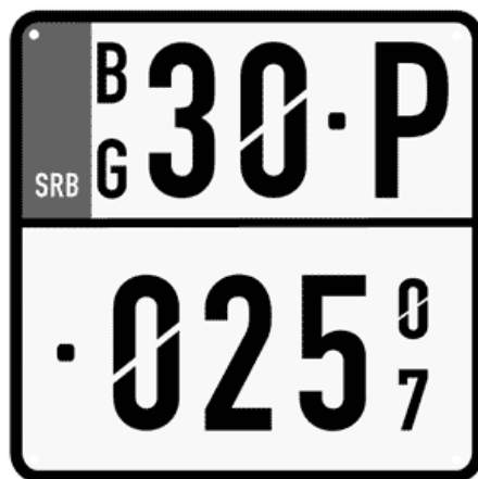
Цртеж бр. 15