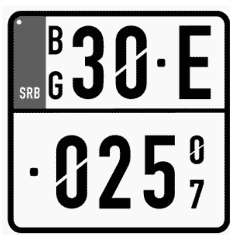
Цртеж бр. 16