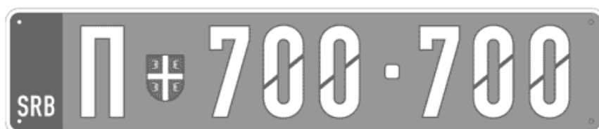
Цртеж бр. 17