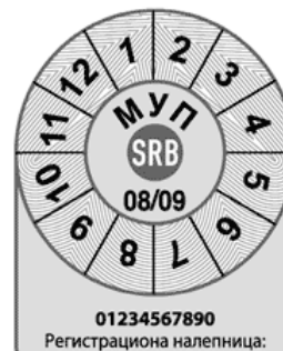
за примену са спољашње стране