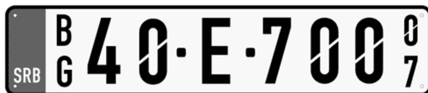
Цртеж бр. 8