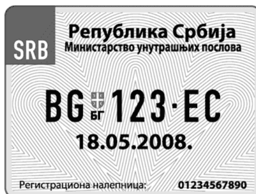
за примену са унутрашње стране