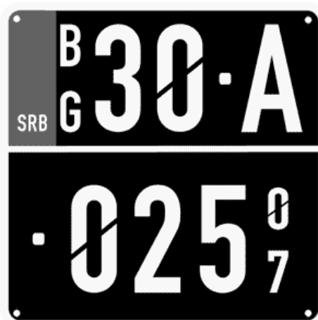
Цртеж бр. 13