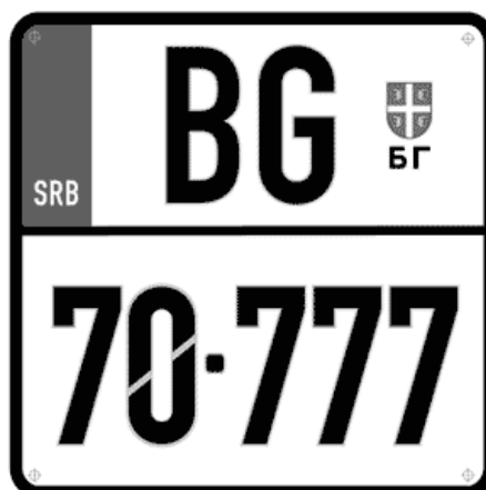
Цртеж бр. 3