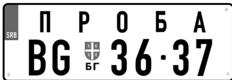
Цртеж бр. 23

А В С Ѓ Ќ Д Ђ Е Ф Г Н И Ј К Л М Н О П Р С Ѓ Т У В З Ѓ W X Y 1 2 3 4 5 6 7 8 9 0