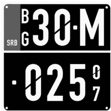
Цртеж бр. 14