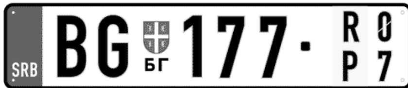
Цртеж бр. 19