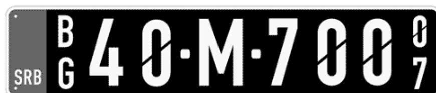
Цртеж бр. 6