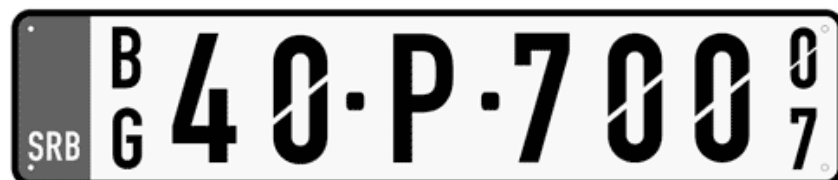
Цртеж бр. 7