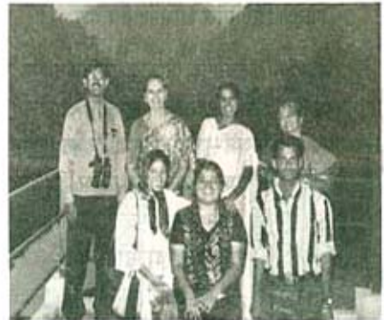
रेणुकाजी संक्युरीतील एक छायाचित्र

२८ ऑक्टोबरला रात्री ११ वाजता दादर-अमृतसर-दादर या गाडीने सहलीची सुरुवात झाली. आम्ही ३० ऑक्टोबरला सकाळी ९.३० वाजता अंबाल्याला पोहोचलो. येथून आम्ही रेणुकाजीसाठी रवाना झालो.