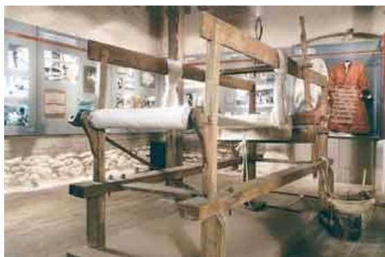
Η αποψη της έκθεσης του Μουσείου Μετάξης Σουφλίου.

Το Πολιτιστικό Ίδρυμα Ομίλου Πειραιώς, στο οποίο ανήκει πλέον το Μουσείο, με τη συνεργασία της Περιφέρειας Ανατολικής Μακεδονίας και Θράκης πρόκειται να προχωρήσει στην επανέκθεση του Μουσείου και στην επέκτασή του στον πάνω όροφο του αρχοντικού Κουρτίδη για να δημιουργηθεί στο κτίριο μία αίθουσα πολλαπλών χρήσεων. Στην αίθουσα αυτή προγραμματίζονται εκπαιδευτικά προγράμματα και διάφορες πολιτιστικές εκδηλώσεις που θα οργανώνει το Ίδρυμα με τη συμμετοχή της ευρύτερης τοπικής κοινωνίας, στην οποία πρωτίστως απευθύνεται το Μουσείο.