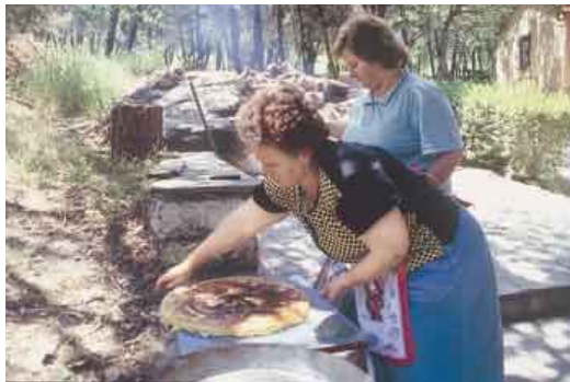
Μέλη του γυναικείου συνεταιρισμού της Δαδιάς. Στον χώρο του συνεταιρισμού λειτουργεί αναψυκτήριο - εστιατόριο με τοπικά προϊόντα και λιχουδιές.