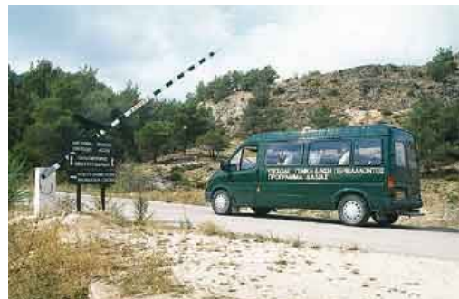
Το μικρό λεωφορείο της δημοτικής επιχείρησης Δαδιάς που χρησιμοποιείται για τη μεταφορά των επισκεπτών στο παρατηρητήριο αρπακτικών πουλιών. Στο μικρό αντίτιμο του εισιτηρίου συμπεριλαμβάνονται συνοδεία ξεναγού, κυάλια, τηλεσκόπιο και ξενάγηση.

Εδώ η κατάσταση είναι σαφώς καλύτερη από άλλα ανάλογα μέρη στην Ελλάδα. Παρότι το Οικοτουριστικό Κέντρο κατακλύζεται τις περισσότερες μέρες από εκατοντάδες επισκέπτες, τα πάντα κυλάνε ομαλά λόγω της καλής οργάνωσης. Σημείο αναφοράς αποτελεί το Κέντρο Ενημέρωσης. Ολοι οι επισκέπτες περνάνε υποχρεωτικά από εκεί. Η ξεναγός αναλαμβάνει την ενημέρωση -κυρίως για τους επισκέπτες που δεν είχαν την προνοητικότητα να γνωστοποιήσουν εγκαίρως την επισκεψή τους στην περιοχή- και διερευνά ανάλογα με τον χρόνο που διαθέτουν πώς θα μπορούσαν να επωφεληθούν καλύτερα. Μέρος των πληροφοριών παρέχεται μέσω των λεπτομερειακών ενημερωτικών πινακίδων της έκθεσης που λειτουργεί στο Κέντρο Ενημέρωσης, καθώς και της ταινίας που προβάλλεται με θέμα τη λειτουργία των δασικών οικοσυστημάτων και τη ζωή των