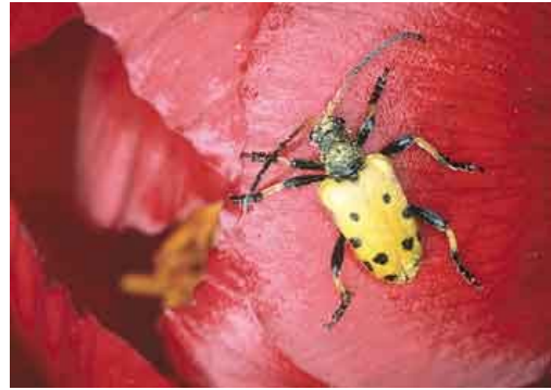
Μαυροκίτρινες πινελιές πάνω σε κόκκινο φόντο, όταν ο δρόμος του σκαθαριού περνάει πάνω από το άνθος παιωνίας.

Από την Αλεξανδρούπολη η Δαδιά απέχει 67 χλμ., περίπου 40 λεπτά. Πινακίδες σε εμφανείς θέσεις κατευθύνουν τον επισκέπτη αρχικώς προς το χωριό Δαδιά και στη συνέχεια προς το Οικοτουριστικό Κέντρο. Το τελευταίο απέχει 500 μ. από τον οικισμό της Δαδιάς και βρίσκεται σε ειδική θέση στις παρυφές του δάσους, ακριβώς στα όρια του πυρήνα προστασίας των αρπακτικών πουλιών. Περιλαμβάνει ξενώνα 20 δωματίων με δυναμικότητα 60 κλινών, κέντρο ενημέρωσης, μικρό συνεδριακό κέντρο, αναψυκτήριο-εστιατόριο (για πρόχειρο φαγητό), καθώς και εκθετήριο πώλησης τοπικών προϊόντων.