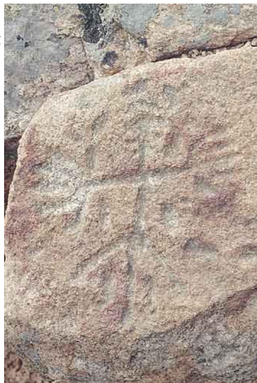
Λεπτομέρεια από τις πετρογραφίες στο Δέρειο που χρονολογούνται στον 11ο ή 10ο αι. π.Χ. και αποτελούν τα παλαιότερα ίχνη ανθρώπινης παρουσίας στη Δαδιά. αναπαριστούν διάφορες μορφές, πιθανόν ανθρώπους, αλλά και φίδια ή πουλιά.

Με τη σειρά τους οι Σαρακατσάνοι άφησαν ανεξίτηλα τα σημάδια της παρουσίας τους στον τόπο, καθώς τα κοπάδια τους, βοσκώντας συστηματικά τις ίδιες περιοχές, διαμόρφωσαν τη βλάστηση και το τοπίο. Σήμερα πια οι λίγες οικογένειες που απομένουν στην περιοχή έχουν εγκατασταθεί μόνιμα στα χωριά και πολλοί δεν ασχολούνται με την κτηνοτροφία.