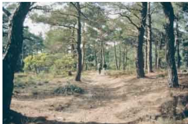
Πεζοπορία στα μονοπάτια της Δαδιάς.