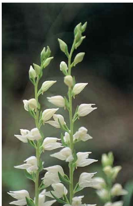
Η Cephalanthera epipactoides είναι ασιατικό ορχεοειδές με δυτικότερο όριο εξάπλωσής του στην Ευρώπη την περιοχή της Δαδιάς.

μπαινοβγαίνουν συνέχεια στις πυκνότητες και πολλά άλλα μικρόπουλα παραμένουν αθέατα, δηλώνοντας την παρουσία τους με το ασταμάτητο κελάδημά τους. Σε τέτοια σημεία φωλιάζουν και οι παρδαλοκεφαλάδες, ένα σπάνιο για την Ευρώπη είδος που μεταναστεύει για αναπαραγωγή στην ανατολική Ελλάδα, κυρίως στη Θράκη.