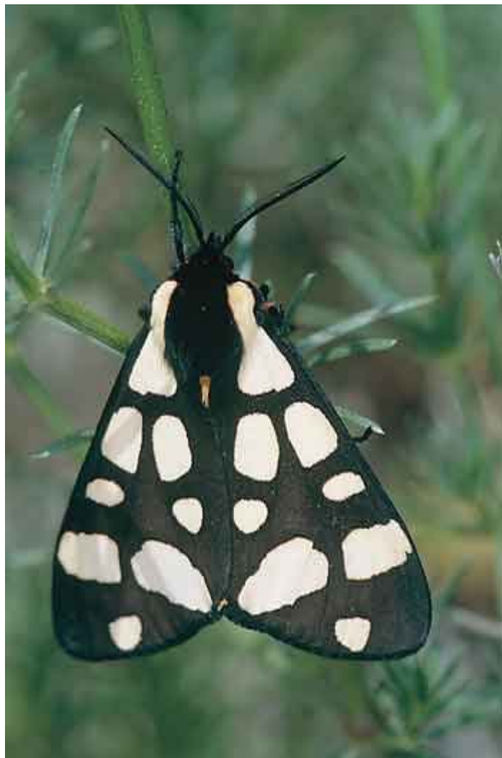
Νυχτοπεταλούδα της οικογένειας arctiidae. Τα είδη αυτής της οικογένειας πετούν και την ημέρα και όταν κάθονται κρατούν τα φτερά τους οριζόντια ώστε να καλύπτουν το σώμα τους, σχηματίζοντας ένα τρίγωνο με κορυφή το κεφάλι τους.

Στα δάση ζουν αλεπούδες, αγριόγατες, νυφίτσες, σκίουροι, τέσσερα είδη κουναβιών και πολλά τρωκτικά, ανάμεσα τους και οι σπάνιοι αρουραίοι της Μεσογείου που φωλιάζουν σε αποικίες σε λιγоста σημεία γύρω από την Πεσσάνη και τους Κατραντζήδες, σε ανοίγματα του δάσους. Στην ευρύτερη περιοχή έχουν καταγραφεί συνολικά 48 είδη θηλαστικών, ανάμεσά τους και 17 είδη νυχτερίδων που ζουν και αναπαράγονται σε σχισμές δένδρων και βράχων, σε μικρά σπήλαια και εγκαταλελειμμένες στοές ορυχείων.