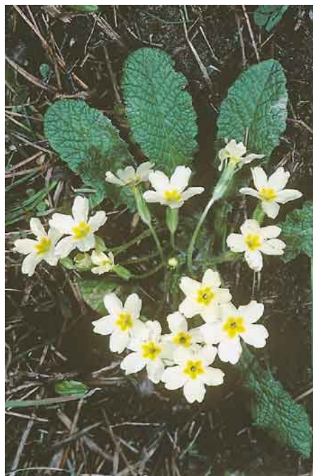
Primula vulgaris . Παρά το όνομά της, η Primula vulgaris μόνο «κοινή» δεν είναι. Πρόκειται για ένα από τα ωραιότερα είδη του γένους της, με λαμπερό κίτρινο χρώμα και μεθυστικό άρωμα.

Σε ανοιχτά σημεία με αραιούς θάμνους και αγκάθια φωλιάζει και ο αμμοπετρόκλης, ένα άλλο μεταναστευτικό πουλί που φτάνει στη Θράκη το δυτικότερο όριο της ζώνης εξάπλωσής του. Ο αναπαραγόμενος πληθυσμός υπολογίζεται σε 50 περίπου ζευγάρια. Μέχρι πρόσφατα σε ανοιχτά σημεία, σε ξερικά χορτολίβαδα και στα όρια καλλιεργημένων χωραφιών, ιδιαίτερα στην περιοχή της Λίρας, υπήρχαν αρκετές μικρές αποικίες λαγόγυρων. Τα χαριτωμένα αυτά τρωκτικά συναντώνται σε δύο μόνο περιοχές στην Ελλάδα, στην ευρύτερη κοιλάδα του ποταμού Αξιού και την κοιλάδα του Εβρου. Αποτελούν πολύ σημαντική λεία για τις αετογερακίνες, τους βασιλαετούς, τις γερακίνες και σε μικρότερο βαθμό για άλλα αρπακτικά, δυστυχώς όμως την τελευταία δεκαετία οι αριθμοί τους έχουν μειωθεί δραματικά, καθώς η εντατικοποίηση και η επέκταση των καλλιεργειών καταστρέφει τους βιότοπούς τους.