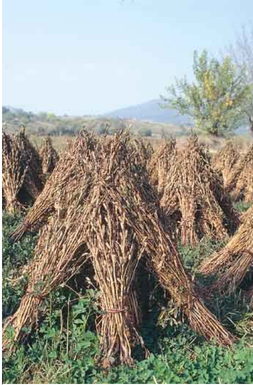
Καλλιέργειες σουσαμιού. Στα χαμηλά υψόμετρα και κυρίως γύρω από τα χωριά, η γη καλλιεργείται παντού. απέραντα χωράφια με καλαμπόκια, σιτηρά και ηλιοτρόπια φθάνουν μέχρι τα ριζά των λόφων.