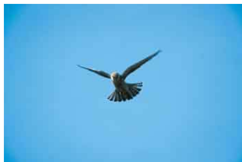
Μαυροκιρκινέζι εν πτήσει πάνω από το πυκνό δάσος.

Κατ' αρχήν οφείλεται στη σύνθεση, τη δυναμικότητα και την πλούσια βιοποικιλότητα του οικοσυστήματος. Το δασικό σύμπλεγμα της Δαδιάς είναι, ουσιαστικά, το μόνο πευκοδάσος σε ολόκληρη τη Θράκη. Καταλαμβάνει τις Ν.Α. υπώρειες του ορεινού όγκου της Ροδόπης (που κι αυτή αποτελεί ένα πολύ αξιόλογο οικοσύστημα), και παρά το ότι εκτείνεται σε χαμηλό υψόμετρο, εμφανίζει έντονο ανάγλυφο, με τη μορφή αλληλοδιαδεχόμενων λόφων που διατρέχονται από μικρά ποτάμια και ρέματα. Χαρακτηριστικό των λόφων αυτών, στο κεντρικό ιδίως τμήμα του δάσους είναι οι βραχώδεις απολήξεις, τα πολλά ανοίγματα και φυσικά ξέφωτα και η άμεση γειτνίαση με ημιπεδινές εκτάσεις, χερσόλιβαδα και μικροκαλλιέργειες. Ολο αυτό το σύμπλεγμα μικροβιοτόπων και οικοτόπων φιλοξενεί και στηρίζει αμέτρητα ενδιαίτηματα για τη χλωρίδα και την πανίδα, σε μια θαυμαστή αλληλεξάρτηση. Με τη σειρά τους πολλά από αυτά τα είδη πανίδας (έντομα, ερπετά - αμφίβια, μικροθηλαστικά), αποτελούν βασική ή συμπληρωματική τροφή για πολλά αρπακτικά πουλιά. Δεν είναι, λοιπόν, τυχαίο ότι το τμήμα αυτό του Ν. Εβρου αποτελεί, πιθανότατα, τη σημαντικότερη περιοχή της Ευρώπης σε ερπετά και αμφίβια, με 40 διαφορετικά είδη.