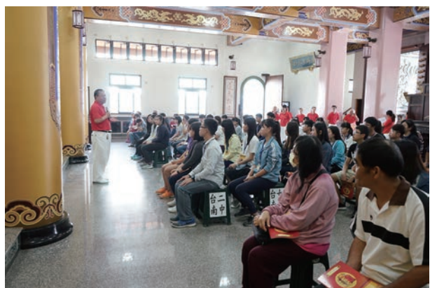
頒獎典禮特於本廟人間道場舉行