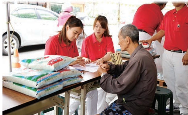
發放每戶啓緣金壹仟元、五公斤白米一包