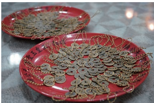
「五行串雙古錢」助財運亨通