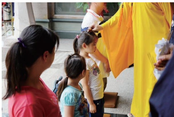
感恩 主公慈悲壓煞賜福