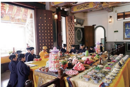
丙申年一詠日祝壽科儀