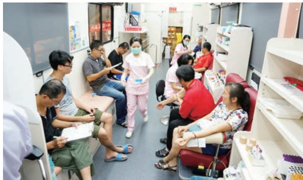
感謝大家踴躍捐出熱血助人