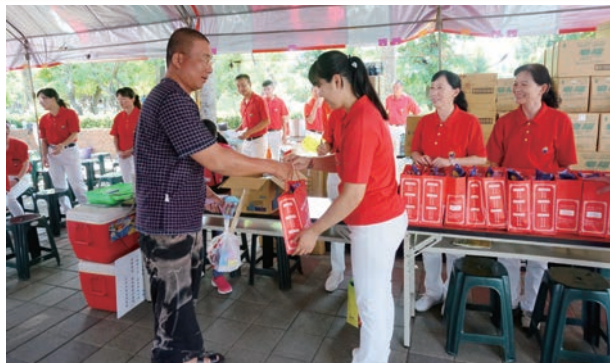
感謝～天公祖保庇你平安