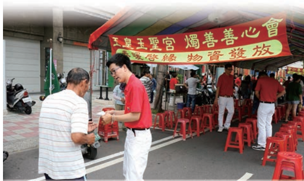
奉獻生在入口迎接感恩戶到來