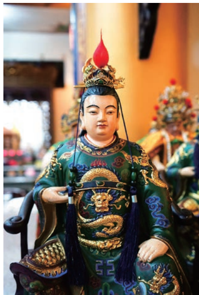
玉皇四太子殿下分靈金尊