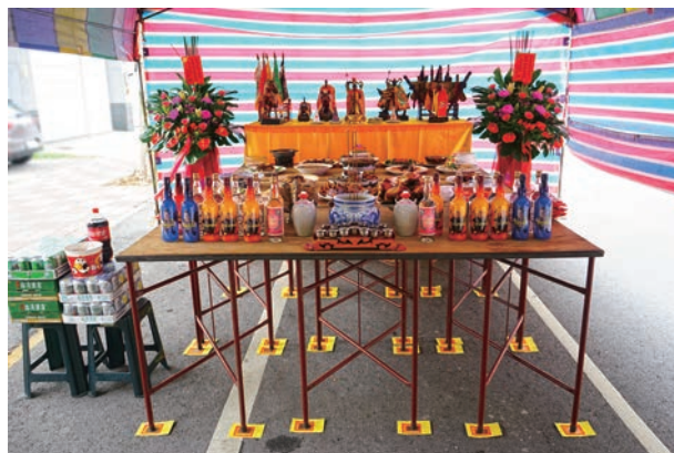
感謝五營神將一年來的護佑