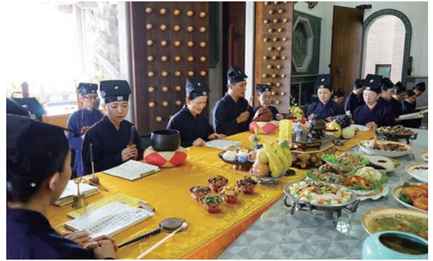
本廟誦經團茹素齋戒、焚香禮懺舉行「一詠日」祝禱祈安科儀