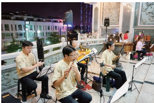
玉鳴聖樂恭祝聖壽千秋