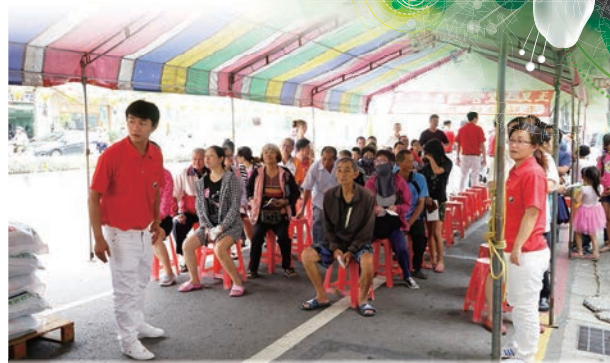
大家有秩序的排隊靜待叫號