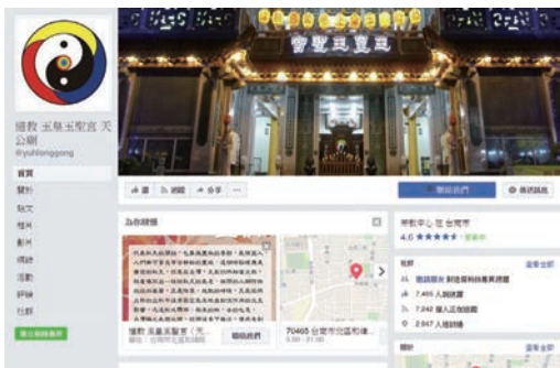
歡迎上本廟FB官方粉絲團按讚