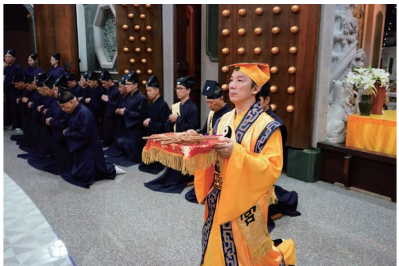
住持方丈率眾舉行謝恩祝壽大典