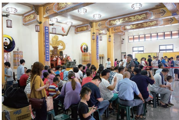
信眾在人間道場排隊等候過陣