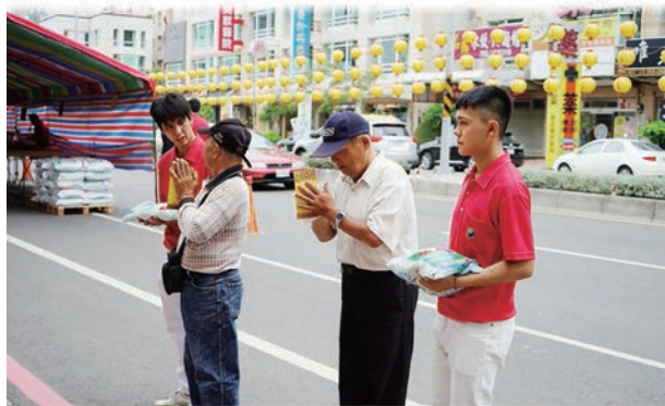
感恩戶向 聖尊行禮表達謝意