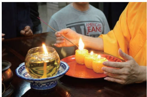
延壽平安燈點燈科儀