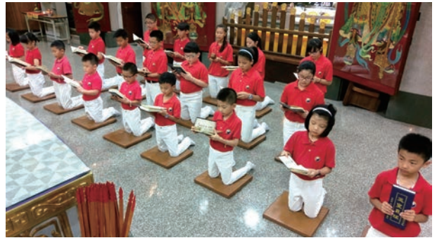
學修堂眾學子恭誦仁正聖經，齊心恭祝聖壽千秋