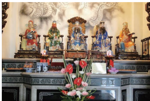
本廟 五文昌帝君聖像