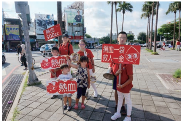
小奉獻生們也賣力宣傳捐血活動