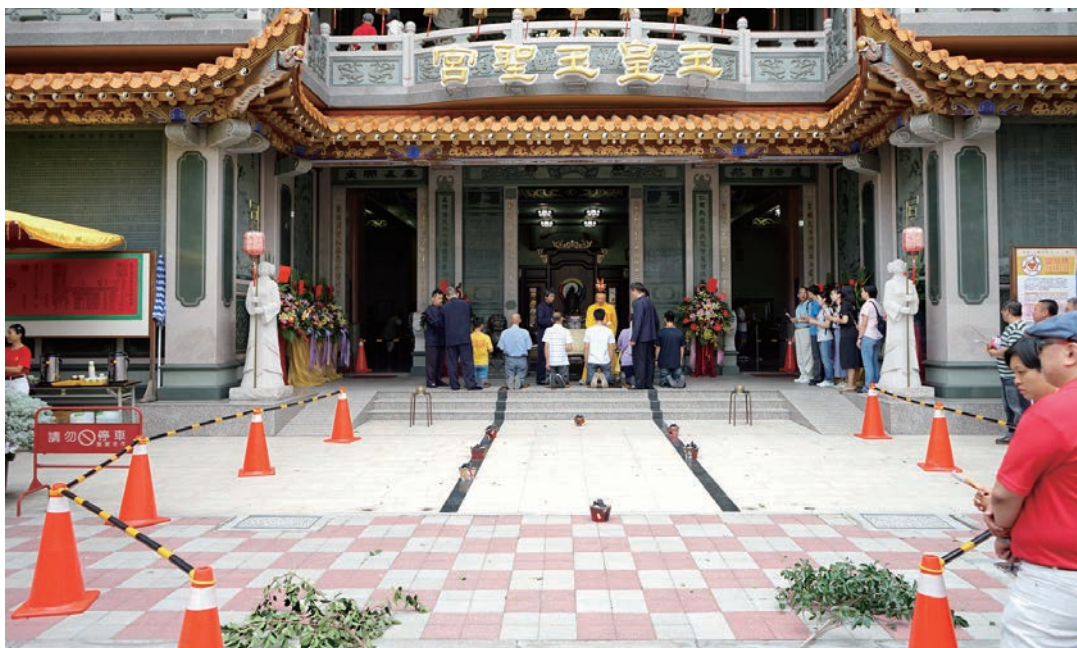
過雙龍七星九皇陣 壓煞 解厄 驅邪