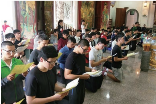
團拜文昌助考運順遂