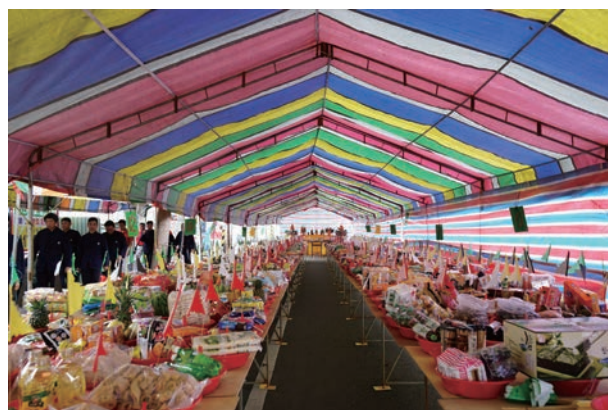
虔誠供品犒賞 五營神將聖恩