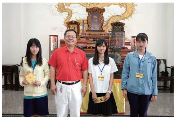
高永清理事長親自為學子們加油鼓勵