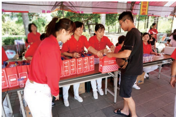
本會準備精美禮袋答謝捐血人