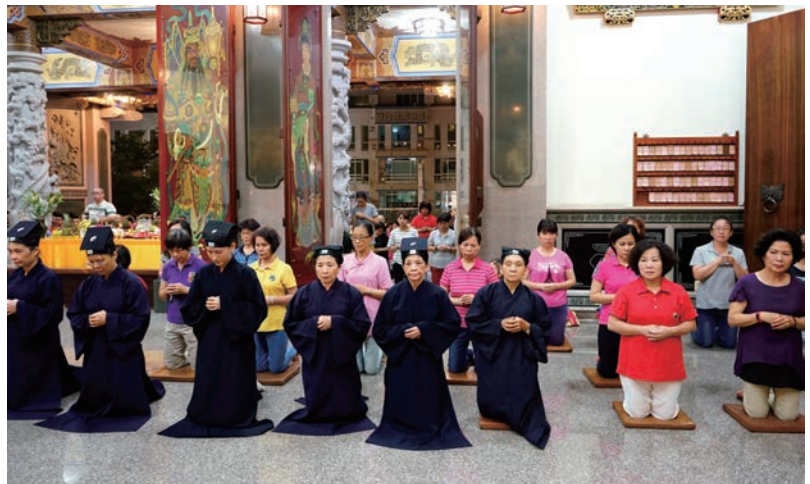
信眾虔誠恭祝聖壽千秋