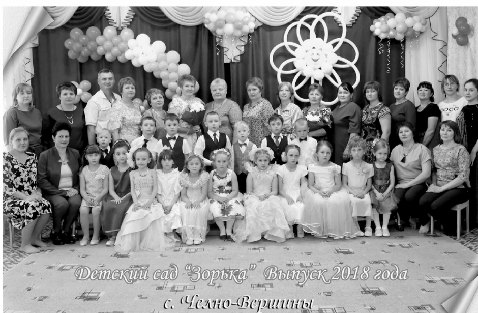
Детский сад «Зорька» Выпуск 2018 года с. Челно-Вершины