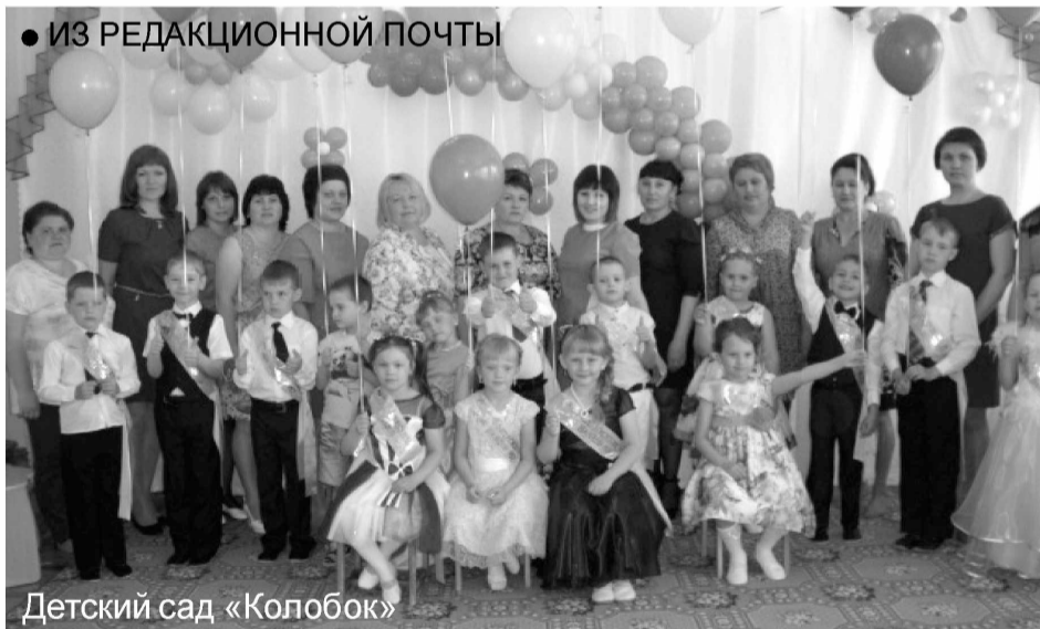
Детский сад «Колобок»