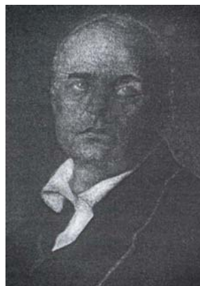
Лаза Поповић 1904. и 1918. године