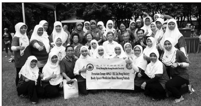
▲ 為慶祝印尼國慶，8月23日印尼學員在維園組織公開活動。