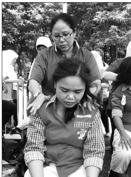
▲ 按摩者的雙手按在患者身上，卻有一股暖流注入了她們的全身。