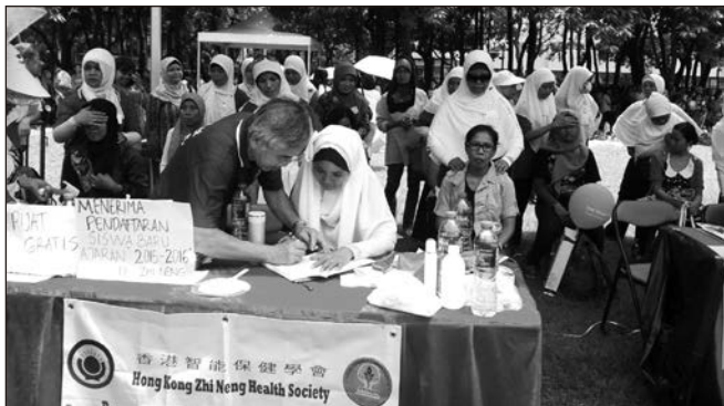
◀ 會場接待處掛有香港智能學會的橫幅，為能讓更多人認識本會。