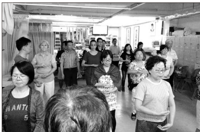
▲ 這次動意功班人丁興旺，而且學員質素不錯，還出現過兩位外籍人士。