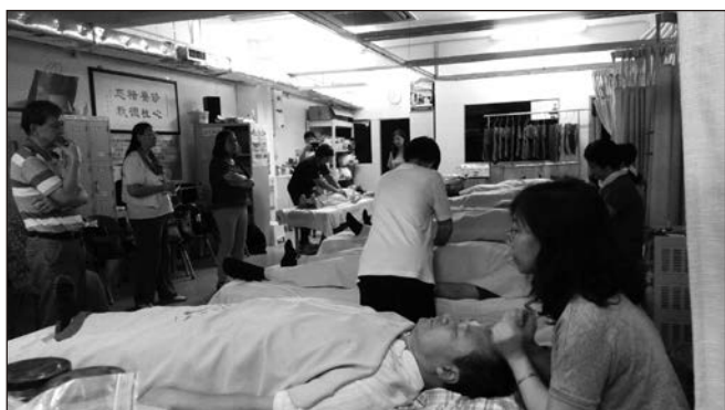
▲ 本會最近一期按摩班學員接受導師的考核。