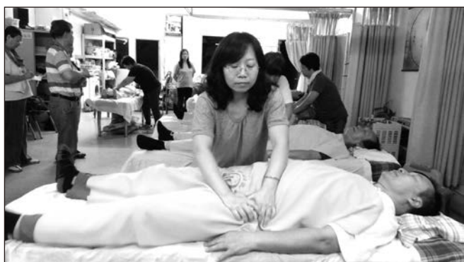
▲ 本會最近一期按摩班學員進行技能考核的情形。