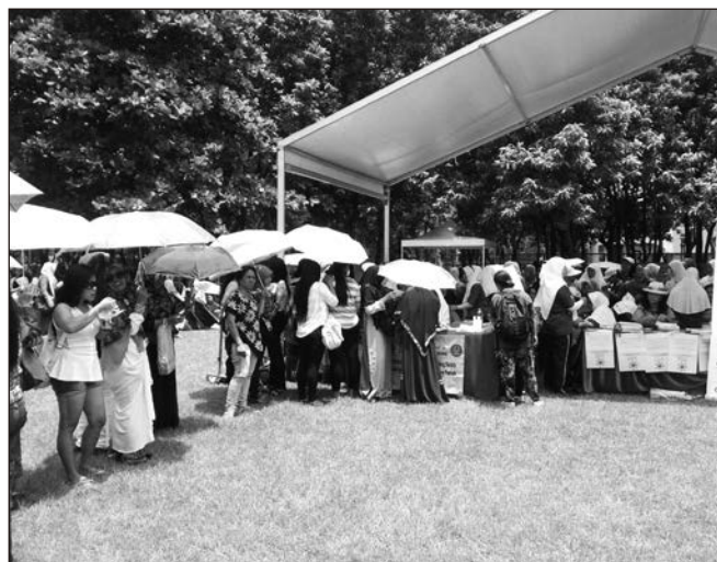
▲ 雖然天氣炎熱，依然可見絡繹不絕的人龍。