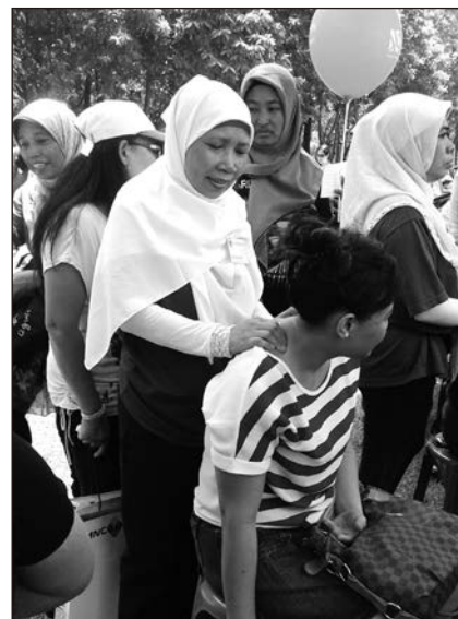
▲ 印尼學員用學到的技能為她們的同胞舒緩病痛。