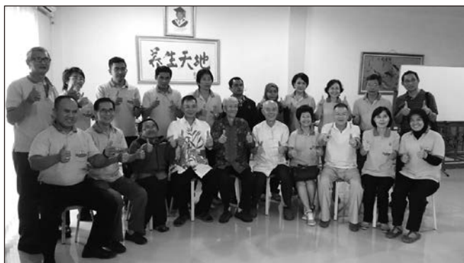
▲ 印尼空間保健中心全體工作人員同本會前朱會長等合影