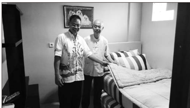
▲ 印尼空間保健中心設置病房以更貼心地為有需要的病人服務