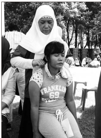
▲ 印尼傭工為解除身上的病痛慕名而來。