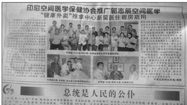
▲ 印尼華文報紙有報導印尼空間保健中心推廣空間醫學的進展情況