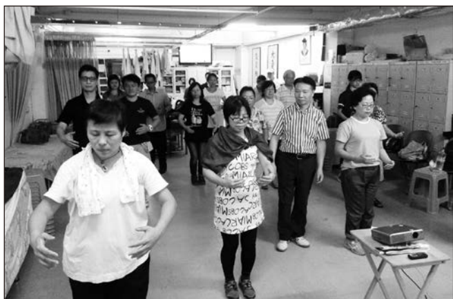
▲ 最近一次動意動班上課一景。