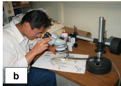
Figura 2. a) Plántulas de Otatea acuminata . b) Identificando material del herbario