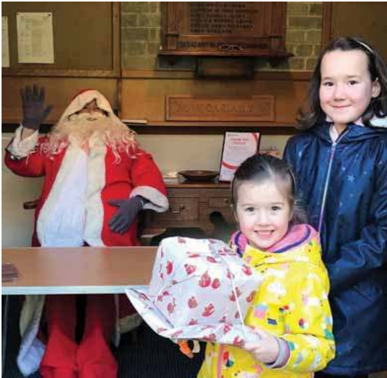
Dau o'r plant, Cadi a Ffion, wedi cyrraedd Emaus yn gynnar i groesawu Siôn Corn

SIÔN CORN YN CADW AT EI ADDEWID Caewyd Lôn Cariadon ddiwrnod cyn i Siôn Corn ddod i Emaus! Trwy drugaredd llwyddodd i oresgyn y broblem a chyrrhaeddodd y capel mewn pryd. Diolch yn fawr, Siôn Corn!