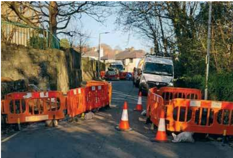
Lôn Cariadon ar gau