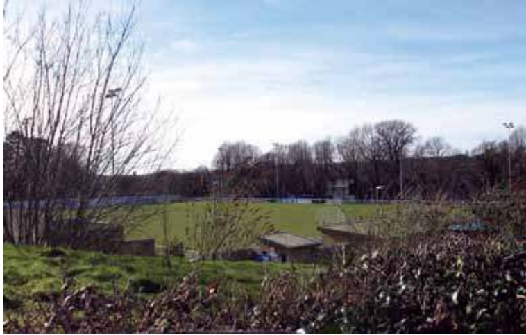
Tawelwch wedi taro Nantporth

Be' sy'n digwydd yn Nantporth ydi'r cwestiwn y mae llawer yn ei ofyn. A fydd unrhyw chwarae yno eto? Erbyn i hyn ymddangos efallai y bydd rhywbeth wedi datblygu. Serch hynny, er i'r perchnogion presennol addo y byddai pawb yn cael gwybod beth oedd yn digwydd ar ôl iddyn nhw gael eu hatal dros dro o gynghrair JD Cymru North ni chafwyd unrhyw wybodaeth cyn dechrau'r flwyddyn.