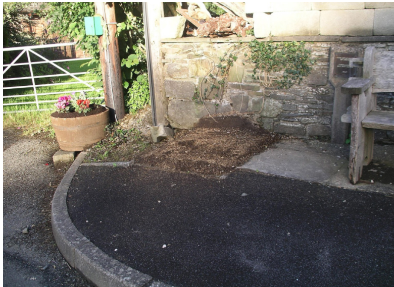
Safle'r ciosg ffôn.