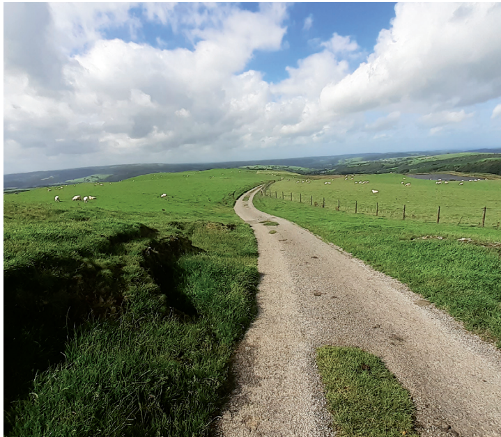
Yr olygfa dros fanc AlltFedw ger Carreg Gwelmiangel.

Erbyn hyn rown i o fewn cyrraedd i Garreg Gwelmiangel