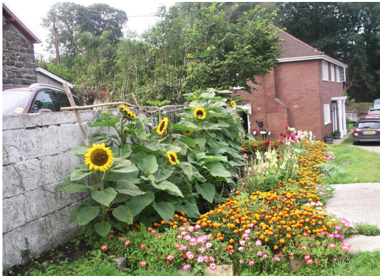
Gardd yr ysgol.