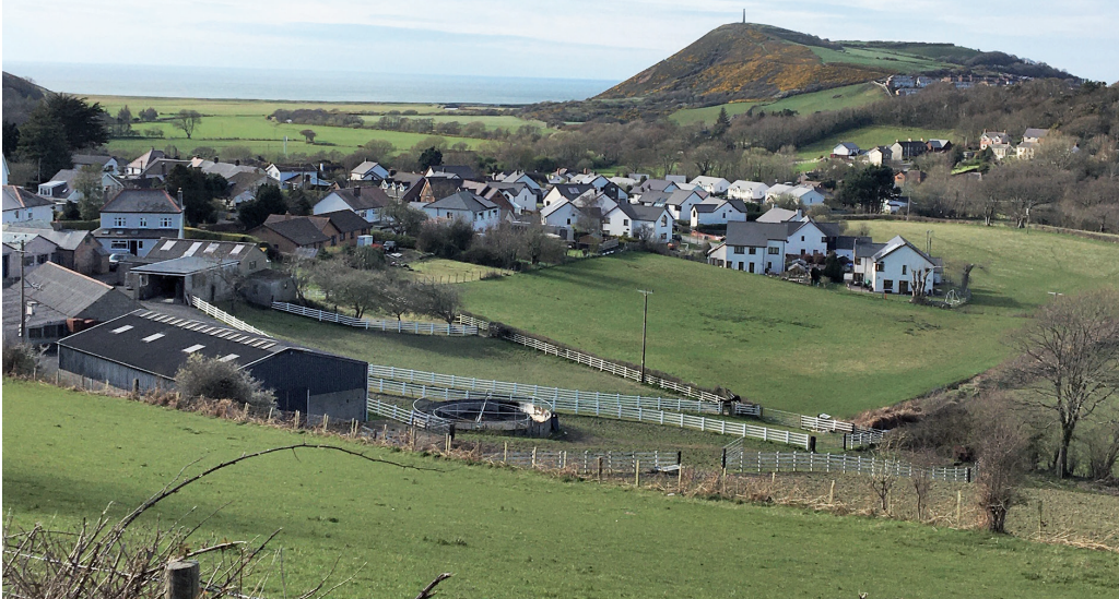
Rhydyfelin 'rhwng dau fryn'.