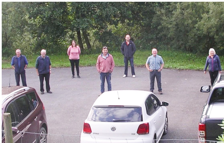
Cyfarfod y Cyngor Cymuned.