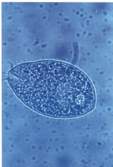
▲ Balantidium spp.

Gallotia stehlini es un lagarto endémico de la Isla de Gran Canaria. El género Gallotia presenta distintas especies y subespecies en las Islas Canarias, diferenciándose unas de otras por características morfológicas, bioquímicas y genéticas (4, 15). Estos lacértidos endémicos de las Islas Canarias han sido objeto de variados estudios científicos