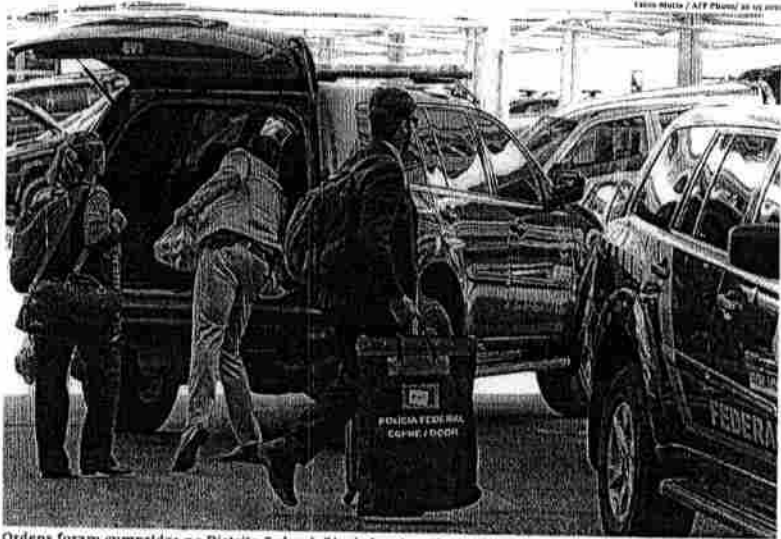
Ordens foram cumpridas no Distrito Federal, Rio de Janeiro, São Paulo, Mato Grosso, Paraná e Santa Catarina.

ALEX RODRIGUES E FELIPE PONTES Agência Brasil, Brasília A Polícia Federal cumpriu ontem 29 mandados de busca e apreensão no chamado inquérito das fake news, aberto no ano passado. As diligências ocorrem em endereços ligados a 17 pessoas. Os mandados foram autorizados pelo ministro Alexandre de Moraes, relator do inquérito no STF, e têm por objetivo apurar a existência de esquemas de financiamento e divulgação em massa nas redes sociais de notícias falsas contra autoridades da República. A ordem foi cumprida no Distrito Federal, Rio de Janeiro, São Paulo, Mato Grosso, Paraná e Santa Catarina. Na decisão em que autorizou as buscas, Moraes disse haver indícios de que um grupo de empresários tem financiado e coordenado uma estrutura para a produção e disseminação dessas informações falsas e ofensas nas redes sociais. As irregularidades seriam em grupos privados de WhatsApp, motivo pelo qual teria sido necessária a apreensão de diversos aparelhos eletrônicos para a produção de provas, decidiu o ministro. Moras cita laudos periciais da PF que apontam a coordenação de postagens em rede através de perfis no Twitter. O ministro menciona ainda os depósitos de diversos parlamentares, entre eles deputados Alexandre Frias (PSDB-SP) e Joyce Hasselmann (PSI-SP), que acusaram a existência do esquema em depoimento na Comissão Parlamentar Mista de Inquérito (CPMI) sobre fake news. “As provas colhidas e os laudos periciais apresentados