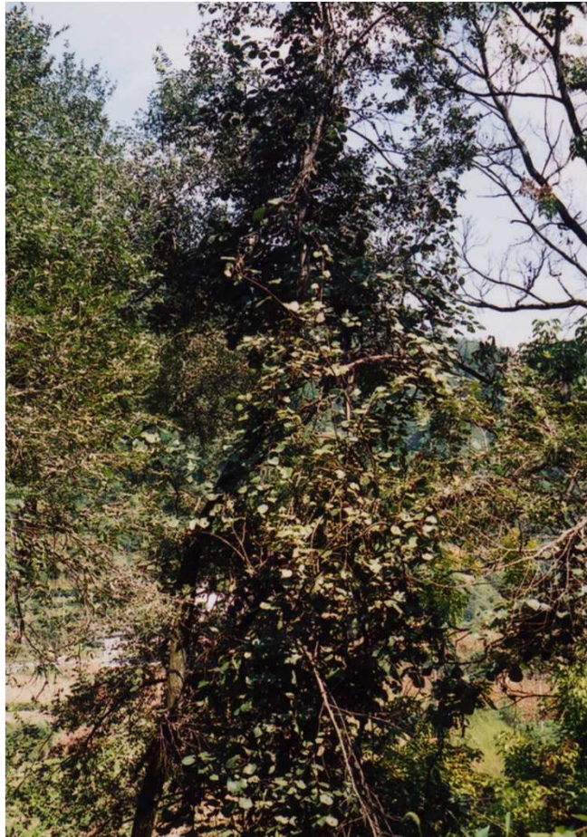
樹木にからんで伸びる A.deliciosa 種 キウイフルーツの野生樹 中国湖北省にて撮影2003年

■中国の多数の自生種のうち、2種 ( A.deliciosa ※と A.chinensis )がキウイフルーツとして栽培・流通しています。 ※現在、 A.chinensis var. deliciosa との分類がなされています。