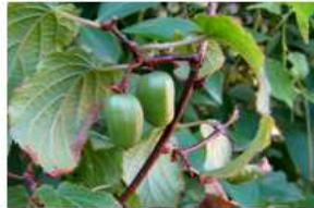
A. kolomikta ミヤママタタビ

■日本国内には、以下の3種と1変種が自生しています。ミヤママタタビは、北海道から本州中北部の高冷地、サルナシ、マタタビは全国の山間地、ウラジロマタタビは、房総半島以西の太平洋岸、瀬戸内海周辺、九州、屋久島にかけて自生しています。シマサルナシは、紀伊半島東部以西の太平洋岸から九州、沖縄・南西諸島の温暖地に分布しています。