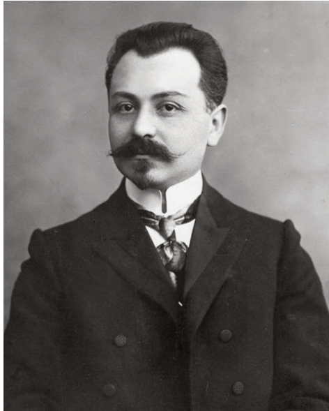
Fətəli xan Xoyski Birinci Heyəti-Vükəla rəisi