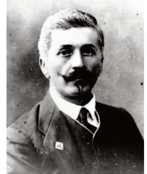
Həsən bəy Ağayev Azərbaycan Məclisi-Məbusan Rəyasəti Baş müavini

eşq ilə hürriyyətin arasında öylə böyük-böyük uçurumlar, mümaniətlər [manea-lər] mövcuddur ki, buralardan millət karvanını təhlükəsiz bir üsulla keçirmək üçün hürriyyətpərvər şüəramızdan böyük zəka və məharətlər tələb olunur. İndi baxalım ki, şüəramız bizi bu uçurumlardan nə kimi vasitələrlə xilas etmişlər.