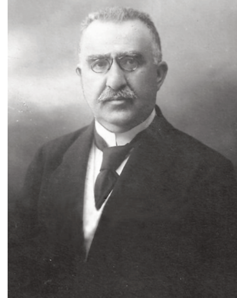
Əlimərdan bəy Topçubaşov Sülh konferansında Azərbaycan Heyəti-Mürəxxəsesi rəisi

Lakin eşq və sevdadan bilavasitə hürriyyət və istiqlala ərişmək mühal və mümtənidir [mümkünsüz və çətindir]. Zira