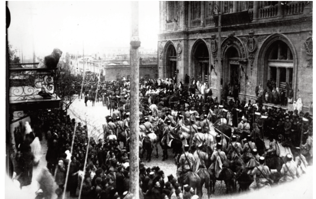
İlk dəfə Azərbaycan ordusu qitəatının paytaxtımıza vürudu

O, ömründə bir çox patıltılar, gurultular keçirərək, qəvi [məhkəm] heykəltəni, daima nərəkəşan [nərə çəkən] olduğu bir surətdə, içərisində olan odlular daşları havaya sovurmuş və bir vaxt ətrafını qara çamurlar ilə əhatə edərək, yaşıl sünbülləri, o mayeyi-həyatı-bəşəriyyəni kəndi qara qəlbindən çıxarmış olduğu hisli-paslı və zəhrəlüd [zəhərli] nəfəsiylə müləvvəs etmişdi [çirkəndirmişdi]. Bir zaman dəxi böyük bir nəre ilə ətrafı məhabətli [qorxulu] və olduqca dəhşətli bir gurultuya qərq edib, içərisindən havaya qalxan odlular, hərərətli