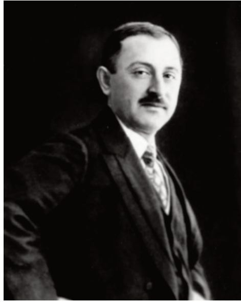
Yusifbəyli Nəsim bəy Azərbaycan Cümhuriyyəti Heyəti-Vükəla rəisi