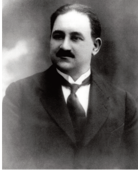
İlk Azərbaycan Şurayı-Millisi rəisi və “Müsavat” firqəsi Mərkəz Komitəsi sədri Rəsulzadə Məhəmməd Əmin

Bu gün istiqlal səneyi-dövriyyəsi olmaq münasibətilə Heyəti-Vükəla rəisi və nazirlər bizzat gündüz saat 1-dən 4-ə qədər qəbuli-təbrikat edəcəkdir.