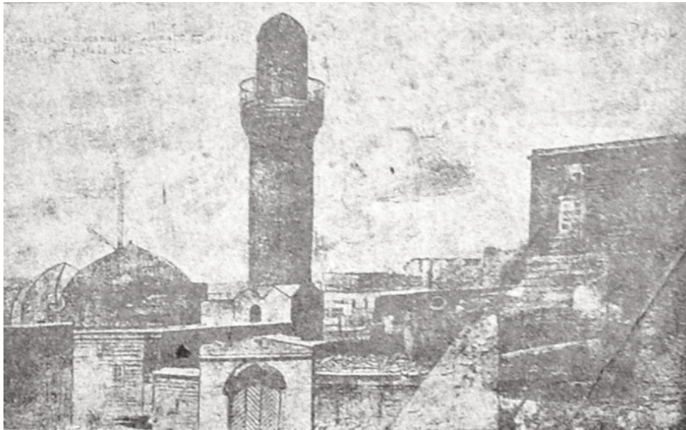
Bakıda qədim Xan sarayı