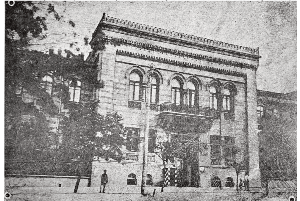
Azərbaycan Məclisi-Məbusan binasının zahiri görünüşü

Bu gün istiqlalımızın səneyi-dövriyyə-sidir [ildönümüdür]. Keçən sənə 28 Ma-yısdə etdiyimiz istiqlal elanından bu gün bir sənə keçir. O münasibətlə qiymətli Azərbaycanımızın hər tərəfində müəllə taqi-zəfərlərin [uca zəfər tağlarının], möh-təşəm binaların bəzənməsi görüldüyü