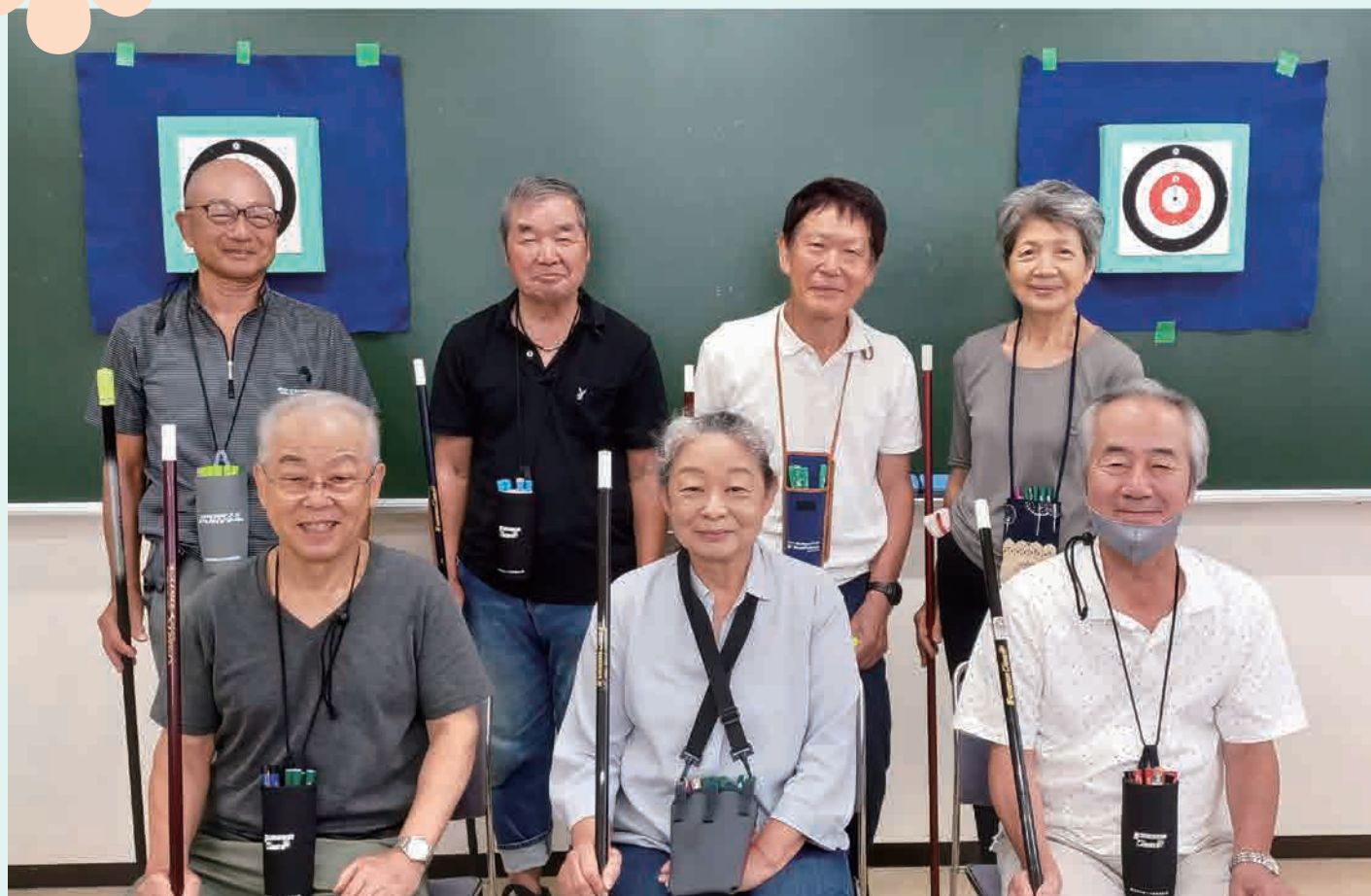
「梅田吹矢会」メンバーさんの集合写真です。 詳細は P2 をご覧ください。