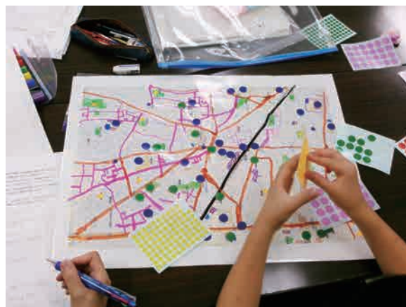
防災マップを作成している様子

受講した方からは、「今まで漠然と避難所に逃げればいいと考えていたけれど、住宅街の危険な場所や安全な通り道について考えたり、家族との連絡の取り方を考えたりすることができました。」とのお声をいただきました。