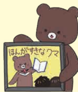
梅田図書館マスコットキャラクター

日程：10/12 (木)・10/26 (木) 時間：11:30～11:50 場所：2F じゅうたんコーナー 対象：0～3歳 内容：手遊びを交え、赤ちゃん向けの絵本の 読み聞かせをします。