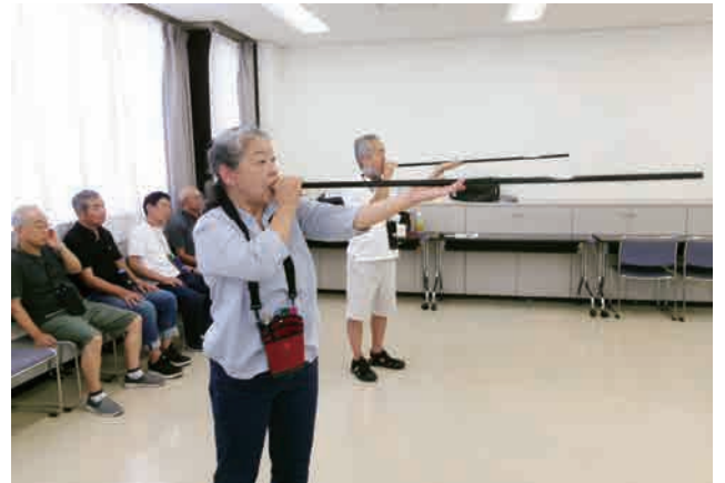
待機中はリラックスした雰囲気です