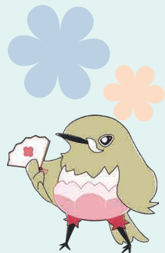
梅田地域学習センターマスコット キャラクター「ウメジロ」