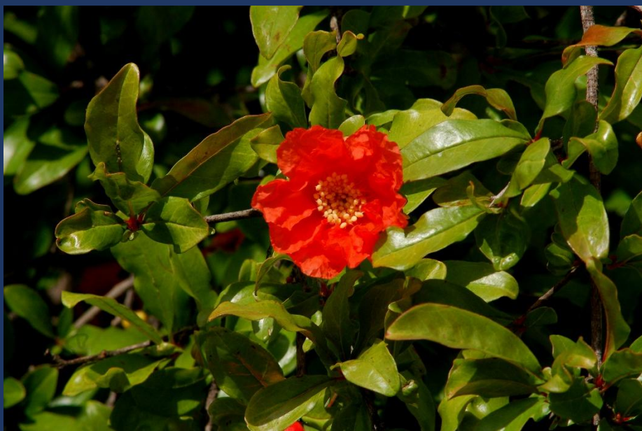
Hojas y flor

CURIOSIDADES Ejemplares de granados asilvestrado podemos encontrarlos en el lecho del barranco de la Carrasca (Enguera). Soporta adecuadamente el tratamiento para convertirlo en bonsái. Se puede consumir la granada como postre y para añadir a las ensaladas.