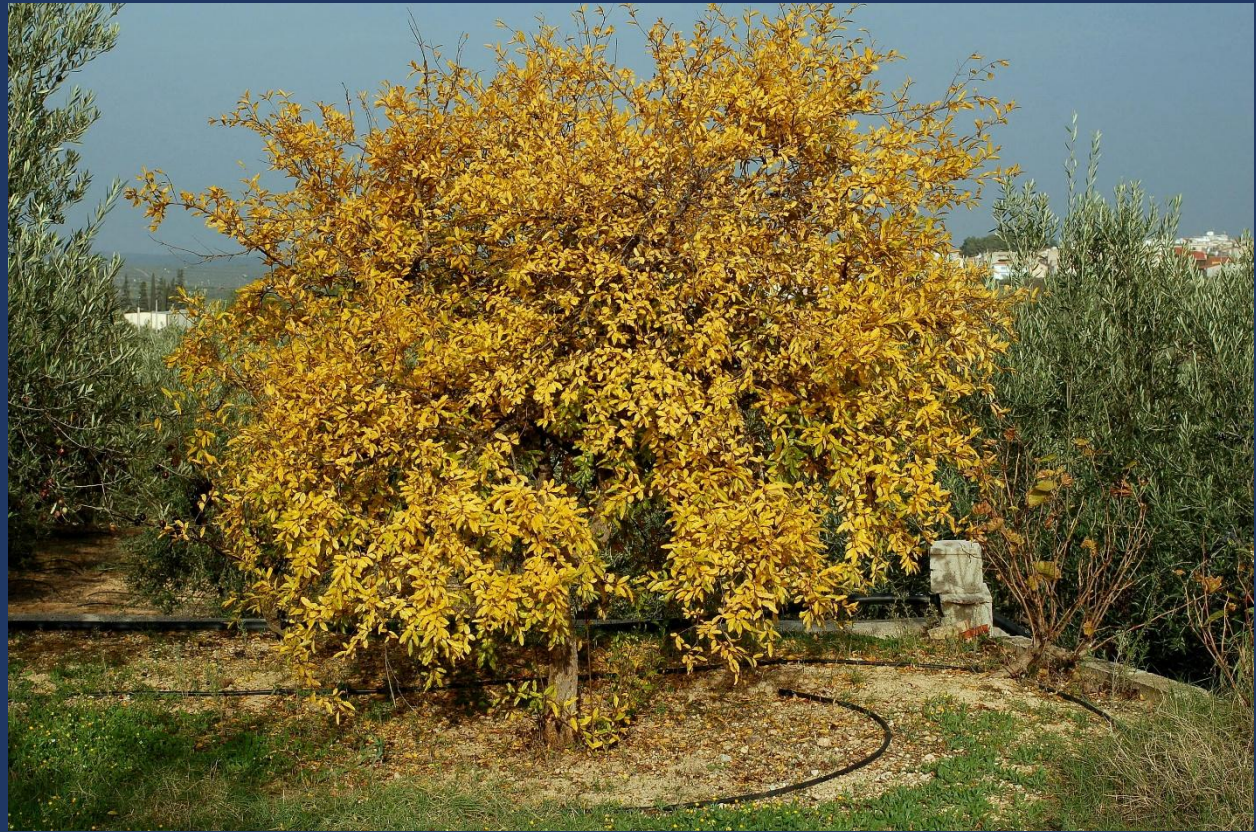
Árbol en otoño