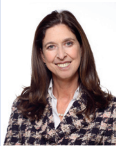
Lydia Mutsch – LSAP Bourgmestre

Ressorts: Développement urbain et expansion économique, finances, sécurité publique, intégration, relations internationales, coopération et tourisme, communication et relations avec le public.