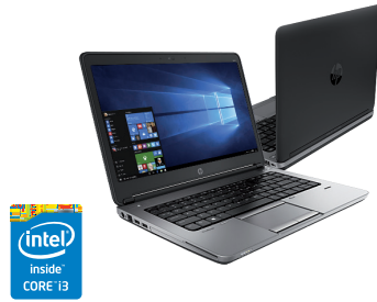
HP ProBook 640/650 (Ref.: H5G64EA / H5G74EA)

Rendimiento empresarial, sólido y fiable. Diseñado para tu negocio