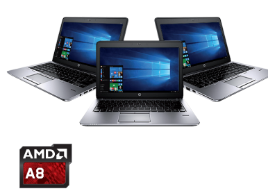
HP EliteBook 725/745/755 (Ref.: F1Q17EA / F1Q24EA / F1Q28EA)