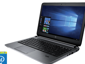
HP ProBook 430 (Ref.: K9K07EA)