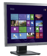
HP EliteDisplay E190i LED (Ref.: E4U30AA)