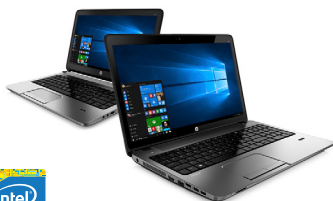
HP ProBook 430/450 (Ref.: K9J77EA / K9K29EA)

hp + Windows 10 Actualización gratuita a Windows 10