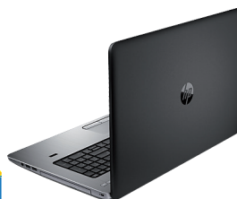
HP ProBook 470 (Ref.: K9J34EA)