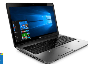
HP ProBook 450 (Ref.: K9K24EA)