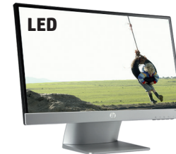
Pavilion 22xi (Ref.: C4D30AA)