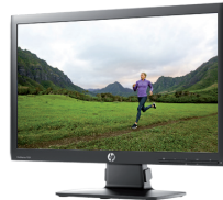
HP EliteDisplay E201 LED (Ref.: C9V73AA)