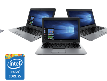
HP EliteBook 820/840/850 (Ref.: H9V81EA / H9V82EA / H9V83EA)

HP Care Pack 3 años de garantía con asistencia a domicilio al día siguiente EliteBook 700/800 (Ref.: U4414E) PVP 110€ Promoción 79€ HP Care Pack 3 años de garantía TRAVEL con asistencia al día siguiente EliteBook 700/800 (Ref.: U4418E) PVP 155€