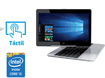
HP EliteBook Revolve 810 (Ref.: J8R97EA)