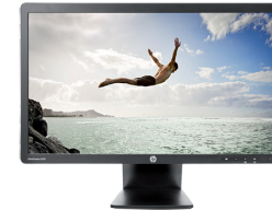
HP EliteDisplay E231 LED (Ref.: C9V75AA)