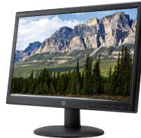
HP V201a (Ref.: F8C55AA)