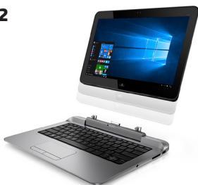
HP Pro x2 612 (Ref.: F1P90EA)

Formatos "2 en 1" 100% profesionales para una mayor exigencia de movilidad