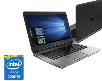
HP ProBook 640/650 (Ref.: F1Q65EA / F1P85EA)

HP Care Pack 3 años de garantía con asistencia a domicilio al día siguiente ProBook 600 (Ref.: U4391E) PVP 190€ Ver Promoción HP Care Pack 3 años de garantía TRAVEL con asistencia al día siguiente ProBook 600 (Ref.: UC909E) PVP 235€ Promoción 129€