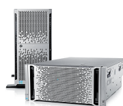
LIQUIDACIÓN DE EXISTENCIAS ProLiant ML350p Gen8 v2