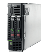
ProLiant BL460c Gen9