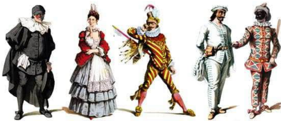
Convalidato dalla Commedia dell'Arte