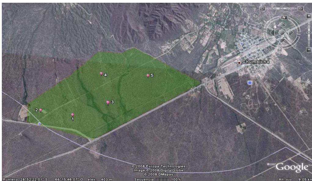
Figura Nº 1: Imagen Satelital del área de estudio señalando los puntos de observación (calicatas).

Tiene por objetivo describir las propiedades morfológicas, químicas y de fertilidad del suelo, con el fin de disponer de una herramienta para planificar el asentamiento de cultivos y sugerir las medidas de manejo más convenientes para el mejor aprovechamiento y conservación del recurso, de acuerdo a su capacidad de uso.