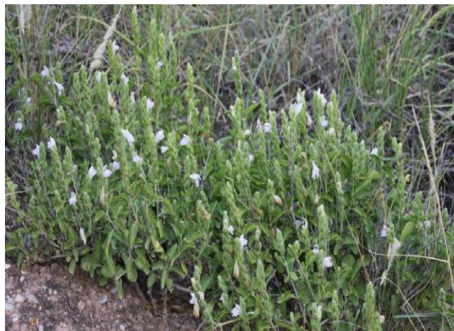
Figura Nº 1: Justicia gilliesii (Nees) Bentham. Ejemplar fotografiado en la localidad de El Quimilo, Distrito La Guardia, Departamento La Paz, Provincia de Catamarca.

Las estaquillas se colectaron en el mes de noviembre, de plantas previamente seleccionadas. Se cosecharon brotes juveniles del año, acondicionándolos para su transporte hacia el C.E.P.A., envueltos en