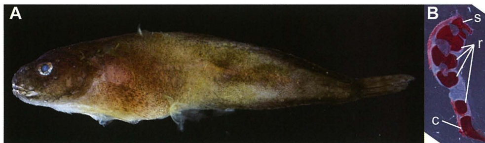
Fig. 1. Fresh condition of Liparis bikunin (FAKU 132515, 45.5 mm SL), collected from Iwate, northern Japan (A). Lateral view of right pectoral girdle (outer side) (B). s: scapula, r: proximal radials, c: coracoid.

備考 本標本は鼻孔が2対あること、擬鰓をもつこと、腹吸盤をもつこと、射出骨数が4で、そのうち上から3個については凹みがあること、胸鰭軟条数が臀鰭軟条数よりも多いことなどで、クサウオ属に該当する (Kido, 1988; Chernova, 2008)。さらに、後鼻孔が頭部側線孔よりも小さく目立たないこと、鰓孔下端が胸鰭第3-6軟条の高さに達すること、背鰭軟条数が32-35、臀鰭軟条数が25-28、胸鰭軟条数が31-35の範囲にあることで、アマクサウオ L. bikunin のホロタイプ (Fig. 2) およびパラタイプの特徴と一致した (Matsubara and Iwai, 1954; Kido, 1988; 本研究)。日本産の本属魚類では、本種とカンテンビクニン Liparis frenatus (Gilbert and Burke, 1912) は、鰓孔下端が胸鰭第3軟条よりも下に位置すること、背鰭軟条数が37以下、臀鰭軟条数が31以下であることで類似する (中坊・甲斐, 2013)。しかし、カンテンビクニンには、後鼻孔に突起がある (アマクサウオにはない) ことで明瞭に区別できる (中坊・甲斐, 2013; 本研究)。なお、Kido (1988) は、本種の肛門が腹吸盤後端よりも臀鰭起部に近いとしており、Chernova (2008) も本種の標本を観察しないままそれに従った。しかし、本研究で L. bikunin のホロタイプを確認したところ、腹吸盤から肛門までの距離 (3.3 mm) は臀鰭起部から肛門までの距離 (4.8 mm) よりも短いことがわかった。今回、新たに得られた標本でも、そのようになっており、肛門の位置も考慮に入れてクサウオ属内に亜属を設定した Chernova (2008) の分類は、再検討の余地がある。