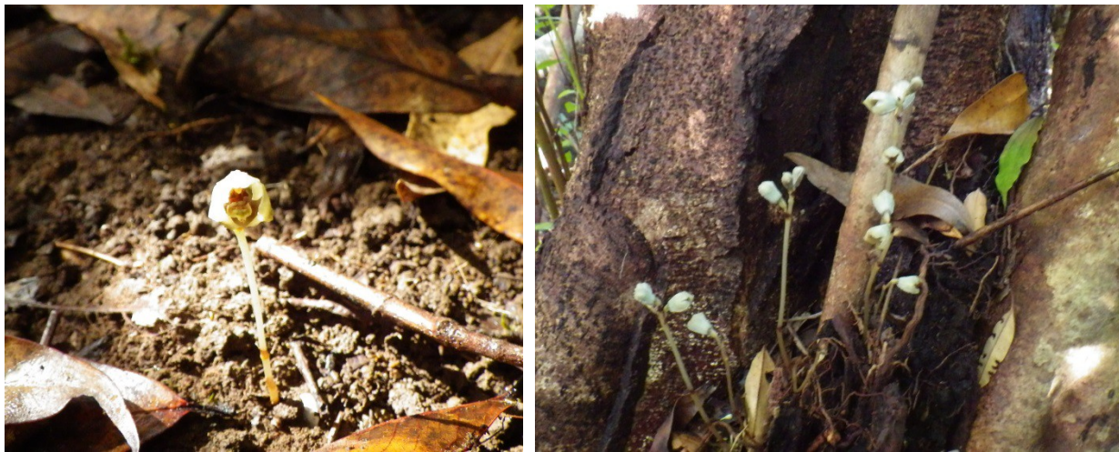
Figure 2. – Gastrodia similis Bosser dans sa variante claire, observée sur le site de Beaufonds à Sainte-Marie de La Réunion.

de TASSIN et al. (2006). Des opérations de gestion conservatoire dirigées peuvent permettre un retour progressif vers un habitat indigène stable, par la lutte et le contrôle des espèces exotiques envahissantes (TRIOLO, 2005), alors que la non intervention conduira inévitablement à la mise en place d'écosystèmes nouveaux et autonomes (HOBBS et al. , 2014). Afin de choisir la conduite à tenir, le suivi sur le long terme de ces habitats hybrides semble aujourd'hui plus important que jamais. La superposition des nombreux outils d'inventaires et de conservation disponibles sur l'île en 2016 permet dans certains cas d'anticiper les enjeux. Pour G. similis , comme pour les essences indigènes mentionnées plus haut, un effort de prospection conséquent doit être mené dans les forêts secondarisées du Nord et de l'Est de l'île, au-dessous de 600 mètres, afin d'identifier des zones prioritaires pour la conservation et la restauration écologique. Finalement, nous ajoutons que ces habitats forestiers dégradés doivent être impérativement pris en compte dans les expertises naturalistes réalisées en amont de toute intervention destructrice. In fine , les services de l'État en charge de l'instruction des dossiers d'étude d'impact sont alors garants et responsables de la juste valorisation de ces milieux hybrides.