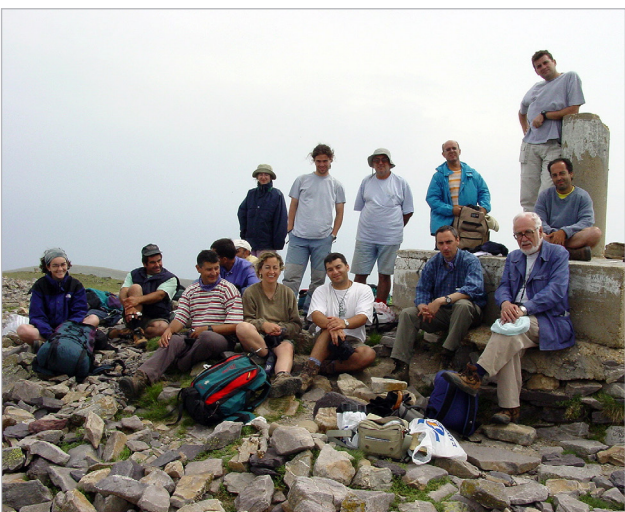
Moncayo, Zaragoza-Soria, año 2002.