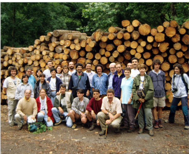
Alegria/Dulantzi, Álava, año 1998.