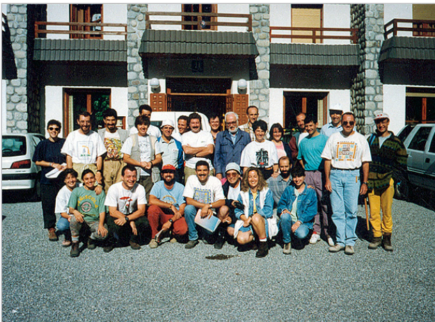
Pirineo central aragonés, Bielsa, año 1996.