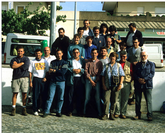
Mogadouro, Portugal, año 1997.