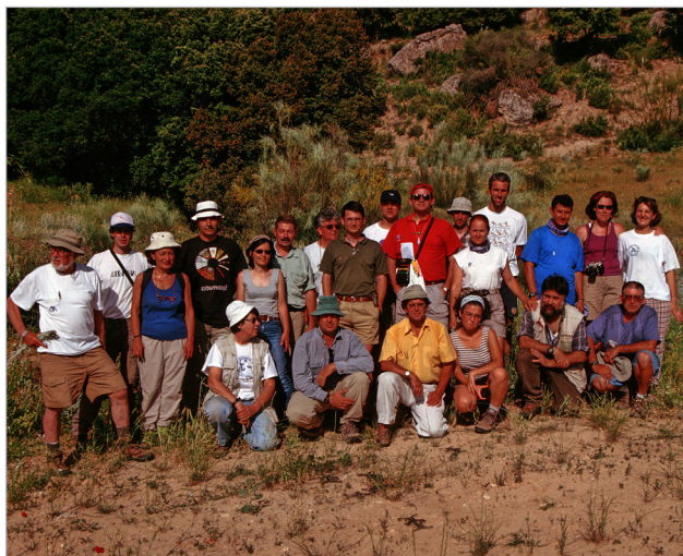
Granada, año 2000.