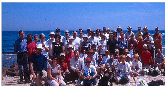
Almería, año 2005.