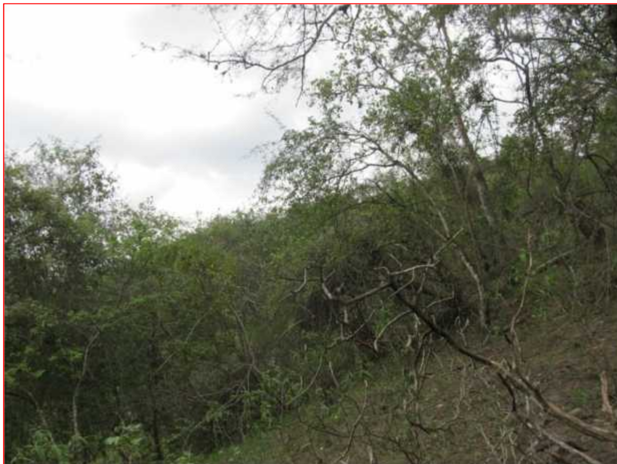
Fig. 04: Vista panorámica de la zona de evaluación 02.

ZONA 02: Se ubicó en las coordenadas 0618164 y 9491730, a una altitud de 749 msnm, con un área es de 200 ha y se caracterizó por presentar un suelo terroso con pendiente marcada, sin vegetación dominante (Fig. 04).