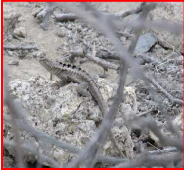
Microlophus occipitalis "lagartija"