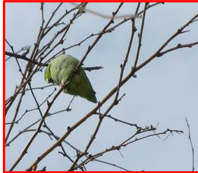
Forpus coelestis "periquito"