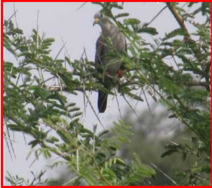
Columbiga cruziana "tortolita"