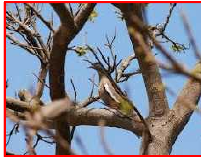
Zenaida meloda "cuculí"