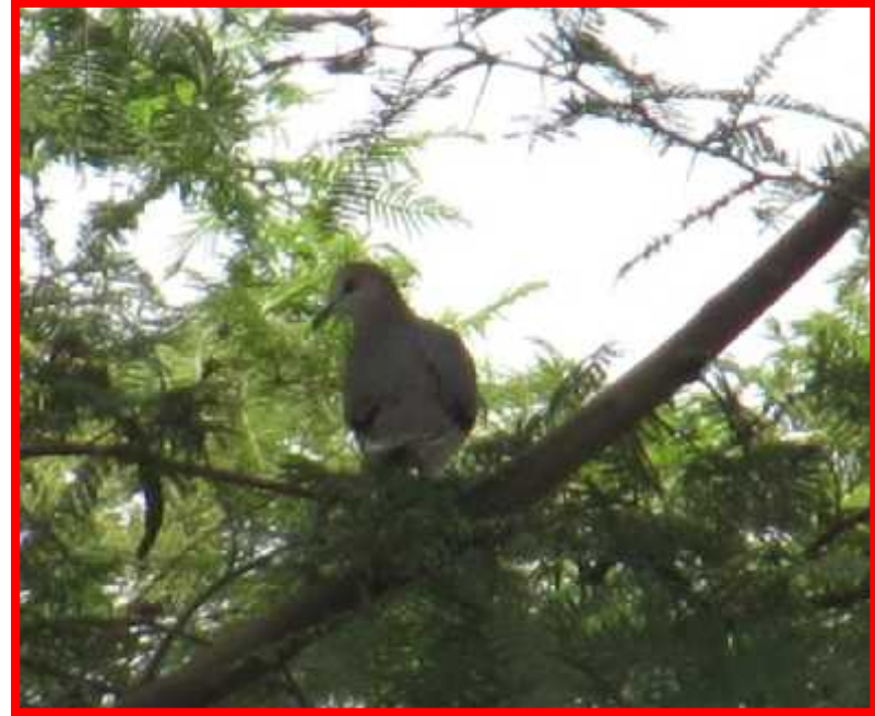
Zenaida auriculata "rabiblanca"