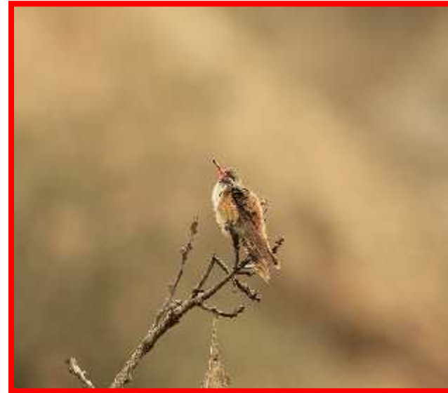
Amazilia amazilia "picaflor de paca"