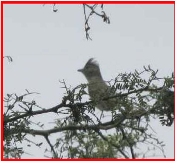
Camptostoma obsoletum "mosquerito"