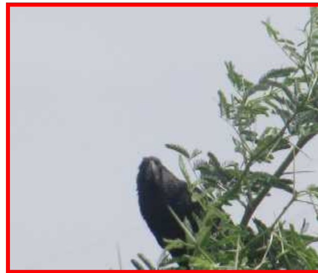
Crotophaga sulcirostris "Chucluy"