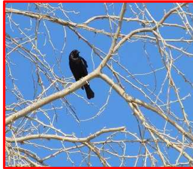
Dives warszewiczi "negro fino"