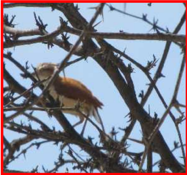
Furnarius leucopus "chilalo"