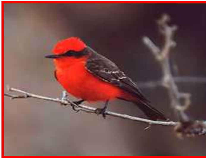
Pyrocephalus rubinus "putilla"