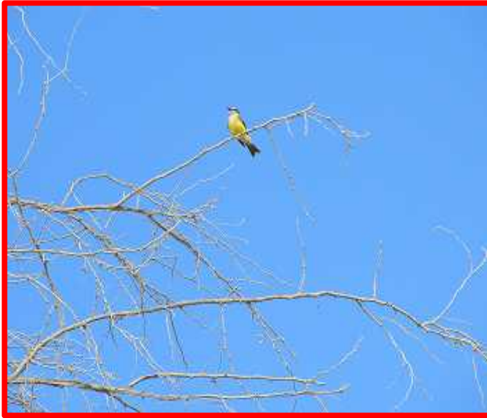
Tyrannus melancholicus "pespite"