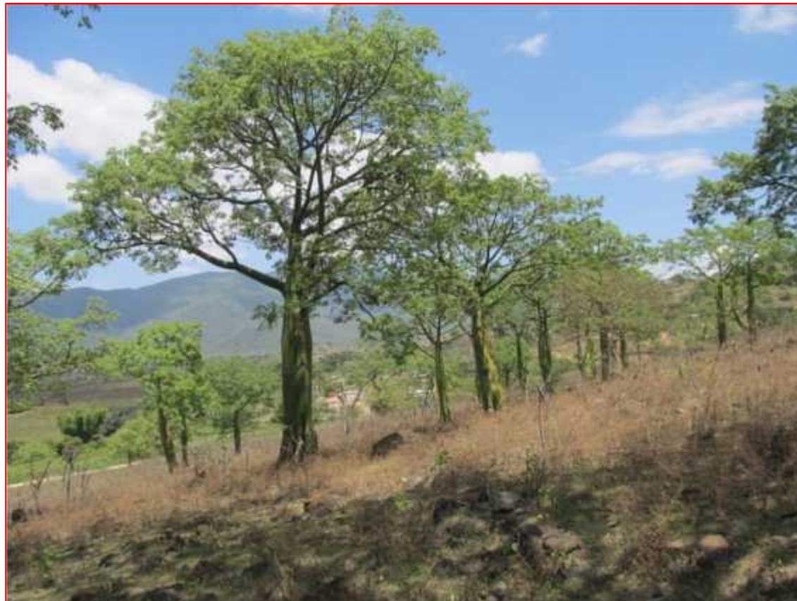
Fig. 03: Vista panorámica de la zona de evaluación 01.

ZONA 01: Ubicada en las coordenadas UTM 0618163 y 9489892, con una altitud de 621 msnm, cuya área es de 100 ha y se caracterizó por presentar un suelo rocoso - pedregoso, la vegetación dominante fueron los “ceibos”, con hierbas secas, por lo que es considerado como un ceibal (Fig. 03).