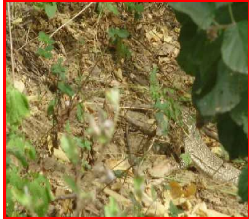
Callopistes flavipunctatus "falsa iguana"