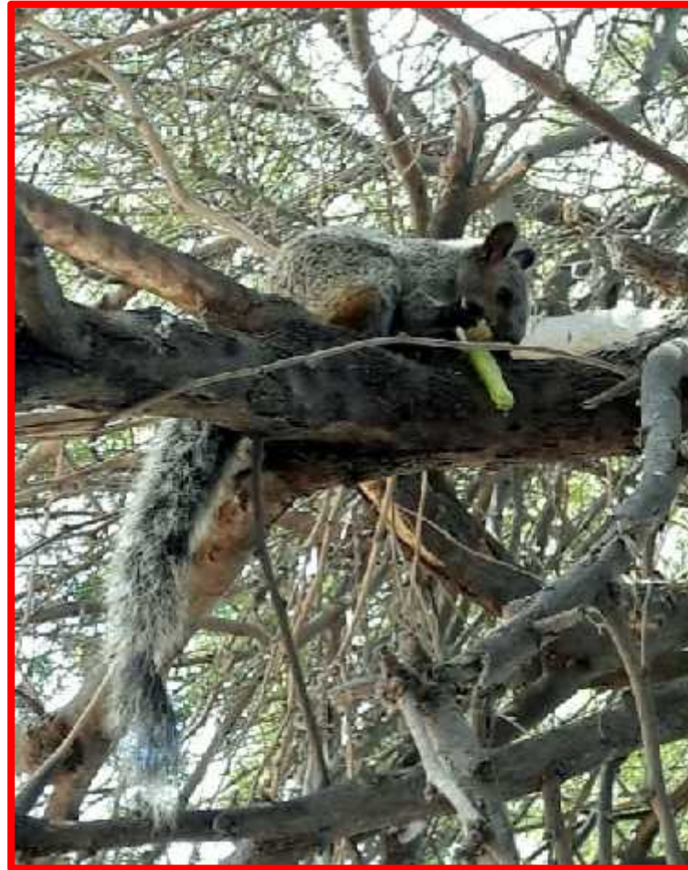
Sciurus stramineus “ardilla nuca blanca”

Se registró solamente la presencia de 01 mamífero: