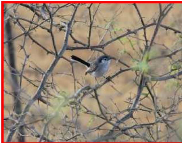
Polioptila plumbea "chirito gris"