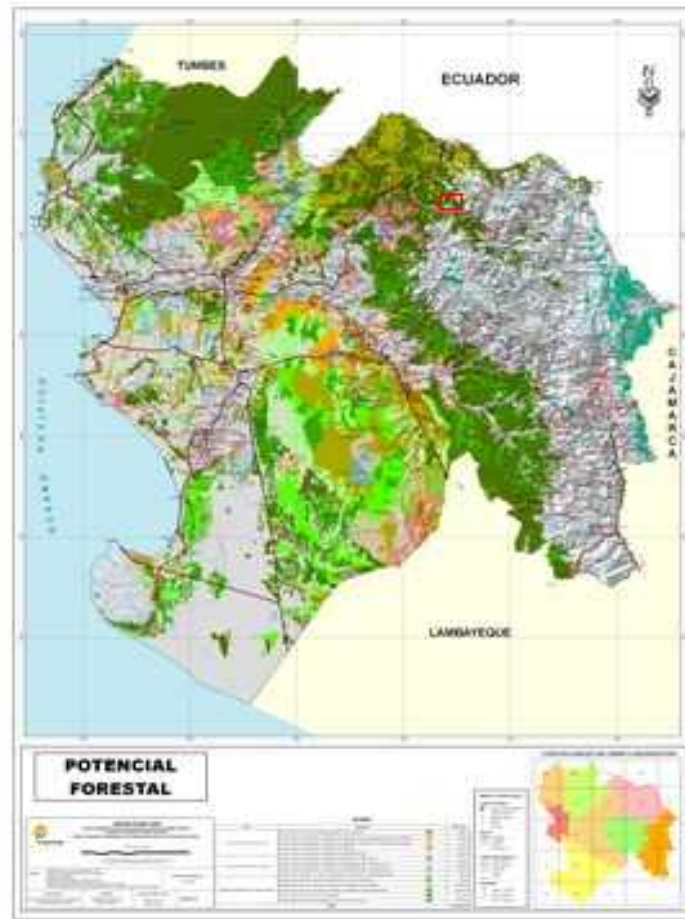
Fig. 2: Mapa Forestal de Piura, señalando en recuadro ubicación de bosque evaluado

De acuerdo al Mapa de Potencial forestal del Gobierno Regional de Piura (ZEE) corresponde al Tipo: Bosques para Manejo Forestal y a la Unidad: Bosque de Aprovechamiento Sostenible No maderable (Fig. 2).