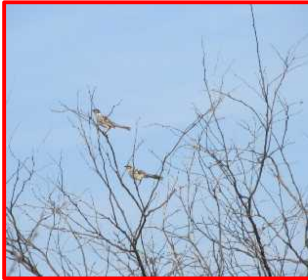
Mimus longicaudatus "zoña"