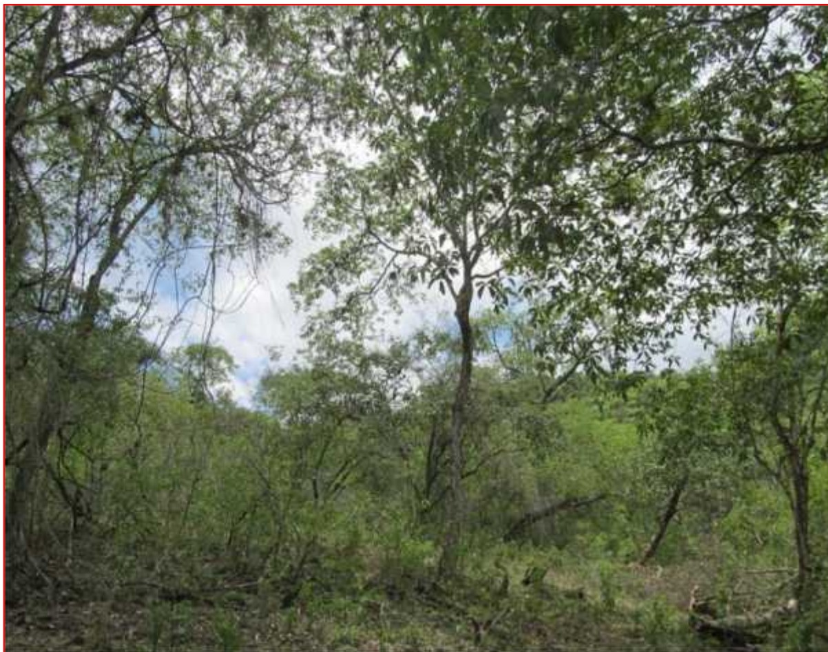
Fig. 05 Vista panorámica de la zona de evaluación 03.

ZONA 03: Se ubicó en las coordenadas 0617119 y 9491986, altitud de 726 msnm, con un área es de 200 ha y presentó un suelo terroso con pendiente marcada y sin vegetación dominante (Fig. 05).