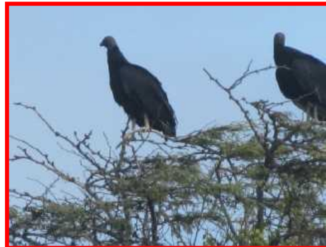
Coragyps atratus "gallinazo cabeza negra"