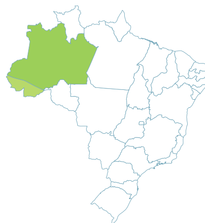
MAPA 4 - Distribuição geográfica de Oenocarpus mapora .

A composição química da polpa dessas espécies evidencia excelente qualidade alimentar (Tabela 1). Apenas o pH apresenta-se acima do padrão de qualidade, possivelmente devido ao estágio inadequado de maturação dos frutos (Pinheiro et al., 2015). Outra característica importante refere-se ao teor de sólidos solúveis totais (SS) por estarem relacionados com teores de açúcares e ácidos orgânicos que deve alcançar até 2º Brix. Para a polpa de O. bacaba os valores de SS variam de 2,03 e 1,88ºBrix (Pinheiro et al., 2015) a 13,33ºBrix (Alcântara, 2014), sendo um pouco menor em O. mapora . Os teores de cinzas totais são consideráveis e expressam o teor de substâncias inorgânicas (minerais) contidas nas amostras, sendo maior em O. mapora . A acidez, uma característica importante na conservação