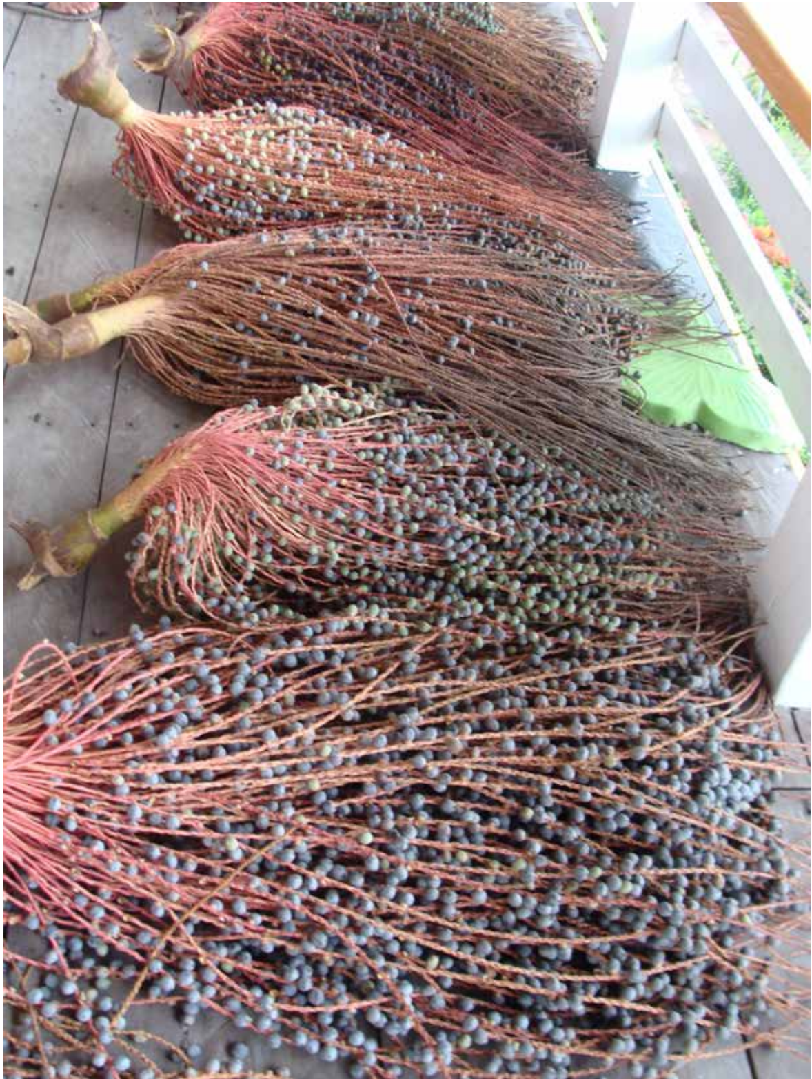
FIGURA 4 - Cachos de Oenocarpus bacaba prontos para a retirada dos frutos