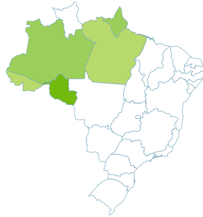
MAPA 1 - Distribuição geográfica de Oenocarpus bacaba .

HABITAT: Na região Norte as espécies de bacaba habitam diferentes locais. Oenocarpus bacaba ocorre em matas densas e secundária e em capoeiras, em áreas de terra firme e de várzea, em solos pobres, argilosos e não alagados, abaixo de 700m de altitude. Pode também ser encontrada em áreas abertas de solos bem drenados, de baixa altitude e com precipitação média anual de 1500 a 3000mm. O. distichus vegeta em florestas de várzea e de terra firme, na transição da floresta para o cerrado, em serras e terrenos rochosos, quase sempre em áreas de baixa precipitação pluviométrica, sendo frequente nas matas e capoeiras, crescendo também em áreas devastadas de solo arenoso. O. balickii habita florestas tropicais de terra firme em baixas altitudes. O. minor ocorre nos sub-bosques de terra firme de baixa altitude, em solo seco e argiloso. O. mapora possui habitats variados, em