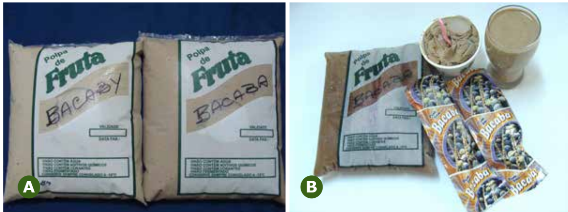
FIGURA 3 - Polpa de Oenocarpus minor (bacaby) e Oenocarpus bacaba (bacaba). A) In natura; B) Polpa congelada e outros produtos