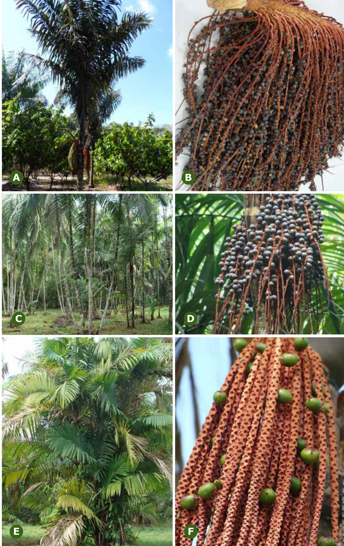
FIGURA 2 - Oenocarpus distichus : A) Planta; B) Cacho. Oenocarpus mapora : C) Plantas; D) Cacho. Oenocarpus minor : E) Planta; F) Cacho.