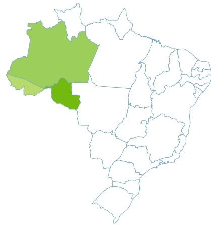
MAPA 2 - Distribuição geográfica de Oenocarpus balickii .