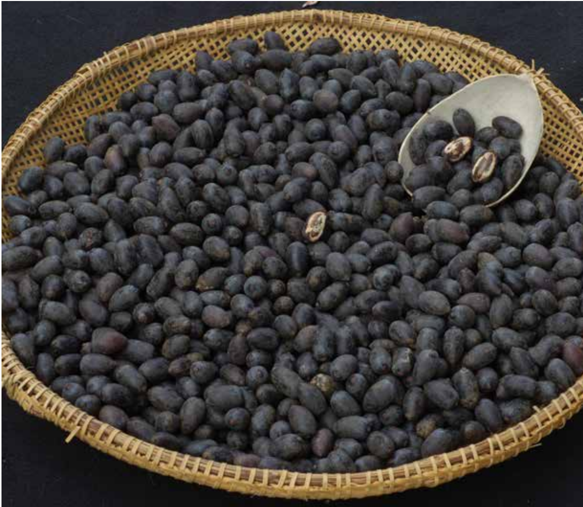
FIGURA 5 - Frutos de Oenocarpus bacaba para processamento