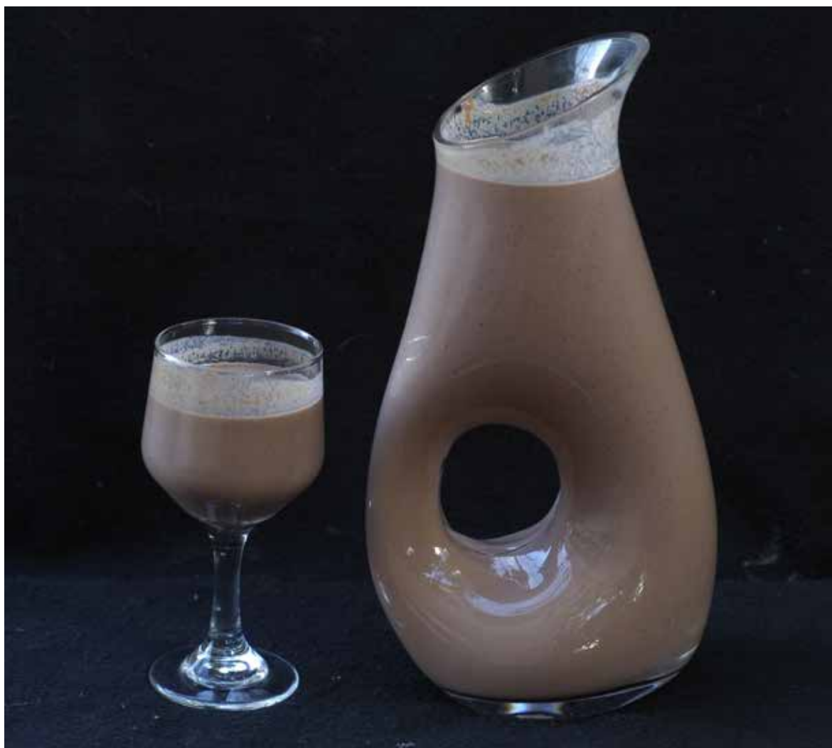
FIGURA 6 - Bebida preparada à base de polpa de frutos de Oenocarpus bacaba

Em plantios experimentais da Embrapa Amazônia Oriental a estimativa de produtividade para as espécies mono-caules alcança 10,2t de frutos/ha/ano, na densidade de 204 plantas. No caso das multicaules a produtividade também fica próxima de 10t de frutos/ha/ano. Nesses plantios não foi constatada a ocorrência de doenças, mas foram registrados ataques de coleópteros ( Dynamis borassi ) no estipe e nas bainhas foliares. O ataque das larvas no estipe é facilmente detectado pela presença de exsudação mucosa ao longo da casca e