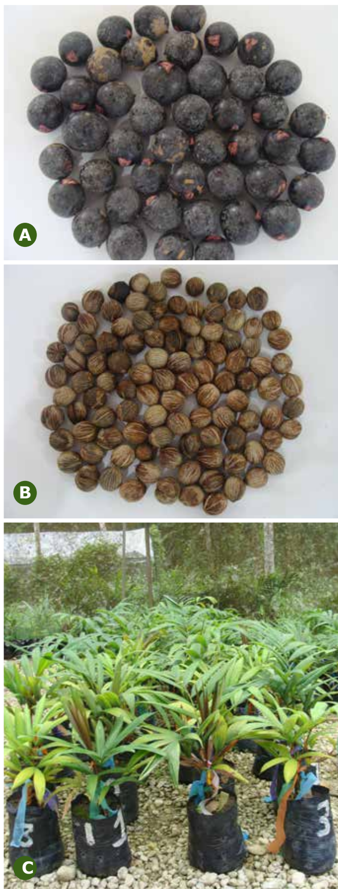
FIGURA 7 - Oenocarpus distichus : A) Frutos maduros; B) Sementes. Oenocarpus mapora : C) Mudás.

As mudas devem ser plantadas em local definitivo entre oito a doze meses após a repicagem, quando