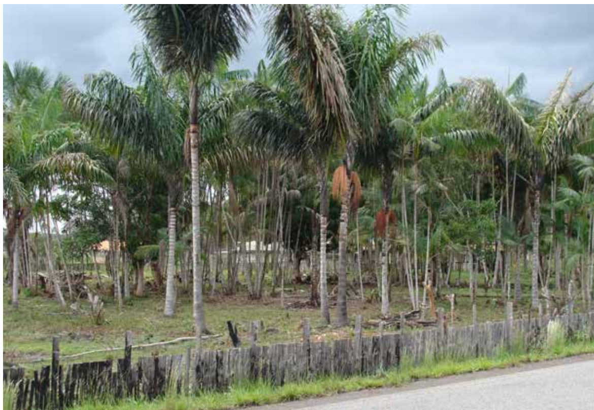
FIGURA 8 - Quintais produtivos com Oenocarpus distichus

Em vista das potencialidades dessas espécies como plantas alimentícias, principalmente aos mercados de polpa processada e de óleo comestível, acredita-se que o manejo sustentável seja a forma mais viável de exploração econômica destas espécies no curto e médio prazo, constituindo uma fonte de emprego e renda para as comunidades ribeirinhas, tradicionais e de outros grupos que vivem do extrativismo na região Norte.