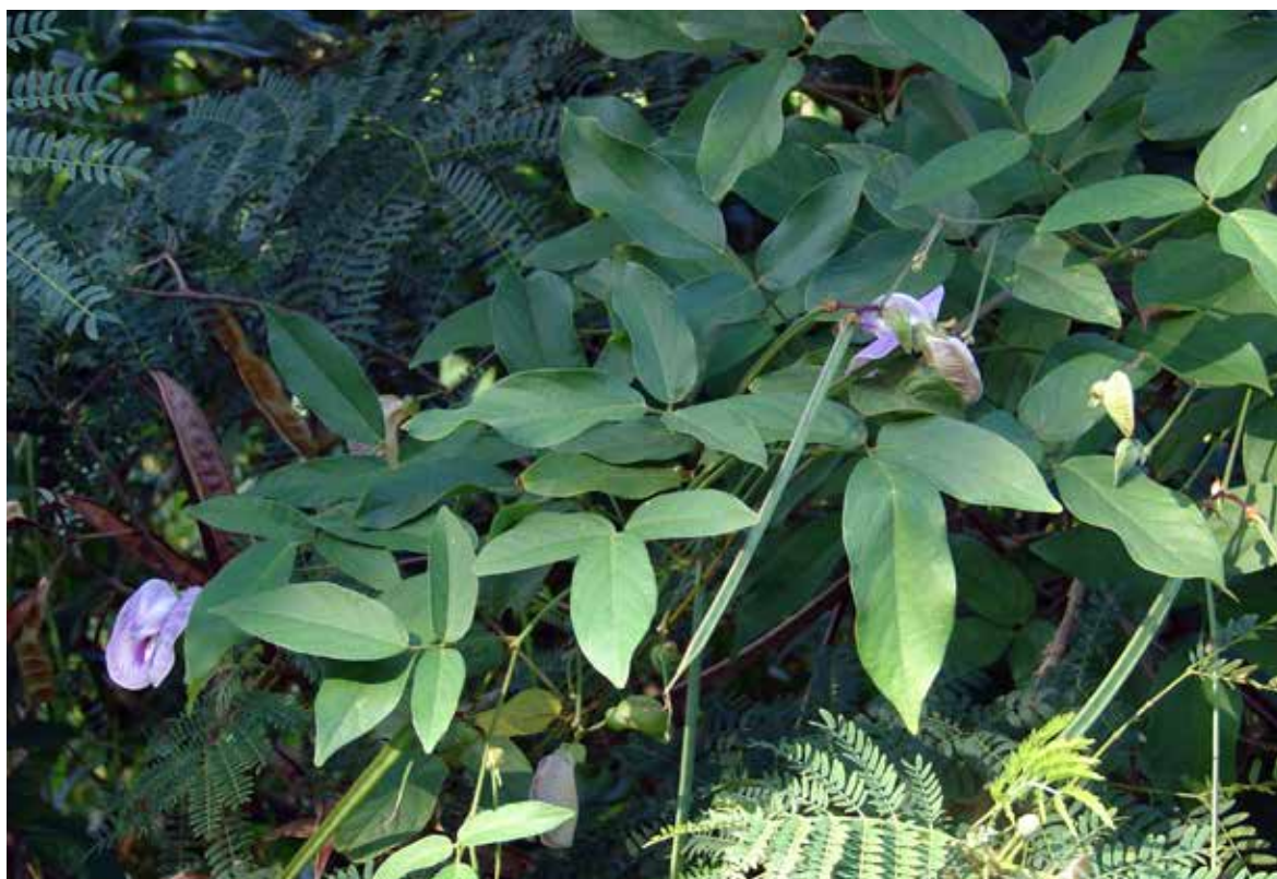
FIGURA 1 - Planta de Centrosema macrocarpum

PARTES USADAS: Na alimentação animal são utilizadas as folhas, pecíolos, inflorescências e ramos jovens. A planta inteira também é importante como planta ornamental, usada no paisagismo urbano (Coradin; Ramos, 2016).