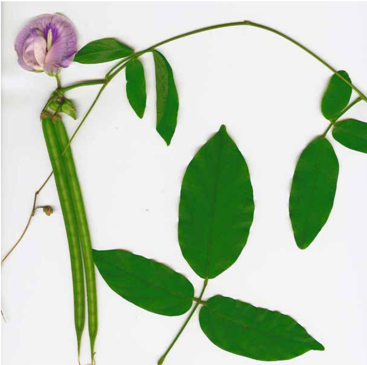
FIGURA 2 - Detalhes de folhas, flor e frutos de Centrosema macrocarpum

Para Schultze-Kraft et al. (1990) a ocorrência natural de C. macrocarpum está associada a solos ácidos de fertilidade média à baixa e com 430 a 4.000mm anuais de chuva. É uma espécie com grande potencial para alimentação animal (Schultze-Kraft, 1990), tolerante à seca e com forragem de boa qualidade (Coradin; Ramos, 2016). Não é severamente atacada por doenças que ocorrem tradicionalmente nas espécies do gênero Centrosema , podendo produzir até 15 toneladas de matéria seca/ha/ano (Tropical Forages, 2018). Costa e Oliveira (1993) reportaram uma produção de forragem de até 26 toneladas de matéria/há, nas condições climáticas de Rondônia. Com relação a fixação de nitrogênio, Vargas et al. (1993) relataram que C. macrocarpum apresentou baixa nodulação e não respondeu satisfatoriamente a inoculação com estirpes. Entretanto, em condições experimentais na Colômbia, Cook et al. (2005) obtiveram sucesso na seleção de estirpes que favoreceu o crescimento da espécie.