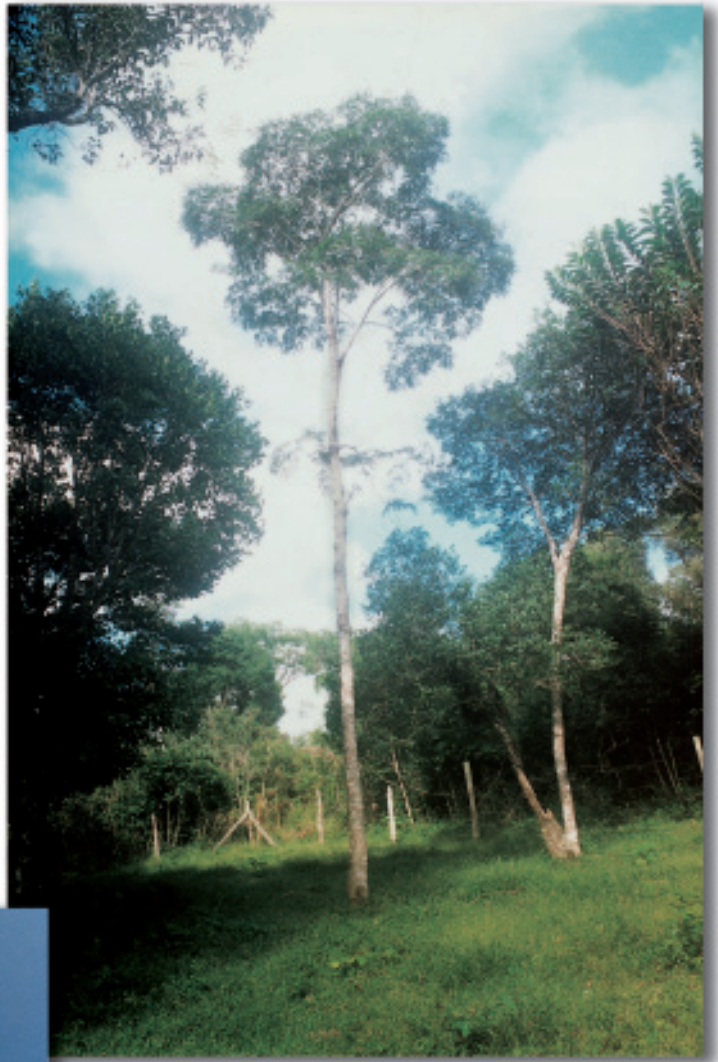
Árvore (Irati, PR)