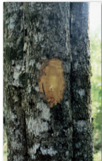
Casca externa e interna (Colombo, PR)