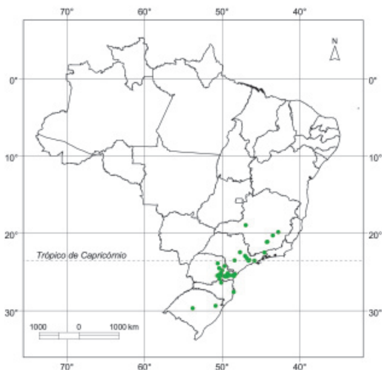
Mapa 64. Locais identificados de ocorrência natural de jacarandá ( Dalbergia brasiliensis ), no Brasil.