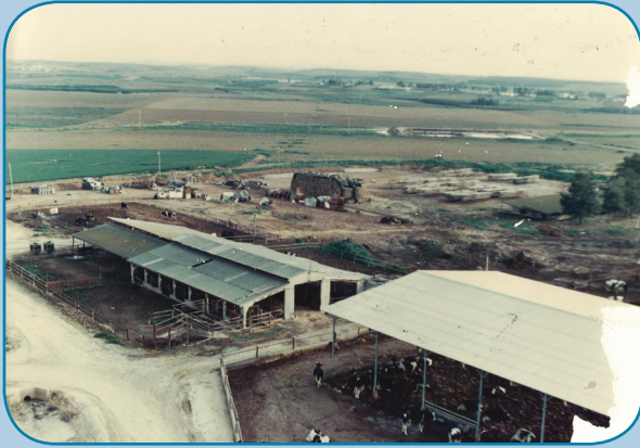
רפת גת ב-1980, לפני האיחוד

ש ביט לב הוא דור שלישי לרפתנים בקיבוץ גת, נולד ב-1968 ומגיל צעיר מאוד גדל ברפת. גם במהלך הלימודים ב"מוסד" למד רפת (כי זרקו אותו מהלימודים בגלל הפרעות קשב).