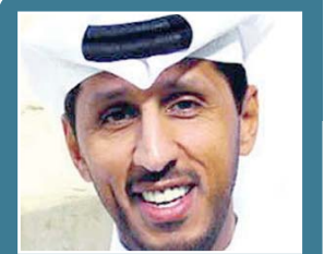
ت وليد الناصي