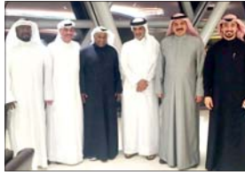
تأكيداً لما نشرته «الشرق».. المعيوف يثمن دعم الاتحاد القطري

أعلن نادي السباق والفرسية أن سباق سيف حفرة صاحب سمو أمير البلاد المفدى سوف يتم خلال الفترة من 25 إلى 27 من شهر فبراير الجاري، حيث كان مخططاً في السابق إقامة السباق الرئيسي في الثامن والعشرين من هذا الشهر وستتطلب فعاليات السباق يوم الخميس 25 فبراير بإقامة 8 الدورات مع السباق رقم 33 في موسم الصيف، وستواصل فعاليات السباق بإقامة سباق الخيل الذي في 34 من