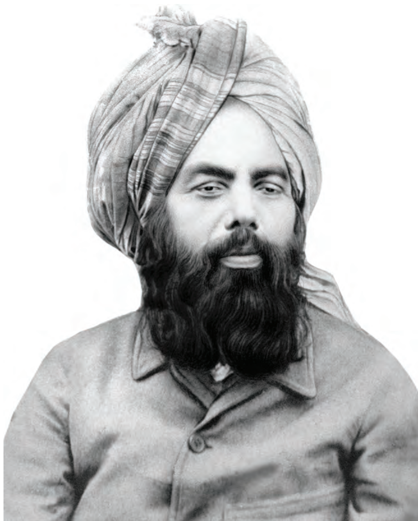
Hazret Mirza Ghulam Ahmed as Mesih i Premtuar dhe Imam Mehdi