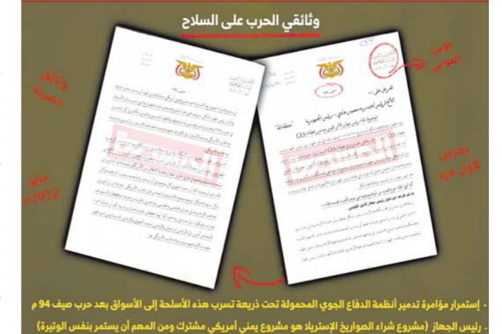
استمرار مؤامرة تدمير أنظمة الدفاع الجوي المحمولة تحت ذريعة تسرب هذه الأسلحة إلى الأسواق بعد حرب صيف 94 م - رئيس الحجاز (مشروع شراء الصواريخ الأسترالية هو مشروع يمني أمريكي مشترك ومن المهم أن يستمر بنفس الوتيرة)