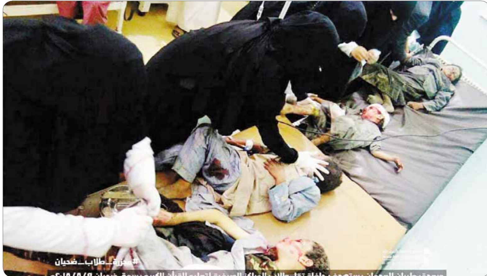
شباب طلاب في مخيم

مبيناً أن أهمية توثيق الجرائم تكمن في رفع دعوى قضائية أمام المحاكم الوطنية كإجراء أولي تعتمد المحاكم الدولية كمرحلة من مراحل التقاضي، وهو ما أكد عليه النظام القضائي الدولي وفق قواعد موحدة متفق عليها بهذا الشأن.