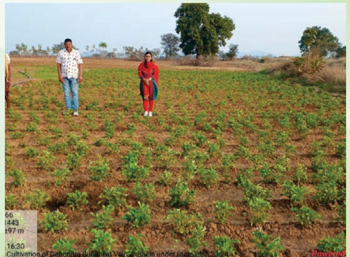
66 1443 ±97 m 16:30 Cultivation of Debendra Sunani at Vill/GP-Bhele under state PIAA,23-24