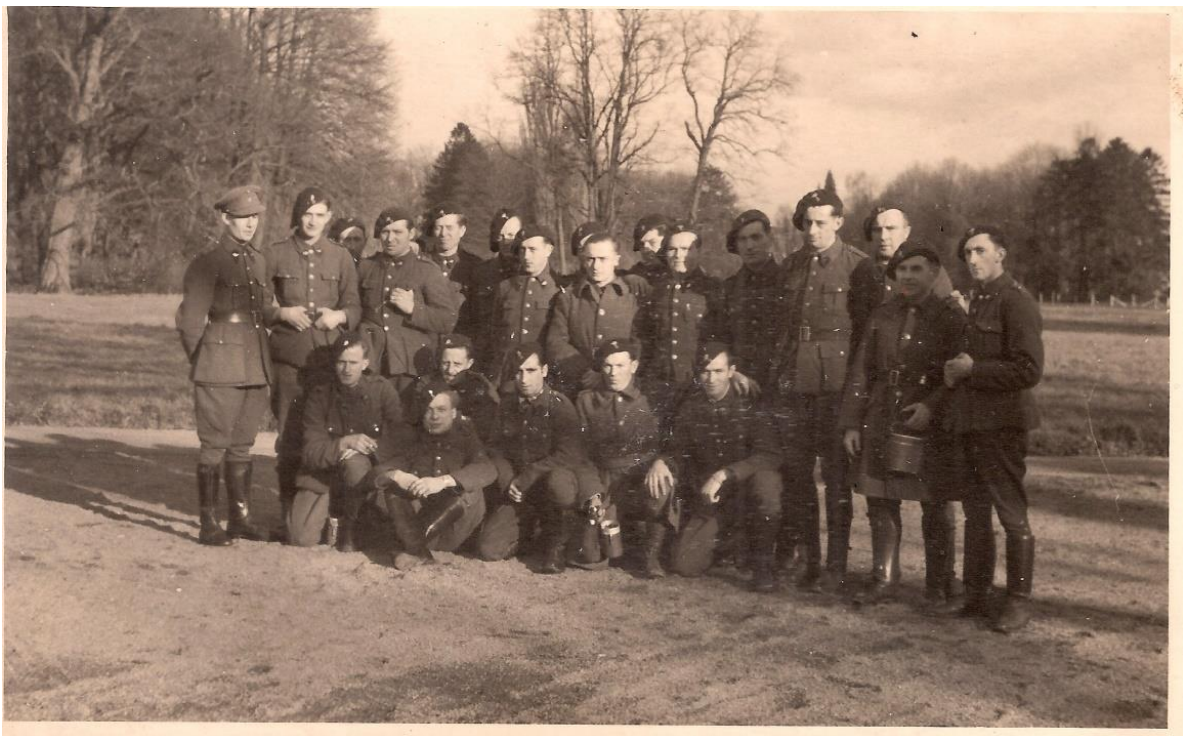
5ChA à Couthuin