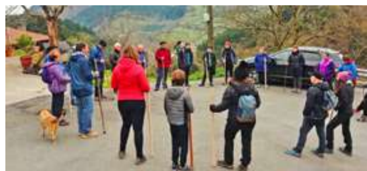
Mañariarrak Santa Ageda koplak abesten, joan zen zapatuan.

bitartez, Aste Santu inguruan. 2015etik proiektuan parte hartu duten umeen familiei janaria erosteko da dirua. Antolatzaileek "eskerrak" eman dizkiete herritarrei eta bazkaria prestatu zuten boluntarioei.