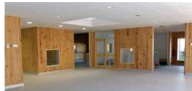
Barrualdean espazio irekiak, egurra eta argitasuna dira nagusi.