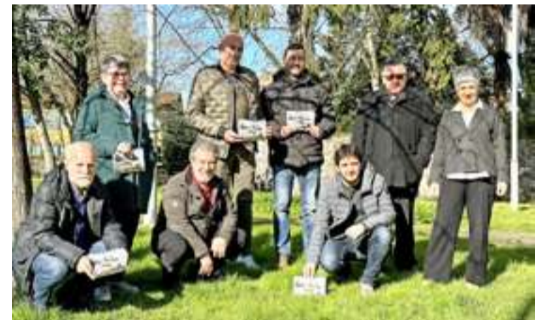
JAED, Errotari eta Dendak Bai elkarteetako kideak, udal agintariekin.