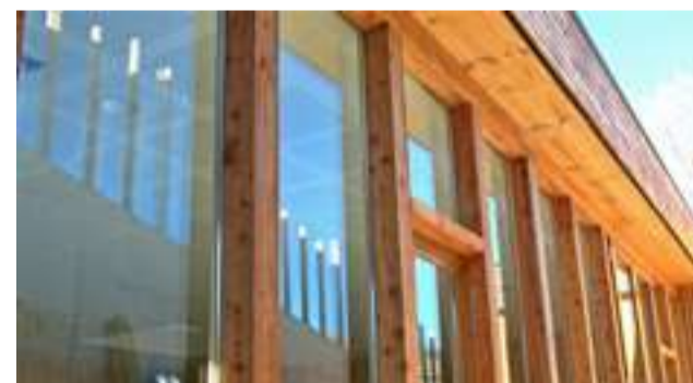
Leiho ugari argitasuna hobetu eta inguruko behatzeko aukera ematen diete umei.