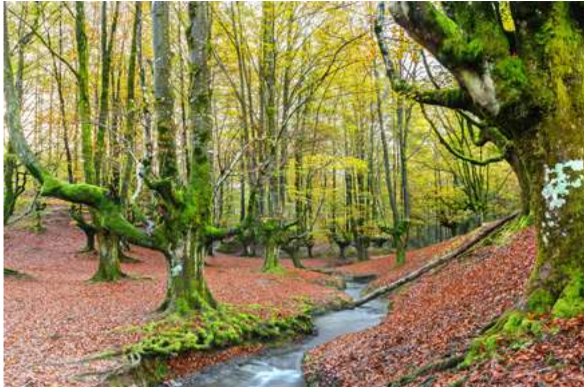
Udalak Lur Geroa enpresari esleitu dio aholkularitza zerbitzua.

Pinudiak murrizteagaz batera, bestelako baso ereduak sustatu gura dituzte. Horrela, harizti eremuak areagotzea eta hariztien eta pagadien basoberritze naturalak sustatu gura dituzte. Azkenik, datozen urteetan inbertsioak egin gura dituzte bioaniztasuna kontserbatzeko eta hainbat espezieren habitata hobetzeko.