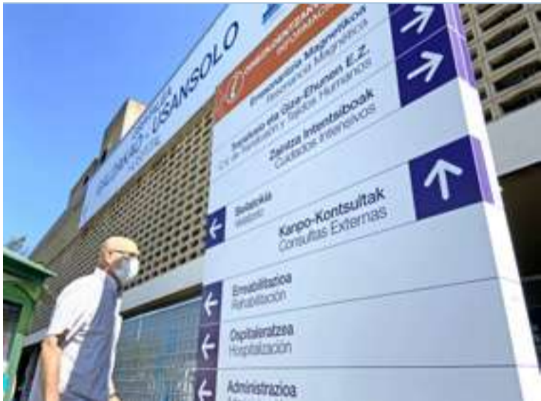
Usansoloko ospitalearen kanpoaldea.