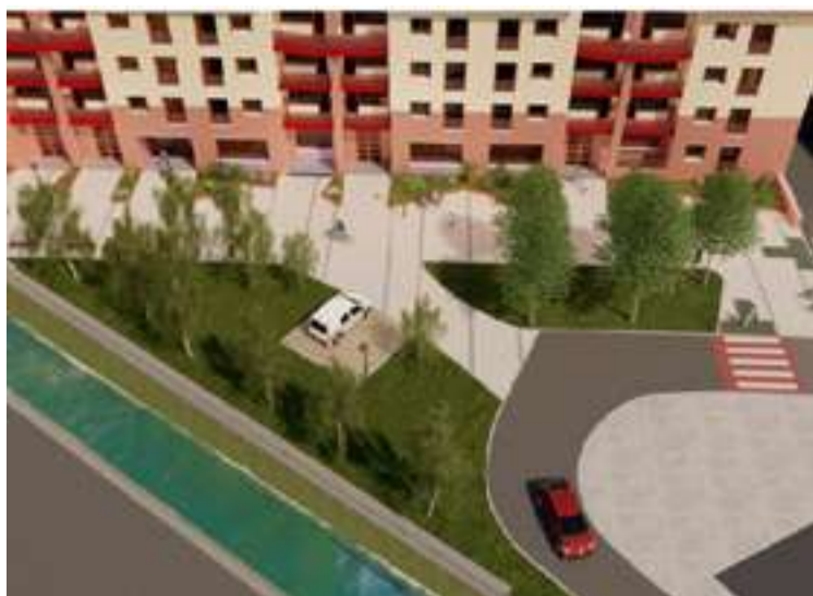
Esteibarlanda kaleko infografia.