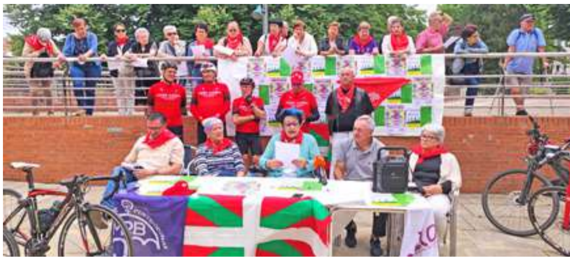
Durungaldeko pentsiodunen mugimenduak 2022an antolatutako bizikleta martxaren aurkezpena.

J.A.: Gurea herriaren aldeko mugimendua dela esatea gustatuko litzaidake, eta denon alde egiten dugula. Jende askoren falta sumatzen dut, ezkerreko aldarrikapenetan ikusi izan dudana jendearena.