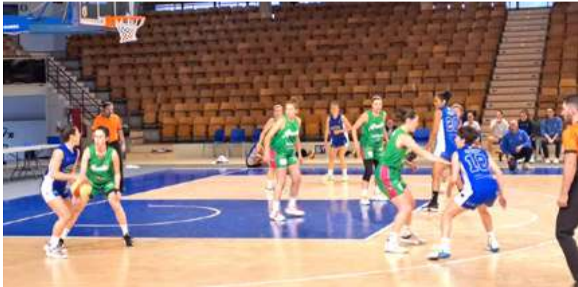
Tabirako Baqueko jokalaria urdinez, Araskiren kontrako partiduan. IRENE BARRENETXEA

Azarotik honako partidu guztiak irabazi ditu eta sailkapeneko bigarren tokian kokatu da