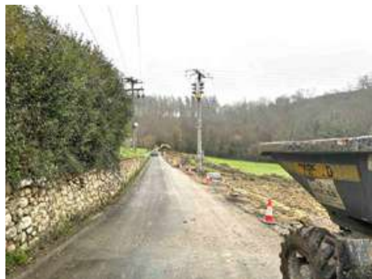
Hilerrirako bidea konpontzen ari dira.

Eliza eta hilerrira lotzen dituen bidea konpontzen dabilta Berrizen; 300 bat metroko luzera duen egungo zoladura egokitzea eta birgaitzea da helburua. Lanek ia 235.000 euroko aurrekontua dute eta, Berrizko Udalaren esanetan, lanak hile bi barru amaitzea aurreikusten du. Bideak lau metro eta erdiko zabalera izango du, oinezkoak eta ibilgailuak batera errazago igaro ahal izateko. Errepidearen egoera hobetzeaz gainera, inguruko segurtasuna ere hobetuko duela azaldu du Berrizko Udalak. Bizkaiko Foru Aldundiak ia 30.000 euroko diru laguntza eman du.