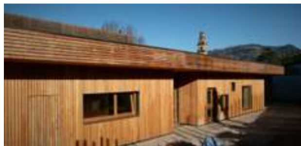
Egurra eta beira nagusi fatxada guztietan, kokaleku ezin hobean.

"Ikastolan egin nituen urte guztien oroitzapen oso onak ditut. Uste dut 16 urte egin arte han ikasi eta bizi izandakoak asko lagundu didala gerora dantza munduan egindako ikasketak burutzeko eta ondorengo ibilbide profesionalerako."