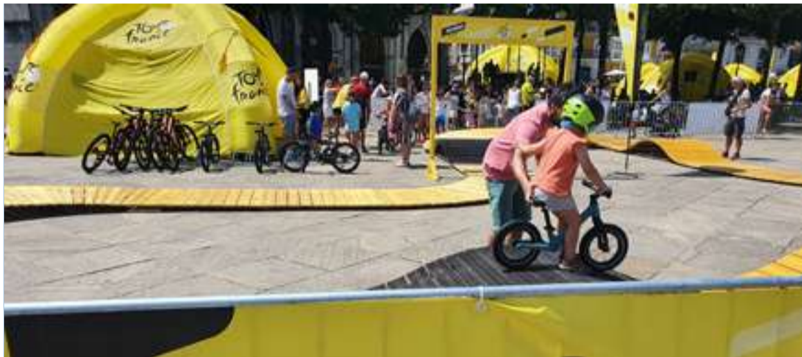
Zornotzan iazko urrian egin zuten Tour Eguna.

Txirrindularitza elkarteak bizikleta martxa antolatu du 12 urtetik beherakoentzat