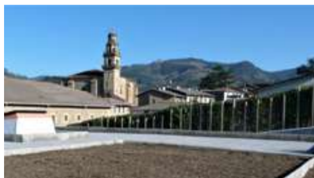
Teilatu gainean lurra ipini dute, bertan landareak landatu eta, ingurumenari laguntzeaz batera, isolamendua hobetzeko.