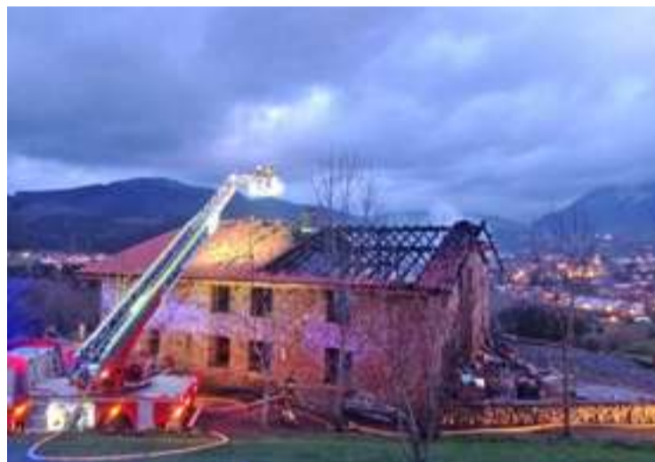
Araunaonandia baserria sutea gertatu eta gero.

Familiei laguntzeko asmoz, eta baserria berritzeko gastuei aurre egiteko, familia hauen kuadrillakoek diru bilketa bat ipini dute martxan. "Antzinako ohiturei jarraituz eta herri elkartasunari helduz", adierazi dute. Horretarako, kontu korronte zerbaki bat zabaldu dute: ES91 3035 0003 41 0031119557