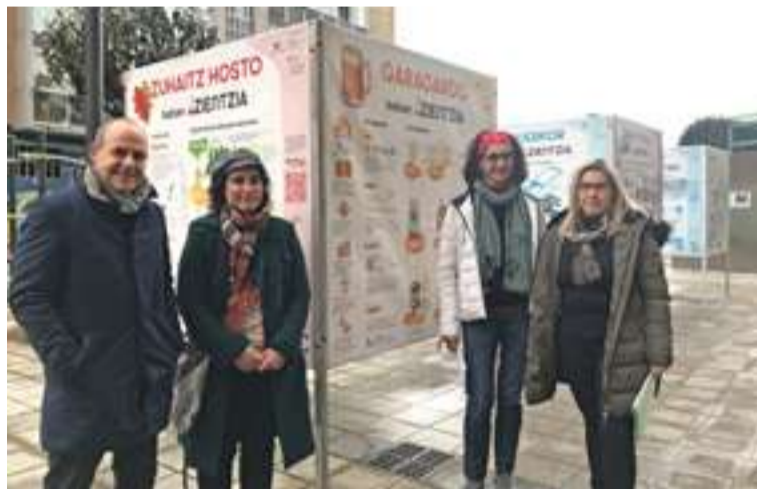
Udal ordezkariak eta NorArte estudioko kide bat, aurkezpenean.

Euskaraz eta gaztelaniaz egindako 11 infografiaz osaturiko 'Zientzia kalean' erakusketa dago ikusgai Amilburun