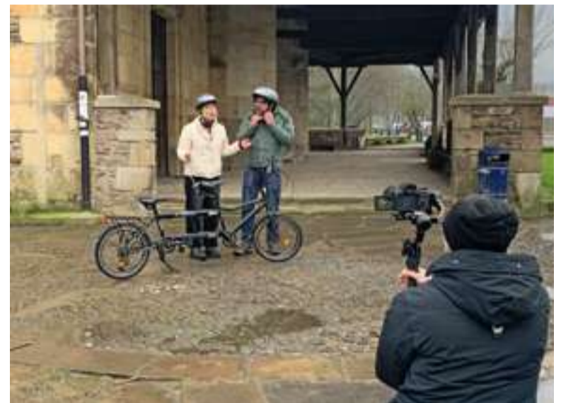
Tabirako elizaren aurrean filmatu zuten saioari hasiera emango dion sekuentzia.