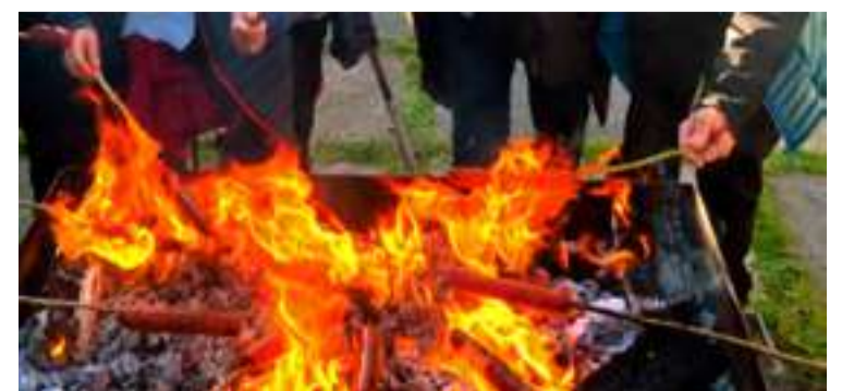
Izurtzan urtero ospatzen dute txitxiburduntzi eguna.

egin ahal izateko sua eta edariak (garagardoa, freskagarriak...) udalak ipiniko ditu, udal arduradunek azaldu dutenez. Txitxiburduntzirako janaria eta bestelakoak, ostera, norberak eraman beharko ditu plazara.