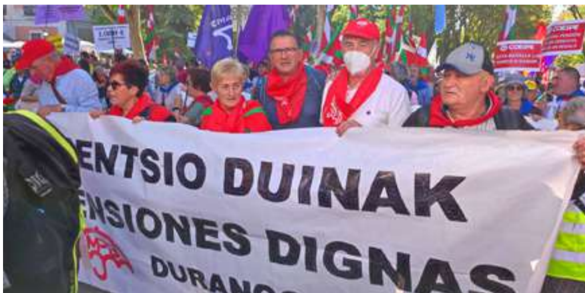
Durungaldeko pentsiodunak iaz Madrilan egindako mobilizazio batean.