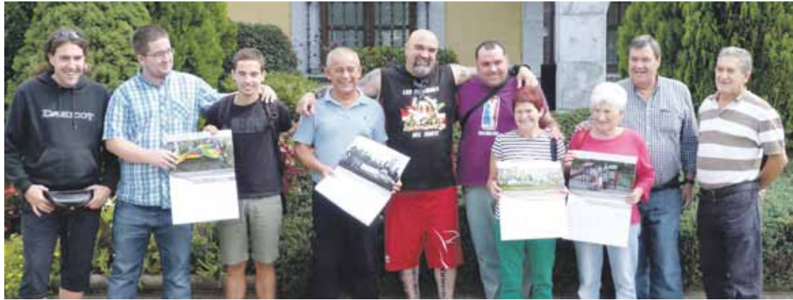
Herriko hainbat elkartet eta aurpegi ezagunek egutegi solidarioan parte hartu dute.

Haurren minbiziaren ikerkuntzan laguntzeko, egun osoko egitaraua burutuko dute, bihar