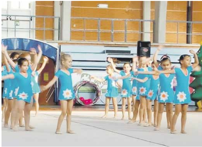
Iazko Txikigym erakustaldiko une bat. Uztai