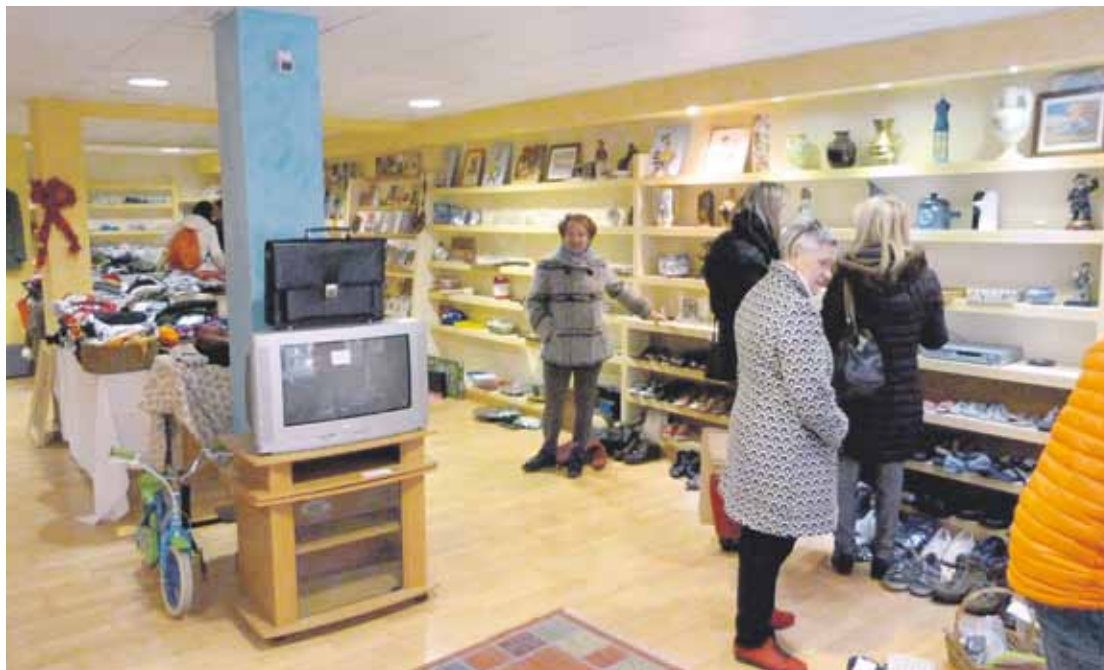
Askotariko objektuak aurkitu daitezke domekan atek itxiko dituen Durangoko merkatu txikian.

Gabonetako merkatu txikia antolatu dute herritarrek emandakoekin, 13. urtez