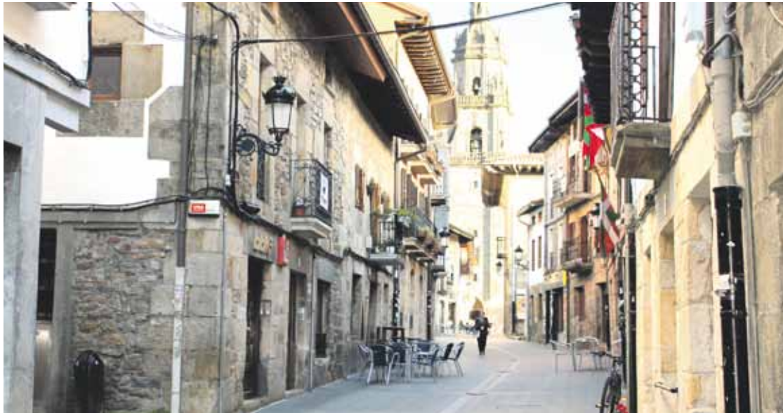
Artelalen dago Otxandioko taberna eta denda kopururik handiena.