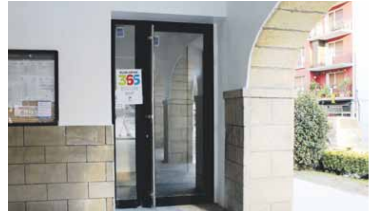
Udaletxeko sarbide berria aterpetik izango da.

Udaletxeko obrak, berriz, amaitzear daude