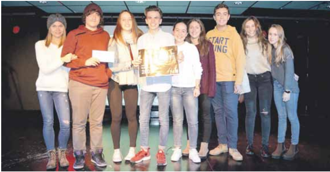
14 urtetik gorako ikusleen saria irabazi duten gazteak saria jasotzen.

'Not in my town' bideo lehiaketak aurtengo lau lanik onenak saritu ditu