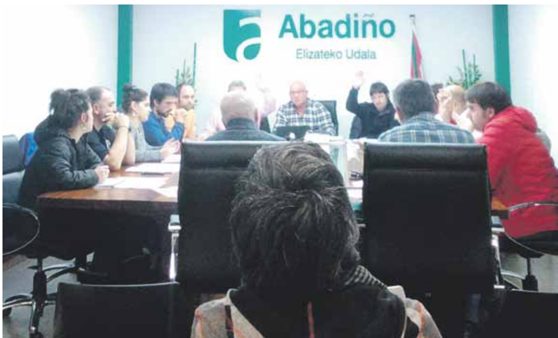
Plataformaren helegitea berraztertzea ukatu zuten Abadiñoko Independentiek eta EAJk.

Azaroaren 28ko udalbatzan ere mahai gainean izan zen plataformaren eskaria