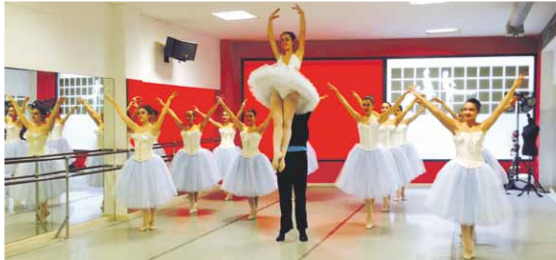
L'Atelier Dantza Eskolako kideak 'El Cascanueces' obra klasikoa prestatzen ari dira.

Abenduaren 20an eta 21ean eszenaratuko dute Tchaikovskyren lana