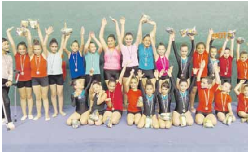
Zaldibarko Olazarmendi Erritmika Taldeko gaztetxoak.