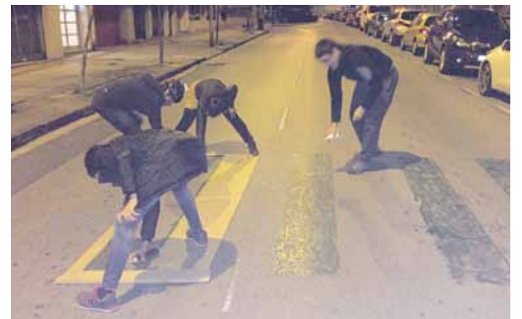
EH Bilduk Sasikoan margotutako zebra-bidea, tren geltokirako pasabidean.