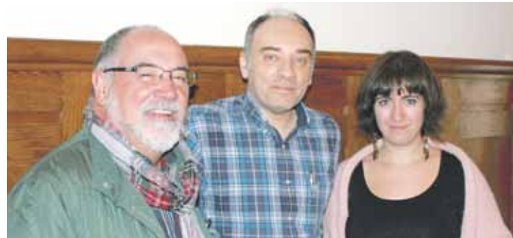
Lertxundi, Buruaga eta Martinez hitzarmena sinatzeko ekitaldian.

Batez beste, 9 familiari eman diete laguntza hilero; 2018ra arte martxan egoteko hitzarmena sinatu dute