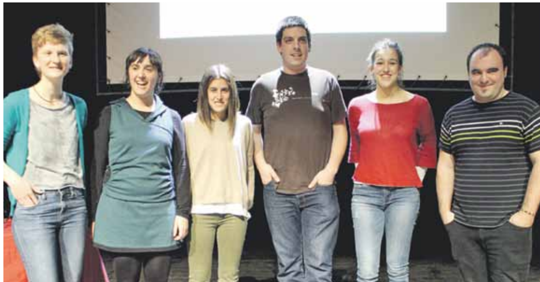
Lehiaketako irabazleak eta epaile lanetan ibili diren sortzaileak, ekitaldiaren amaieran.

Eguaztenean burutu zuten lehiaketako sari banaketa ekitaldia Durangoko Plateruena kafe antzokian