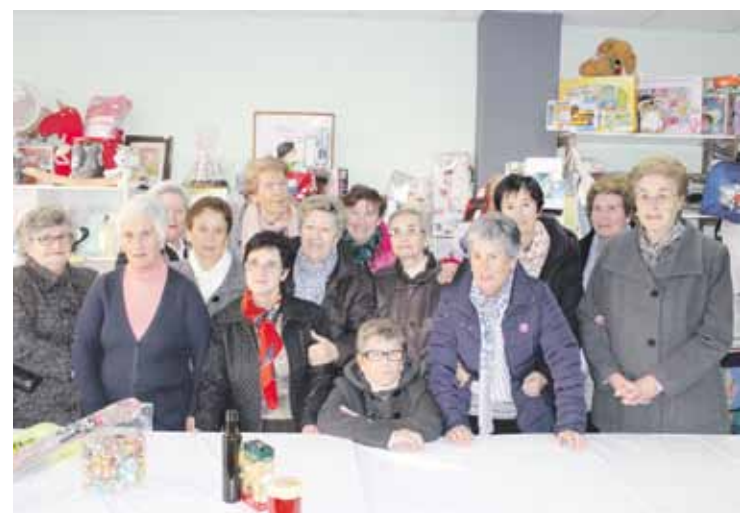
Caritaseko emakumeek tonbolako azken prestaketa lanak egiten.

erantzun bikaina izan du herrian”, aitortu dute antolatzaileek. “Gainera, jakin badakigu herritarren laguntzarik eta esker onik gabe tonbola honek ez lukeela arrakastarik izango”, baieztatu dute.