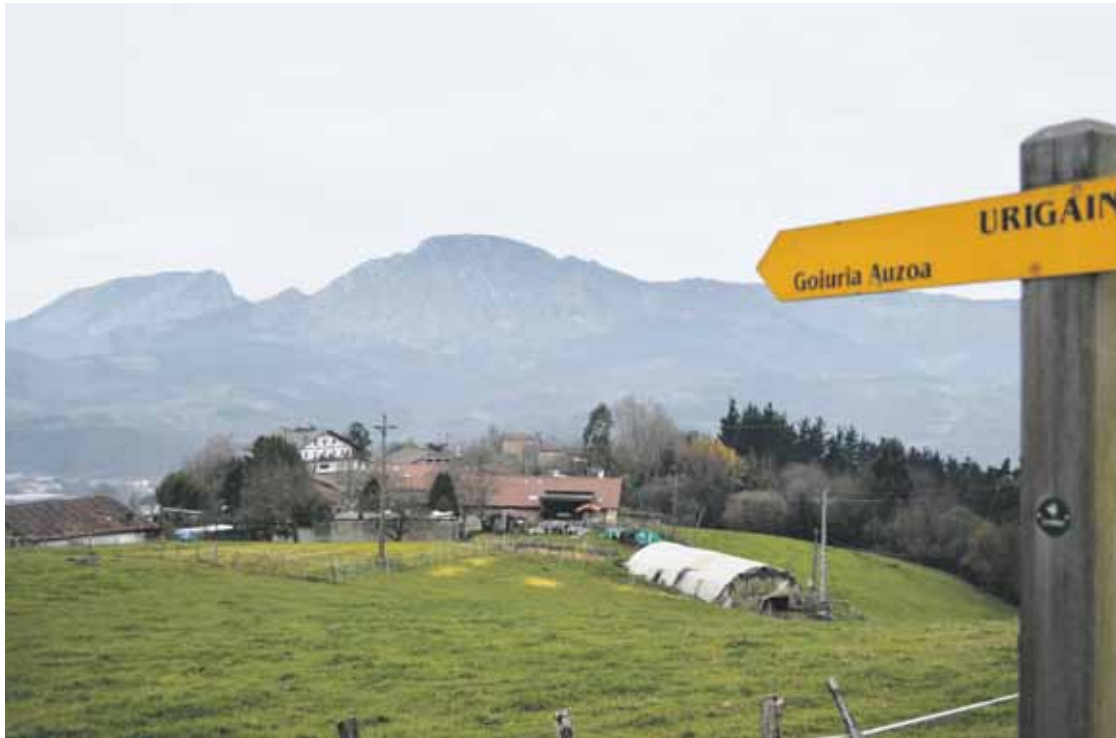
Goiuria auzoko ur-hornidura sarea berriztuko dute 2017an. Horretarako bideratuko dute inbertsio atalik potoloena.

Iurretan, alderdi guztien adostasunagaz onartu dute 5,72 milioi euroko udal aurrekontua 2017rako