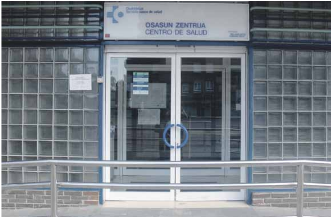
Traña-Matienakoa da eskualdeko erreferentziako zentroa.

Beraien herrietako zerbitzua bertan behera zegoela-eta, pediatarrengana Traña-Matienara joan behar izan zuten hainbat herritatik, joan zen astean