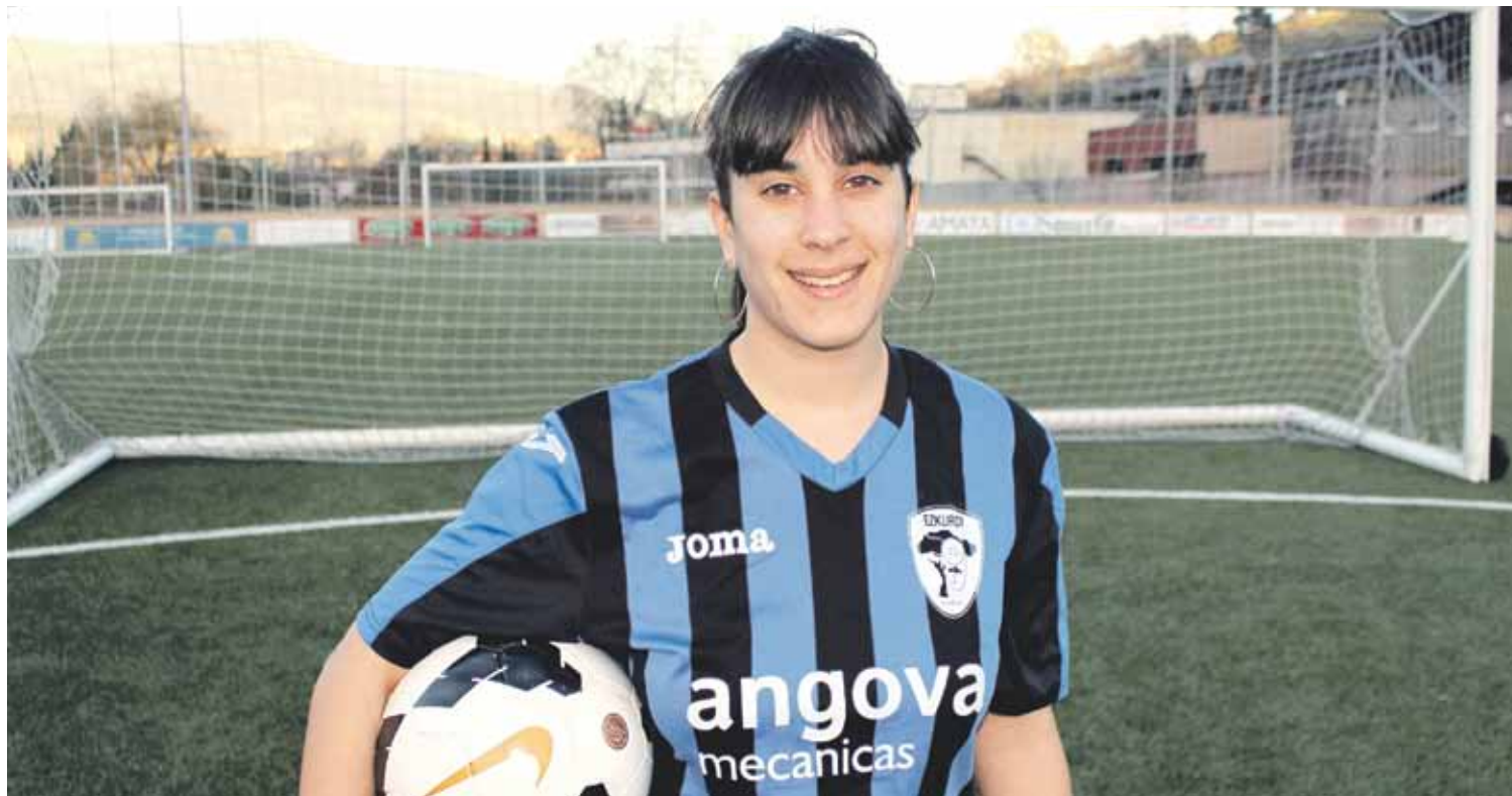
Bigarren faseko lehenengo partidua Gabon zahar egunean jokatuko dute, abenduaren 31n.