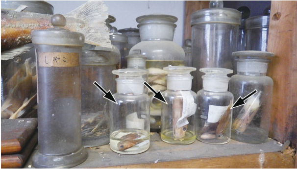
Fig. 2. Esaki's collection bottles in the Specimen Building of Fisheries when we found (arrows).

作に並べられていた。わずかに各1点が同標本室後室の棚（オオウナギ Anguilla marmorata ）と、農学部3号館6階の学生実験室の教壇下の戸棚（クモウツボ Echidna nebulosa ）から発見された。