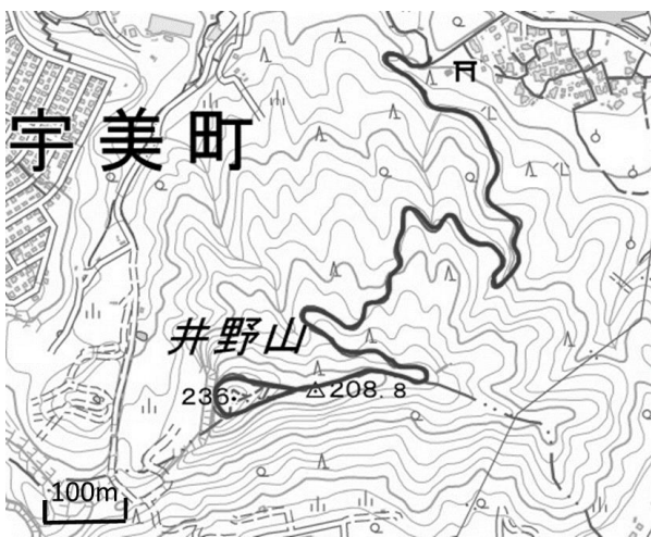
図3. 井野山調査ルート 国土地理院の電子地形図に調査ルートを追記した