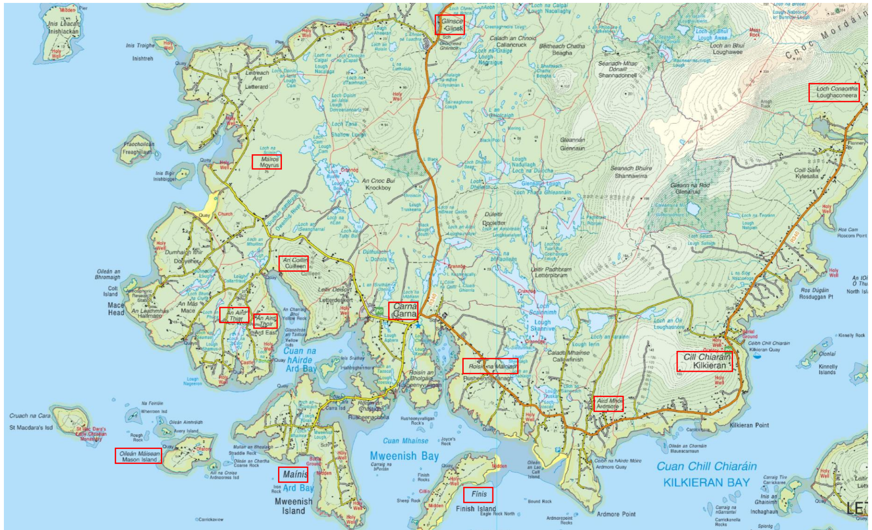
Mapa B: An Aird Thiar agus an Aird Thoir mar aon le bailte fearainn eile a luaitear sa saothar