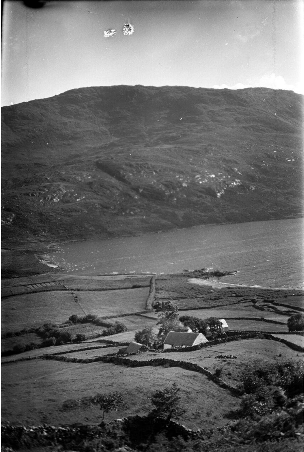
Seanadh Farracháin, An Fhairche, Co. na Gaillime, 1935