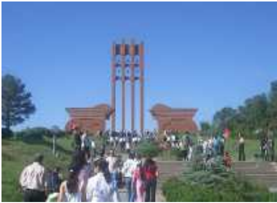
Het gedenkteken bij Sandarapat

In het verdrag van Sèvres in 1920 (het eindverdrag van de Eerste Wereldoorlog) werd Armenië als soevereine staat door Turkije erkend, maar in hetzelfde verdrag stond ook, dat Turkije grote delen van oost-Turkije zou teruggeven aan Armenië: dat is nooit gebeurd, omdat het hele verdrag door de nieuwe Turkse leider Atatürk als onacceptabel werd afgewezen.