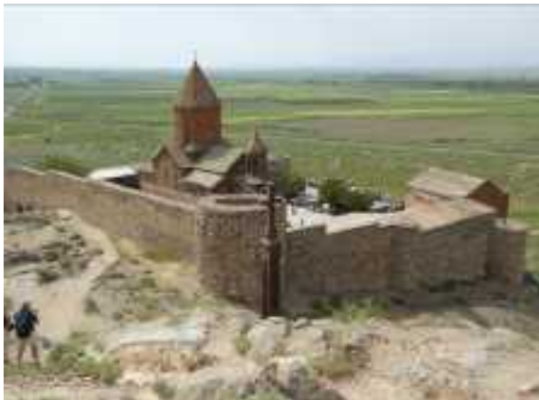
Khor Virap en de landbouwvlakte

Ons eerste doel is het klooster van Khor Virap. Het ligt praktisch op de grens van het niemandsland dat Turkije en Armenië van elkaar scheidt. Bij het klooster staan verkopers klaar met duiven in de hand. Tegen betaling kun je er een weg laten vliegen in de richting van de (onbereikbare, want in Turkije gelegen) Ararat.