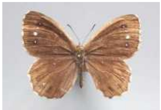
Satyrus amasinus ('Amasische' saterzandoog; Aziatische soort)