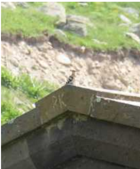
Hop op karavanserai Selim Pas

Emberiza melanocephala Miliaria (= Emberiza) calandra