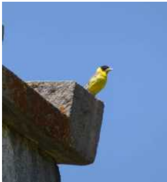
Zwartkopgors bij kerk van Amberd