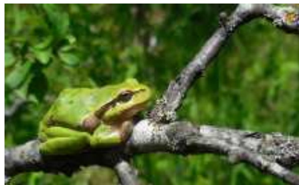
Boomkikker – Hyla arborea

Tot slot volgen we Tamara even het bos achter het klooster in. Nog voor we het geboomte bereiken is er al van alles, dat de aandacht trekt. Veel bekijks trekt de boomkikker die ik toevallig ontdek, als ik een bloedooievaarsbek op de foto wil zetten. Het dier gaat er zelfs eens extra goed en toegankelijk voor zitten in het zonnetje. De schat. Zie hem eens mooi zitten op een tak!