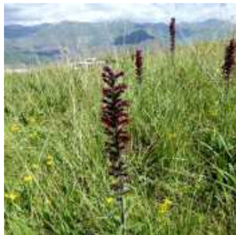
Echium russicum (fam. Boraginaceae)