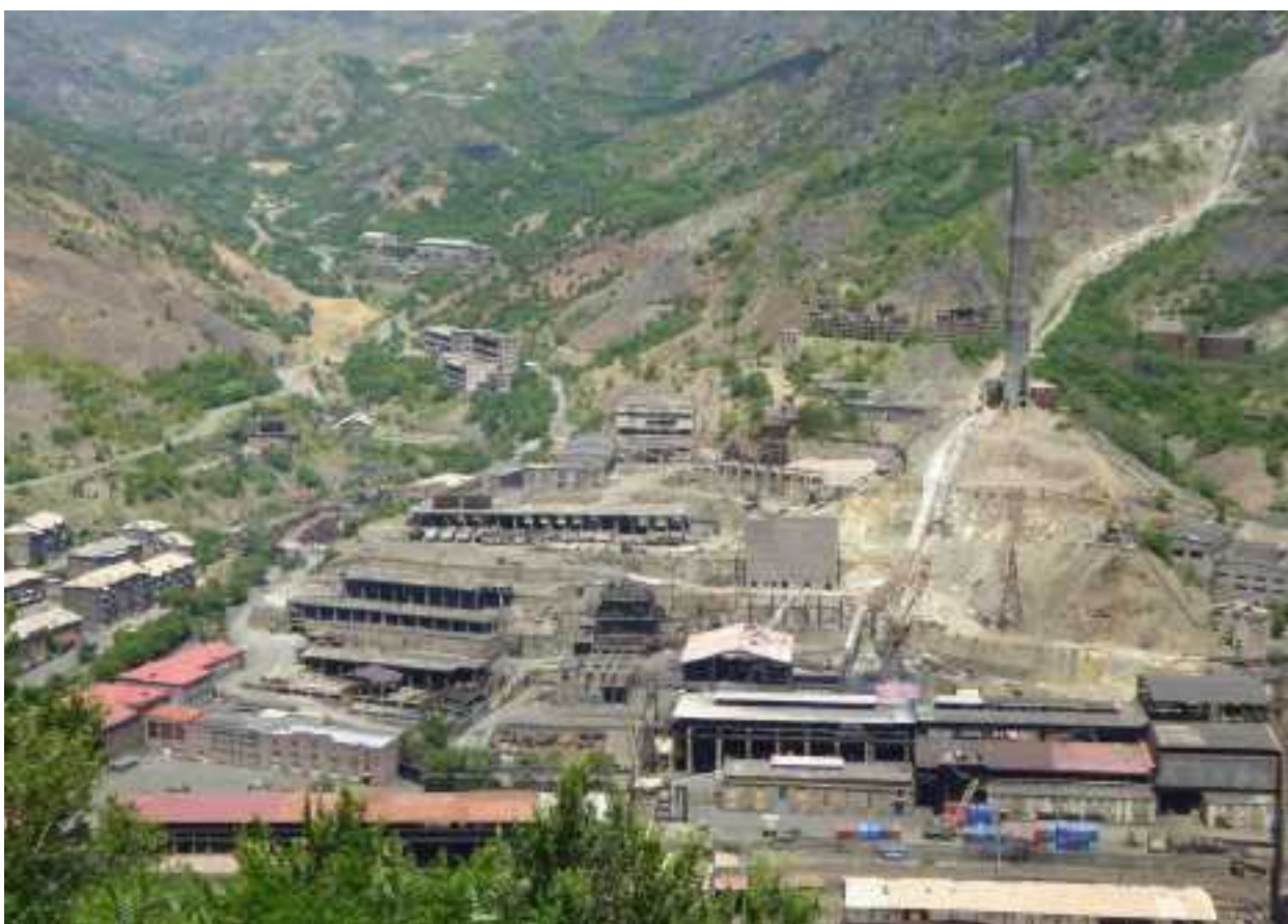
Uitzicht vanaf de arbeiderswijk bij Sanahin op de metaalfabrieken van Alaverdi. Hiervan is het grootste deel in onbruik. Alleen rechtsonder is nog een deel in gebruik om oud metaal om te smelten. De ongezonde rookgassen worden met een lange pijpleiding naar een bergtop afgevoerd.