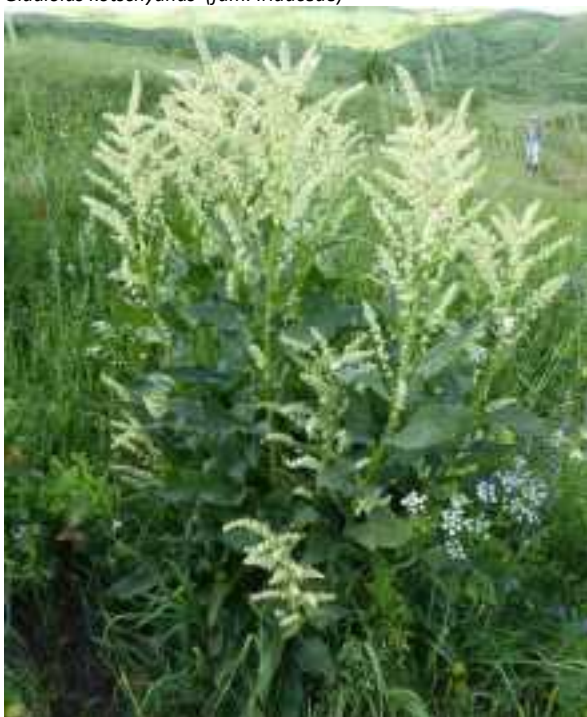
Beta corolliflora (fam. Amaranthaceae)