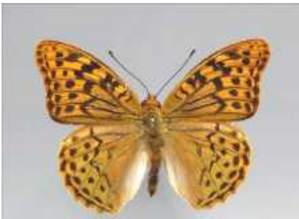
Argynnis pandora (kardinaalsmantel)