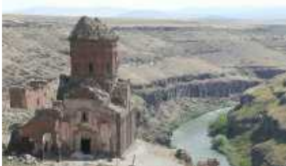
De ruïnes van Ani

Tegen de 7de eeuw na Chr. begint de opmars van de Arabische volkeren en in de laatste fase daarvan, rond de 9de eeuw, wordt vanuit Byzantium Bagratani als heerser over de resten van Armenië benoemd. Hij weet het rijkje te consolideren en maakt van Ani zijn nieuwe hoofdstad. Deze bloeiperiode duurde maar kort: in de 10de eeuw volgde een nieuwe golf van verwoesting door de Arabische Seldsjuken, waarbij duizenden kerken in het hele land, én in 1064 de hele hoofdstad Ani, werden verwoest. Deze periode wordt wel beschouwd als het begin van de Armeense diaspora.