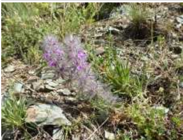
Stachys lavanduliflora (fam. Lamiaceae)