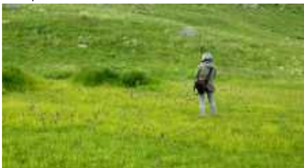
Tamara tussen de orchideeën

Vanwege het tijdstip en het mooie landschap wordt besloten om hier de lunch te nuttigen. Helemaal in rust lukt dit niet, omdat sommigen worden afgeleid door een witte kwikstaart in het beekje en een ortolaan op een rotspuntje boven onze hoofden, terwijl anderen nog geen genoeg hebben van de bloemenweelde rondom de zitstenen waarop wij eten uit onze lunchpakketten.