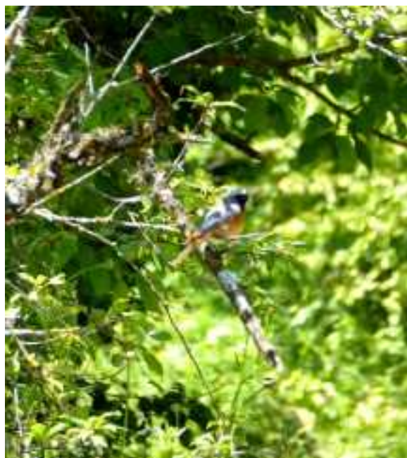
Gekraagde roodstaart (oostelijke vorm) bij Haghartsin