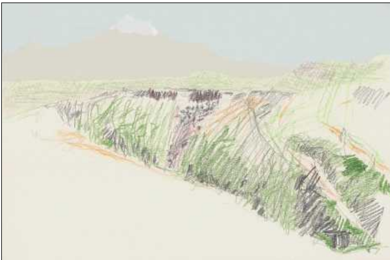
Ararat, gezien vanaf de Aragats (tekening Marten Postma)