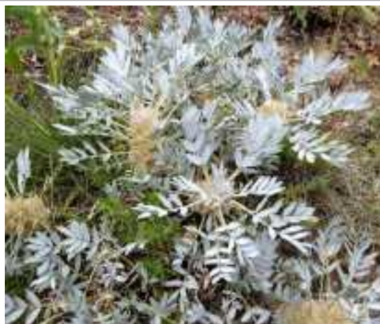
Astracantha microcephala (fam. Fabaceae)