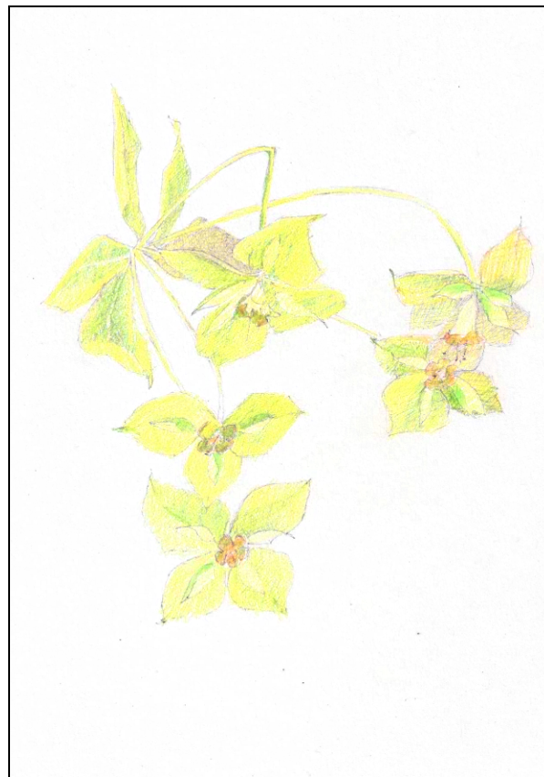
Een soort wolfsmelk ( Euphorbia ) (tekening: Marten Postma)