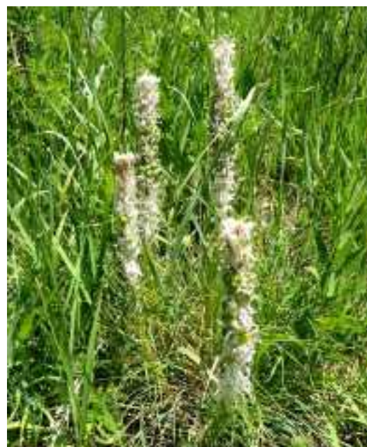
Asphodeline taurica (fam. Asphodelaceae)