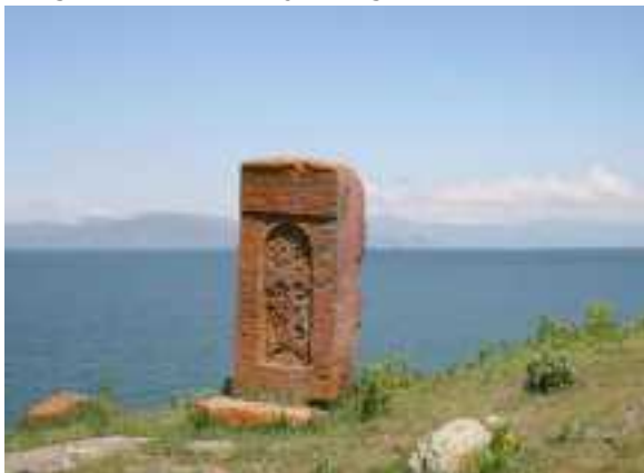
Chatsjkar aan het Sevan-meer

In Maastricht is op 15 mei 2016 een Armeense chatsjkar geschonken aan de stad door de Armeense gemeenschap van Maastricht, als dank voor het behoud van het religieuze en culturele erfgoed rond de heilige St. Servatius: hij werd geboren in Armenië.