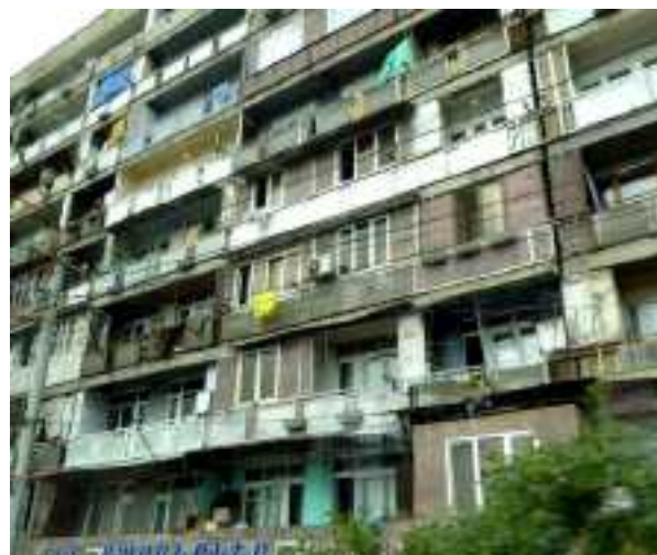
Als je nauwelijks geld hebt, kun je in Yerevan kiezen uit Chroetsjovflats of Stalinflats. Geen van beide is wonen volgens onze standaard.