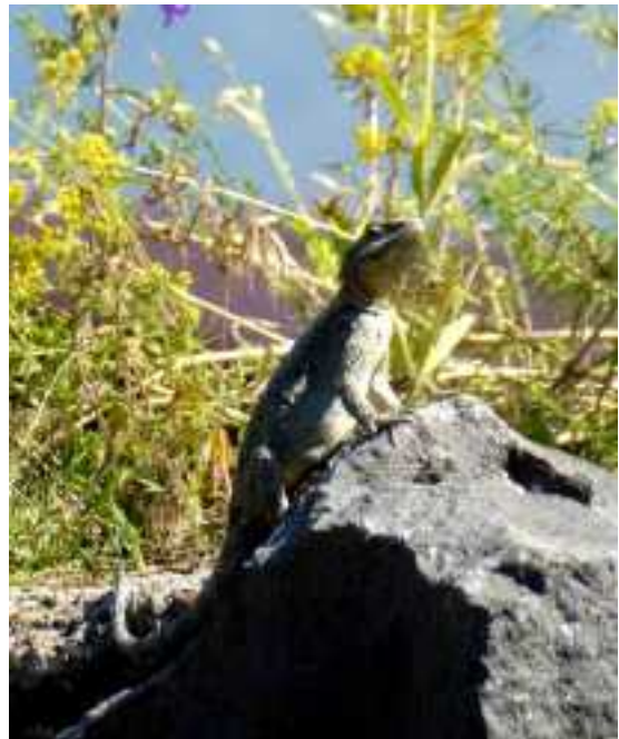
Kaukasische agame bij Haghpap