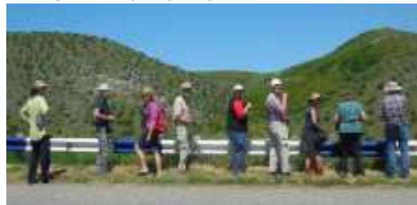
Verstoorde vogelliefhebbers in met steppevegetatie begroeide heuvels van N-Armenië.

ook hard en druk mijn camera af. "Dankjewel!" roep ik, en ga verder plantjes kijken.