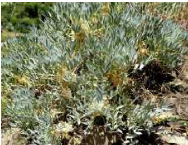
Astragalus strictifolius (fam. Fabaceae)

Hier volgen ter verlichting nog wat foto's van mooie plantenwaarnemingen.