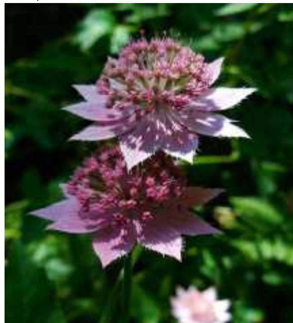
Astrantia maxima , een groot uitgevallen, roze Zeeuws knoopje.

Via haarspeldbochten slingeren we omhoog, richting Voskepar. Nu zijn we echt dichtbij Azerbeidzjan. Het uitzicht op het overgangslandschap van de bergen naar de laagvlakte, inclusief een blauw stuwmeer en een minivulkaankegel, is fraai. We krijgen er op verzoek twee minuten om een foto te maken, maar dat worden er meer dan tien. Deadlines worden tijdens deze trip sowieso moeiteloos overschreden door velen, zelfs de reisleader, maar ook niet gehoord ... Een stukje verderop laat Tamara voor de liefhebbers de bus stoppen, zodat we even het bos langs de weg in kunnen lopen. Hier staan erg veel bremrapen en Astrantia maxima , zeg maar een zeer groot uitgevallen Zeeuws knoopje, maar dan helemaal zachtroze van kleur. Bijzonder dat de bloem naar onze koningin is vernoemd. Of was het andersom? Anyway, wat een beauty!