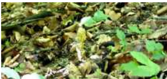
Vogelnestje – Neottia nidus-avis

Tamara ontdekt een vogelnestje (een soort orchidee) 'onder' ons, op de steile helling. Als ik voorover over de vangrail hang om zo dichtbij mogelijk te kunnen fotograferen, tuimelt mijn waterflesje uit mijn rugzak een paar meter naar beneden. Pieter vindt dat ik dat flesje daar niet kan laten liggen. "Echt niet? Het is steil en de grond heel rul; dat is gevaarlijk", werp ik tegen. Pieter is onverbiddelijk. "Oké ... Maar als ik dan toch ga, zal ik ook gelijk het vogelnestje van dichtbij fotograferen." Met de wandelstok van Marijke, die met gemak vele centimeters de rulle grond inzakt als steun, lukt het veilig. Zo, flesje terug én goede foto's van deze parasitaire orchidee. © Karin komt er ook al aan, zonder stok. Maar ja, zij is de jongste van de club.