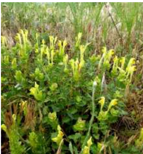
Scutellaria orientalis (fam. Lamiaceae)

Niettemin kunnen we terugzien op een reis met een respectabele hoeveelheid waargenomen, bijzondere planten: 455 soorten !