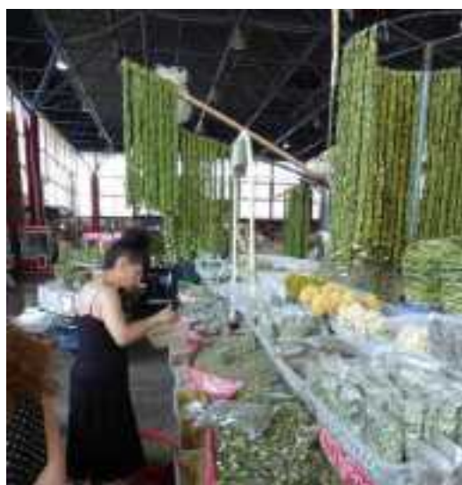
Enkele indrukken van de markt in Yerevan. Rechts onder hangen strengen krulzuring.