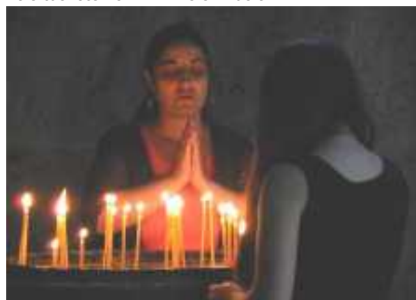
In gebed in het Hagartsin-klooster.

herhaal ik weer, ditmaal zonder stok. Als Karin dat kan, dan ... Ik zie er zelfs uitgebloeiende bleke bosvogeltjes en ook staan er weer vogelnestjes. Het allerlaatste stukje naar het klooster zijn we uit het hellingbos, maar op de rotsige wanden van de kloof bloeit ook van alles. Een fraaie ridderspoor doet zijn best om tussen het slangenkuid niet op te vallen, maar zijn schoonheid wordt toch opgemerkt. Dan dwarrelt de groep uit over het kloostercomplex, waarvan de vroegste delen uit het midden van de 11 e eeuw stammen. Het is recent gerestaureerd, wat duidelijk te zien is. Niet iedereen is gecharmeerd van de manier waarop (met duidelijk nieuwe steenblokken), maar ik vind het wel 'eerlijk' en informatief om zo te kunnen zien wat nieuw en oud is. Enkele Armeense monniken zitten er gemoedelijk in de schaduw van een grote boom, terwijl om hen heen vele toeristen en KNNV-ers krioelen.