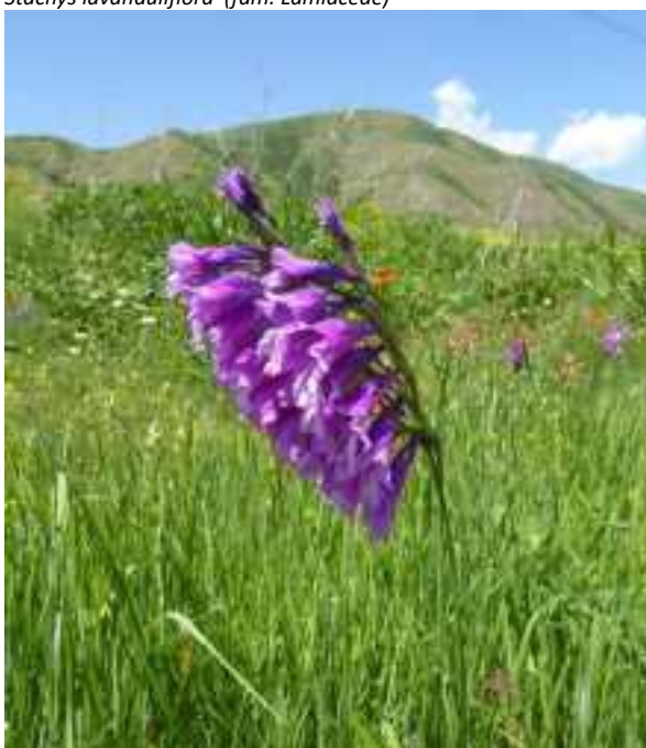
Gladiolus kotschyanus (fam. Iridaceae)