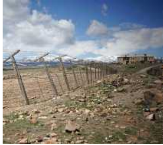
De grens tussen Armenië en Azerbeidzjan

Als gevolg van de oorlog om Nagorno-Karabach hebben Turkije én Azerbeidzjan hun grenzen met Armenië gesloten en voorzien van een 'ijzeren gordijn' met wachttorens en prikkeldraad. Armenië is over land slechts toegankelijk via Georgië en via Iran (één grenspost!).