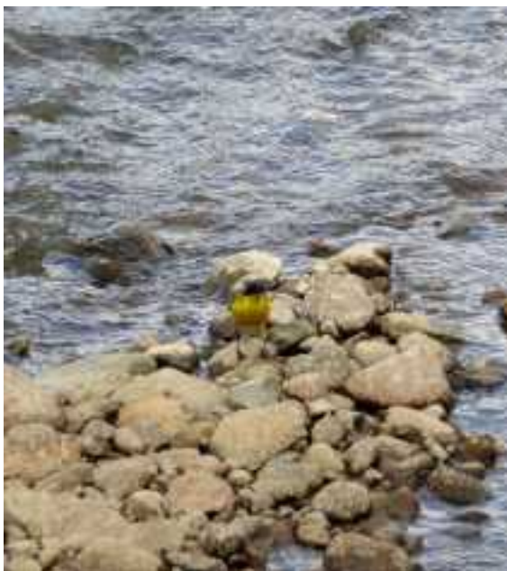
Gele kwikstaart op Selim Pas