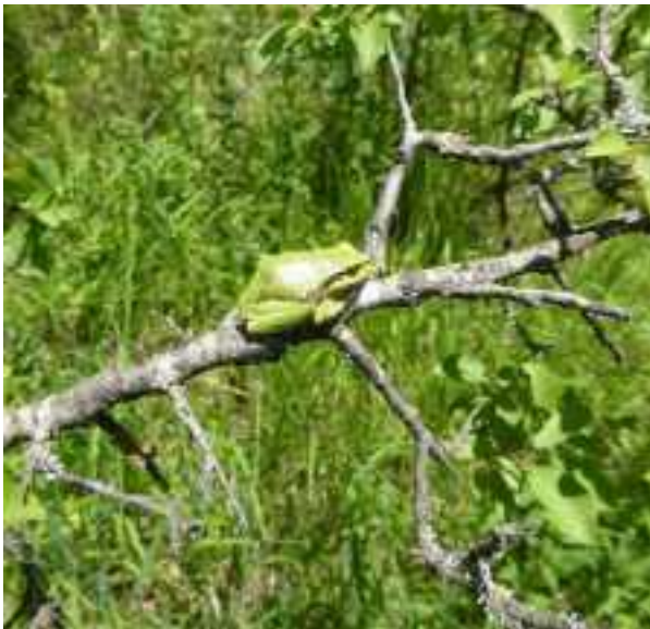
Boomkikker bij Haghartzin

Lacerta media (een soort 'smaragdhagedis') via https://observation.org/waarneming/view/136426782 Lacerta agilis (zandhagedis) via http://lietraloe.com/article/zandhagedis (Para)laudakia caucasia (Kaukasische agame) via https://de.wikipedia.org/wiki/Paralaudakia