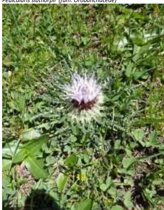
Jurinella subacaulis (fam. Asteraceae)