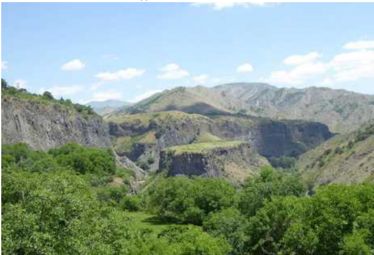
Het uitzicht over een niet door mensen verstoorde kloof vanaf de Hellenistische tempel bij Garni