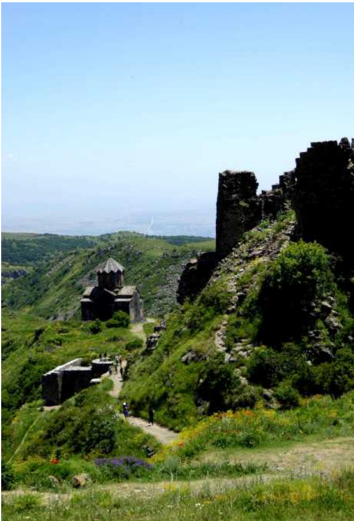
Kerk en burchtruïne van Amberd, op de voet van de berg Aragats